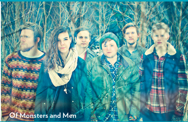
Of Monsters and Men

Émilie Côté anime notre blogue consacré à la musique sur lapresse.ca/blogue-musique