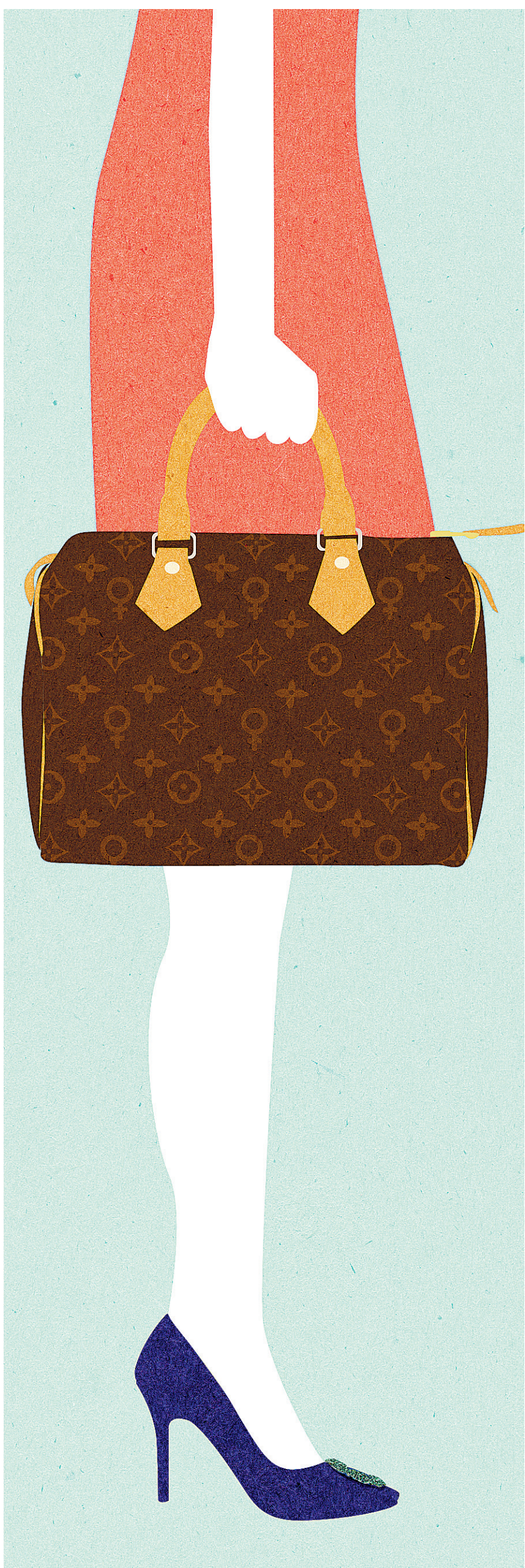
ILLUSTRATION VERÓNICA PÉREZ-TEJEDA, LA PRESSE

Le fameux « plafond de verre » qui restringerait l'ascension professionnelle et économique des femmes aurait-il enfin été fracassé ? Un ouvrage prétend que oui... et annonce même la fin prochaine du « mâle pourvoyeur » !