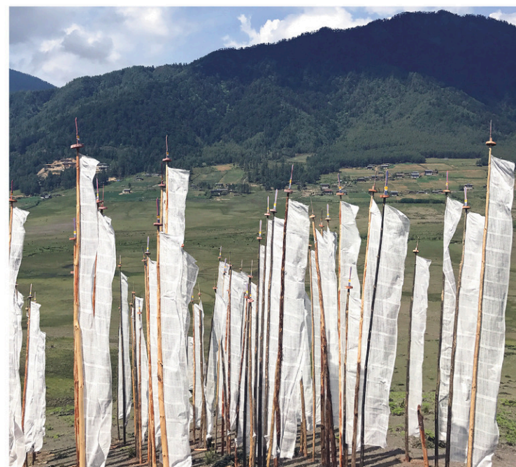
Partout, des drapeaux de prière sont plantés dans les lieux les plus venteux, comme ici, dans la vallée de Phobjikha.

À quelque chose malheur est bon: le brouillard qui nimbe les majestueux pins bleus et les cyprès altiers crée une atmosphère profondément