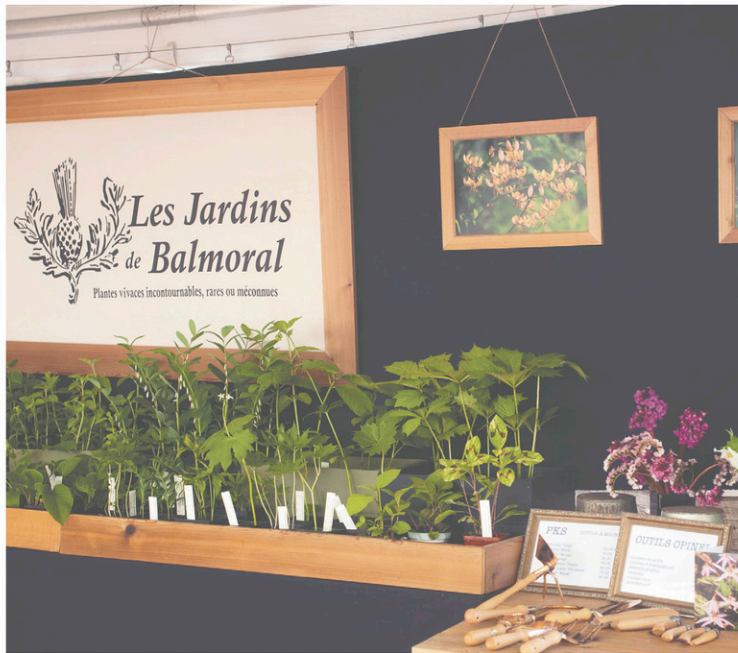
Nouveauté cette année: en plus des plantes, les Jardins proposent des semences et une collection exceptionnelle d'outils.