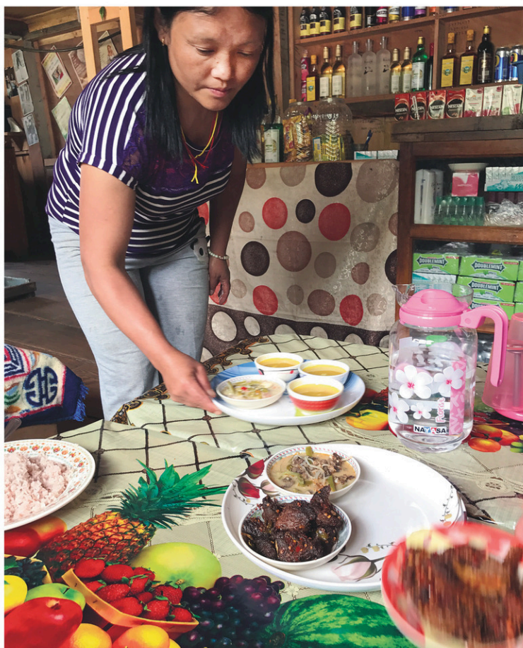
Tambouille bhoutanaise dans un boui-boui de bord de route, entre Paro et Trongsa.