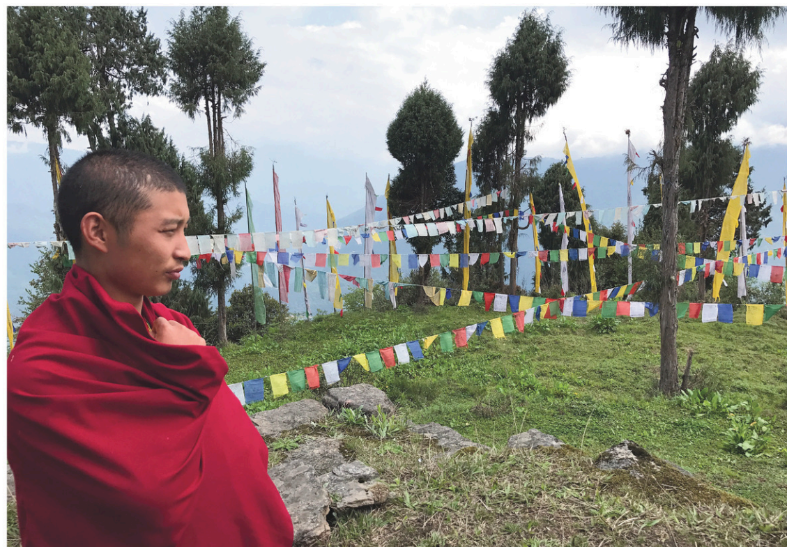
Ce jeune moine bouddhiste veille depuis trois ans sur des ermites reclus du monde, dans les hauteurs montagneuses de Trongsa.

Hormis certains lieux de Thimphu, la capitale en trop-plein de développement, le pays du dragon tonnerre affiche aussi une étonnante et