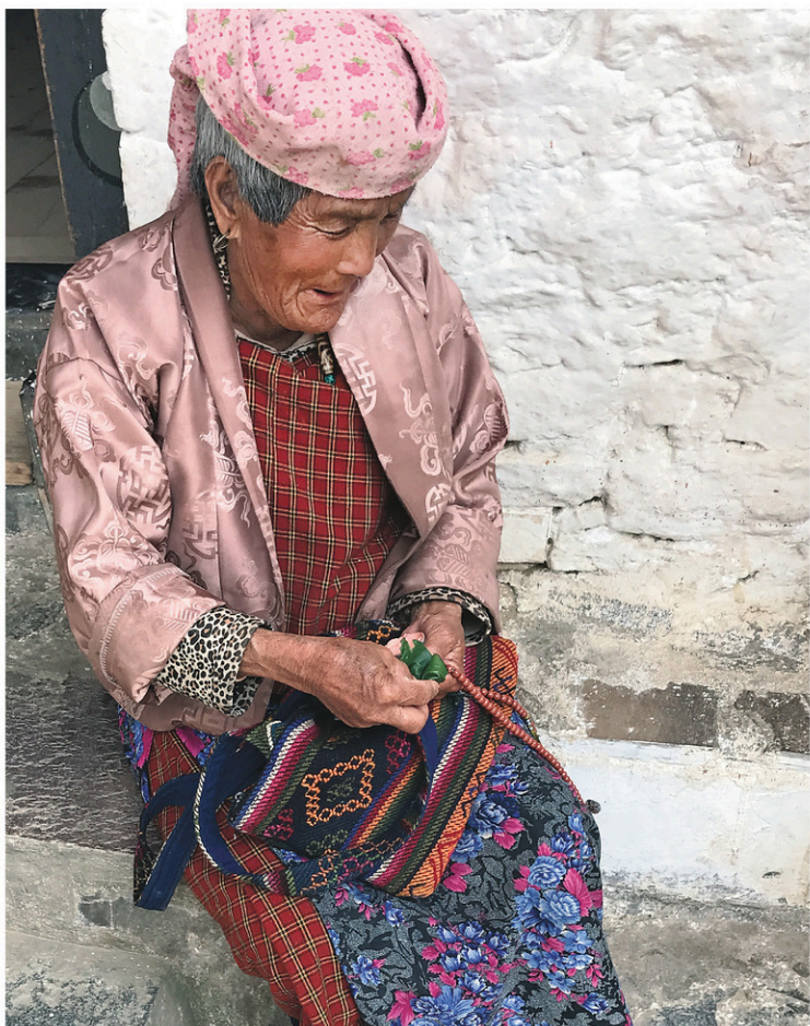
Une vénérable Bhoutanaise marque une pause à Chanangkha Lhakang, le temple de la Fertilité, à Thimphu. À droite: au Tshering Farmhouse, une ferme-auberge près de Paro, grand-papa trimballe petit-fiston sur son dos.

En 2006, le roi du Bhoutan annonce qu'il abdiquera au bénéfice de son fils et qu'il instaurera une monarchie constitutionnelle: ce n'est pas son premier coup d'éclat. En plus d'avoir épousé simultanément quatre sœurs, il a inventé le «bonheur national brut».