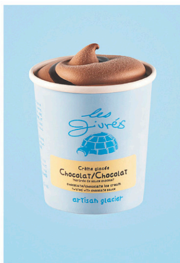
Petit contenant de crème glacée au chocolat des Givrés. À droite: un duo de cornets chez Hoche Glacé.

ment onctueux, au goût bien marqué. Par exemple, pour sa choco-noisette, le chef part d'une base de noisettes torréfiées... Imaginez le résultat en bouche!