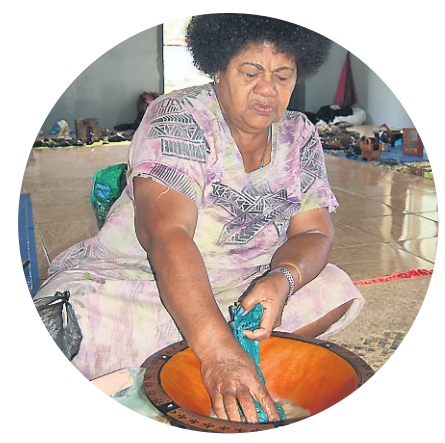
Tekka prépare le kava, une boisson qui engourdit la langue et les lèvres.

On peut être seul au monde aux îles Fidji. Mais on peut aussi faire la rencontre d'un peuple aux traditions un peu étonnantes.