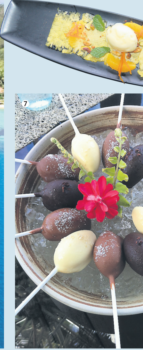
↓ Carpaccio d'ananas, concassé de pistaches, menthe et mandarines accompagné d'une crème glacée maison à la vanille servi à l'hôtel Likuliku.

Pour les vacanciers en quête de solitude ou de tête-à-tête romantiques, les mythiques îles Fidji sont en quelque sorte un paradis terrestre.