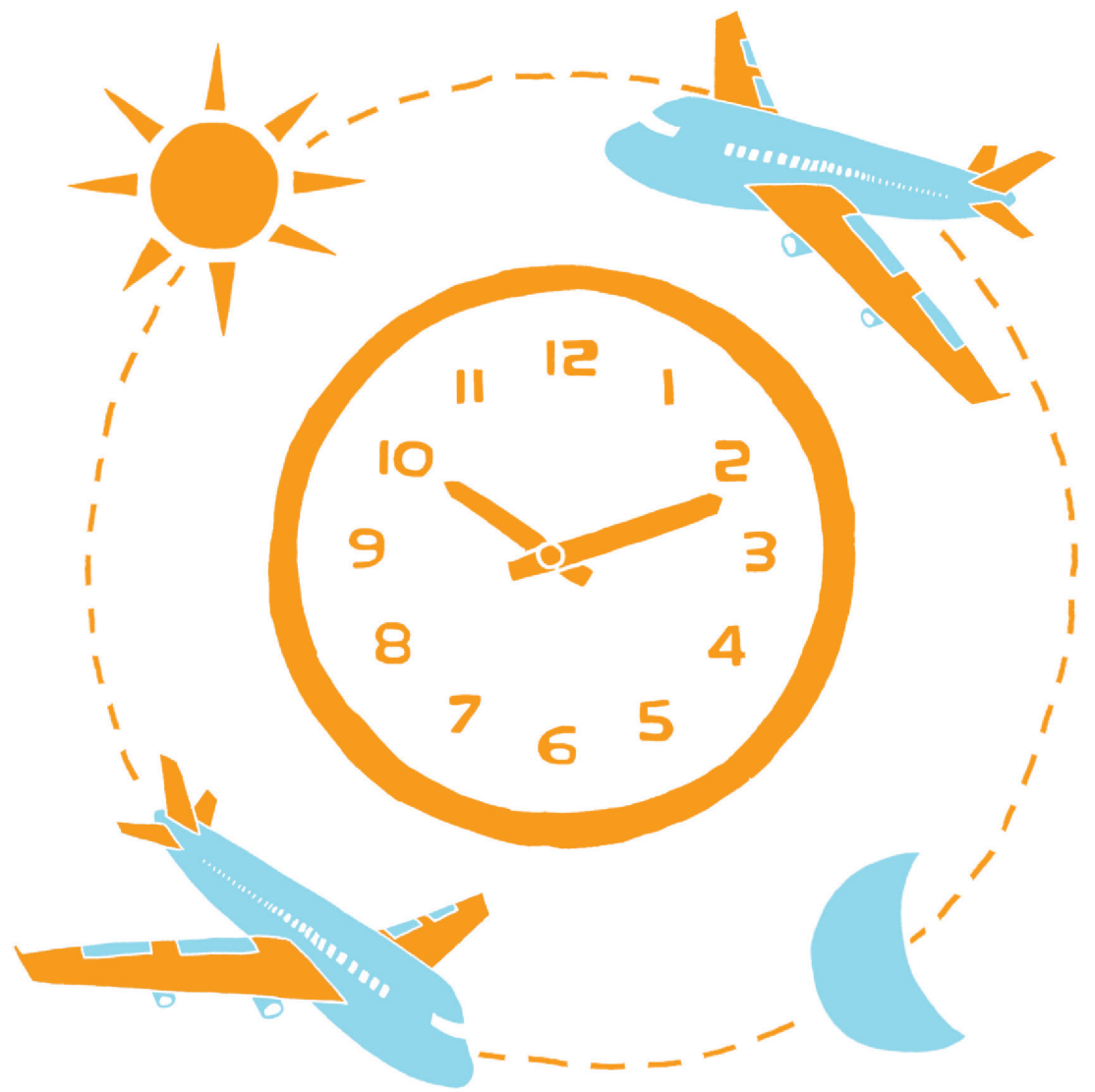
ILLUSTRATION CHARLOTTE DEMERS-LABRECQUE, LA PRESSE

Q Une fois rentré au bercail, on se sent parfois si fatigué