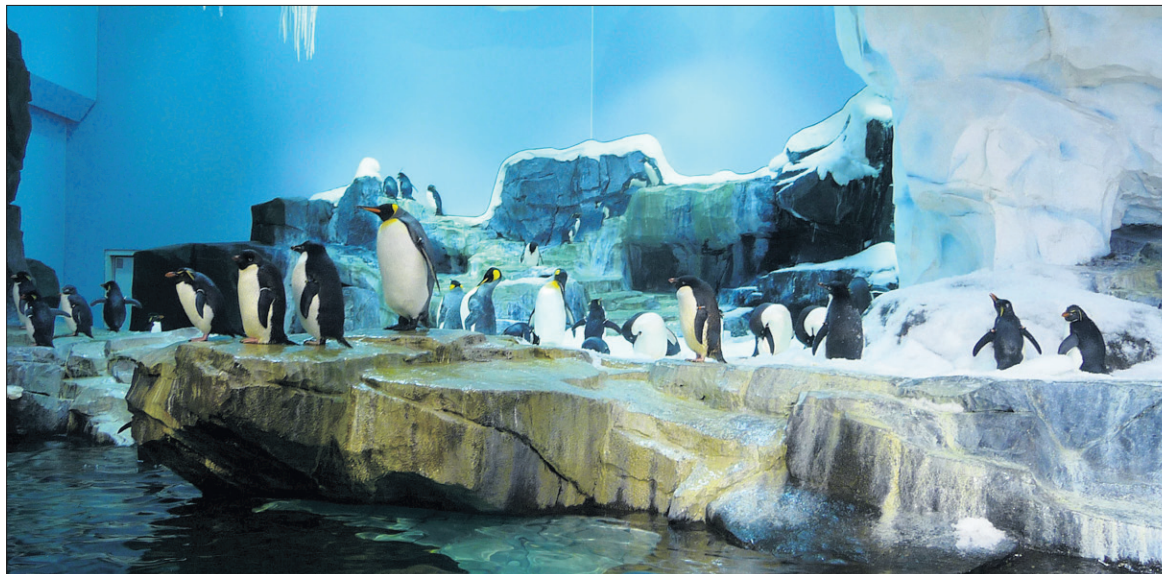
SeaWorld héberge 250 pingouins dans une reproduction de leur habitat.

Qui de mieux placé qu'un pingouin pour présenter son monde. C'est donc l'adorable Puck qui devient notre guide. Après une vidéo de mise en situation, le visiteur prend place dans un simulateur mobile où Puck présente les beautés et dangers de son univers de neige et de glace. «Nous avons beaucoup en commun avec les pingouins. Ils vivent en famille et s'entraident pour survivre», note