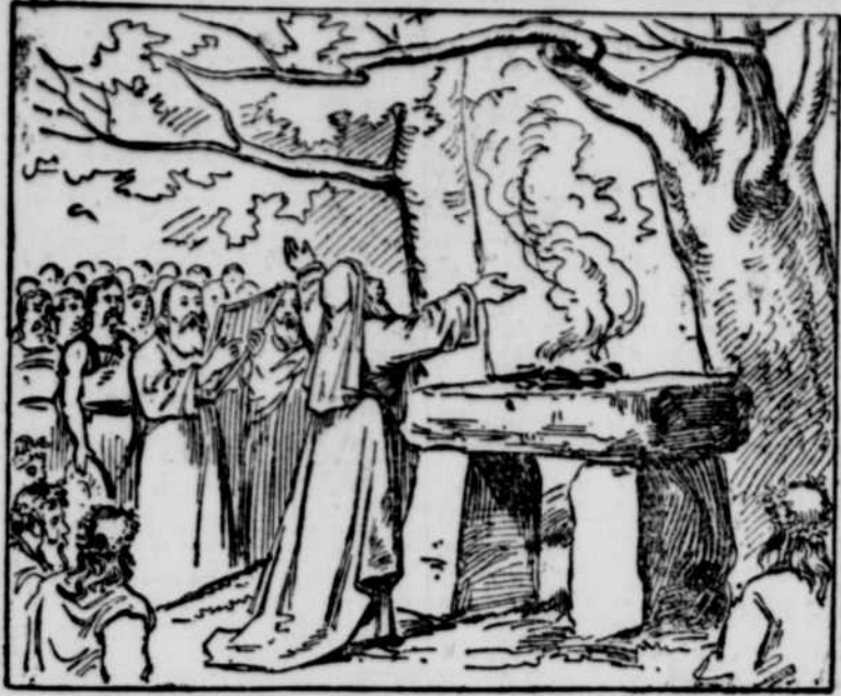
LE CULTURE DU FEU DANS LES GAULES

jours par un sacrifice ou capote, où l'on allumait de grands feux pour consumer la victime. Le feu le plus remarquable en ce genre est celui que Paul Emile, après la conquête de la Macédoine, alluma lui-même à Amphipolis, en présence de tous les princes de la Grèce qu'il y avait invités et dont la décoration lui avait coûté une année de préparatifs; toutes les matières qui le composaient n'étaient autres que des dépouilles prises sur l'ennemi.