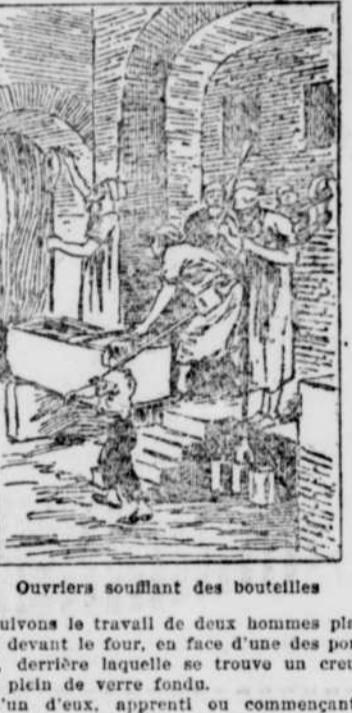
Ouvriers soufflant des bouteilles

LA ST-JEAN AU PARC ROYAL GRANDS FEUX DE LA ST-JEAN, ILLUMINATIONS ET FEU D'ARTIFICE, ATTRACTIONS SPÉCIALES DEUX JOURS DE RÉJOISSANCES