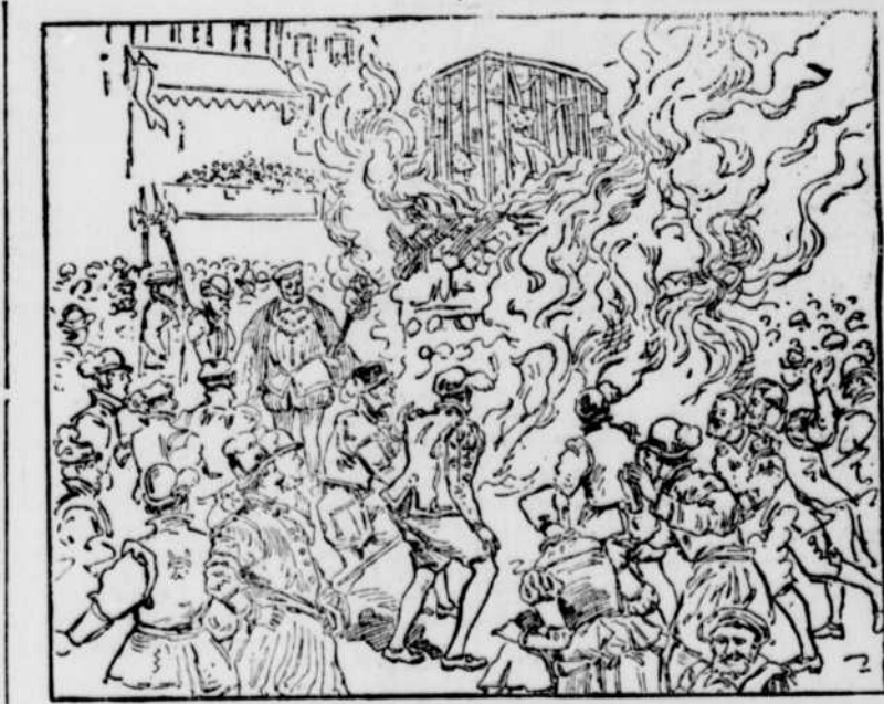
LES FEUX DE LA ST-JEAN A PARIS EN 1548