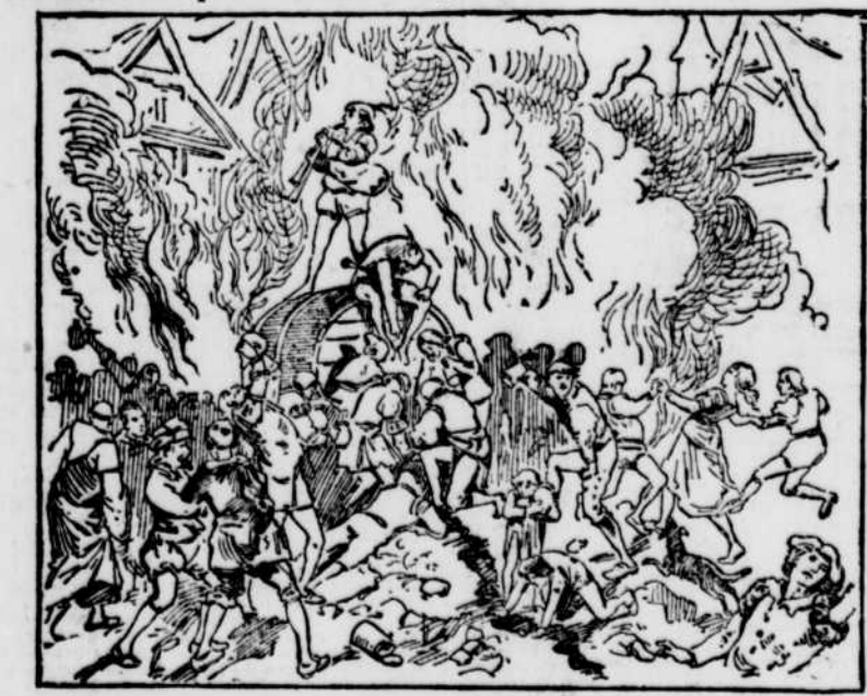
LES FEUX DE LA ST-JEAN A PARIS EN 1530

Les membres des sociétés de bienfaisance.