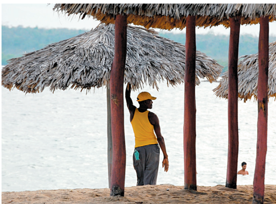
GENEVIÈVE TREMBLAY LE DEVOIR

■ Les indignés vus de l'intérieur, page B 5 ■ L'éditorial de Josée Boileau: Grand bol d'air, page B 4