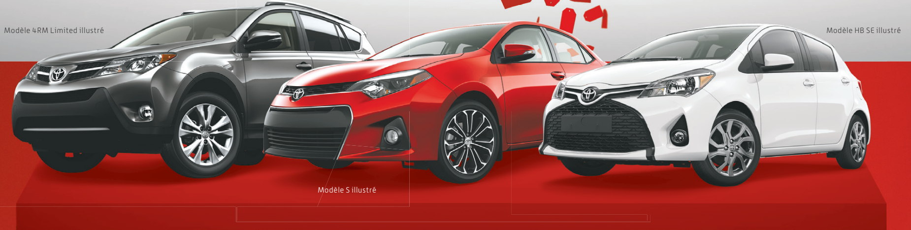
Modèle 4RM Limited illustré