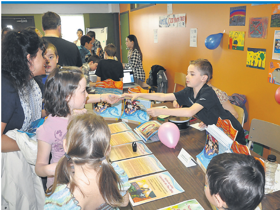
Les visiteurs se sont déplacés nombreux pour voir les projets réalisés par les jeunes de la région.

Si cette édition était la première à se tenir dans la Baie-des-Chaleurs, le retour de l'événement n'est pas garanti pour l'an prochain. « On espère de tout cœur que ça revienne, mais certains de nos plus gros partenaires financiers n'existeront plus l'an prochain. On va mettre tous les efforts possibles pour le refaire », a conclu Mme St-Pierre.