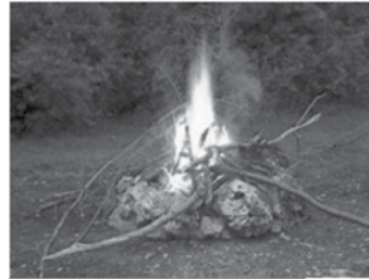
Feu à ciel ouvert PERMIS OBLIGATOIRE

En bon citoyen averti, je demande mon permis. Nous vous invitons à communiquer avec le directeur du Service de sécurité incendie en composant le 418 885-4977 afin de vous prémunir de votre permis. Merci de faire de Saint-Henri une municipalité sécuritaire pour tous!