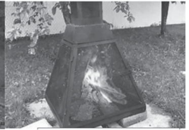
Feu dans un aménagement foyer extérieur, qui est muni d'un pare-étincelle et d'une cheminée PERMIS NON NÉCESSAIRE