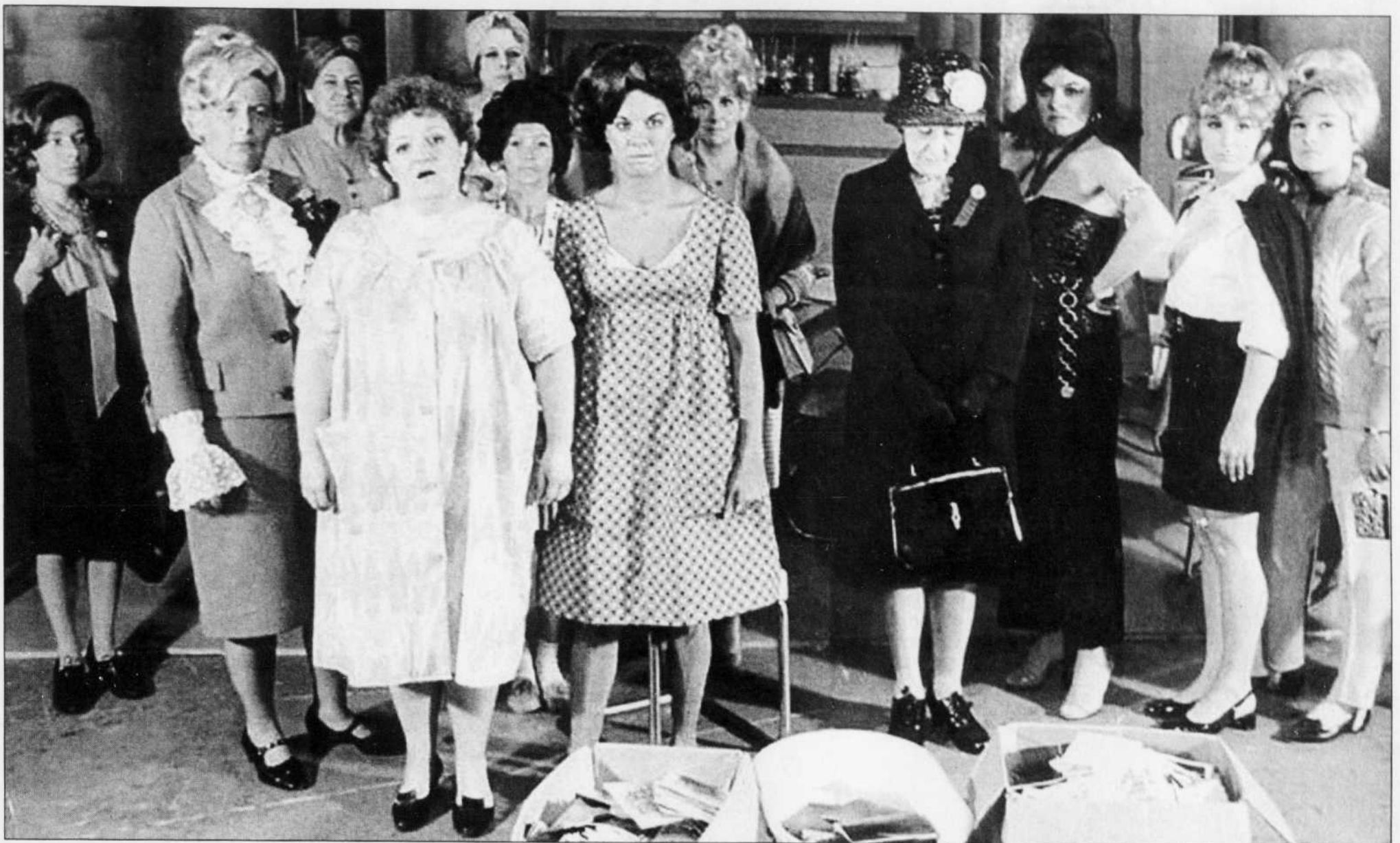
La littérature québécoise se situe dans la continuité de la pièce de théâtre Les Belles-Sœurs de Michel Tremblay. C'est au moment de l'émergence des premiers mouvements indépendantistes que cette pièce bouleversa totalement et durablement les règles du jeu littéraire québécois.

Enseignement de la littérature au collégial