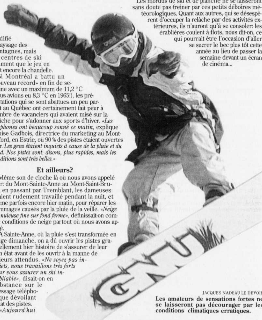
JACQUES NADEAU LE DEVOIR Les amateurs de sensations fortes ne se laisseront pas décourager par les conditions climatiques erratiques.

À Sainte-Anne, où la pluie s'est transformée en neige dimanche, on a dû ouvrir les pistes graduellement hier histoire de s'assurer de leur bon état avant de les ouvrir à la manne de skieurs attendus. «Ne soyez pas inquiets, nous travaillons très forts pour vous assurer un ski inoubliable», disait-on en substance sur le message téléphonique dévoilant l'état des pistes. «Aujourd'hui