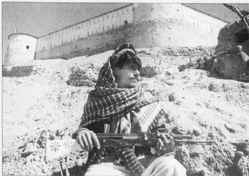
MARIO LAPORTA REUTERS

Selon le général Franks, environ 100 à 200 auraient été tués depuis le début de l'offensive samedi. « Nous avons fait des prisonniers », a-t-il ajouté. Environ 2000 troupes au sol participent à cette opération d'encer-