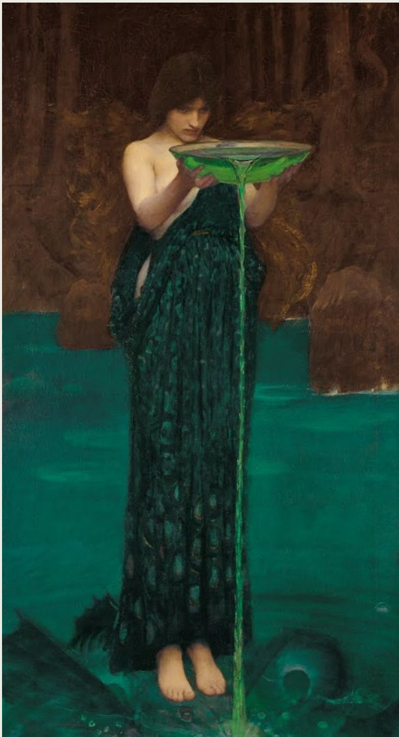
Circé Invidiosa , Waterhouse, XIX e siècle

Liées à la lune, les magiciennes de l'antiquité gréco-latine Hécate, Artémis, Circé et Médée connaissent les secrets de la vie et de la mort. Si Circé est davantage connue pour son rôle de femme fatale dans les aventures d'Ulysse, où elle réduit les hommes à l'état d'étalons ou de porcs, ce qui en dit long sur le rôle qu'elle leur attribue, le culte d'Hécate et d'Artémis se rapporte aux étapes fondamentales de la vie d'une femme. Dans les deux cas, elles sont associées à la fertilité et à la naissance, mais aussi aux forces infernales. Artémis, par exemple, peut à la fois faire naître les épidémies et les guérir; elle aide les femmes en couches, mais est aussi la cause de leur mort. Figure antithétique, la sorcière/magicienne donne et prend la vie.