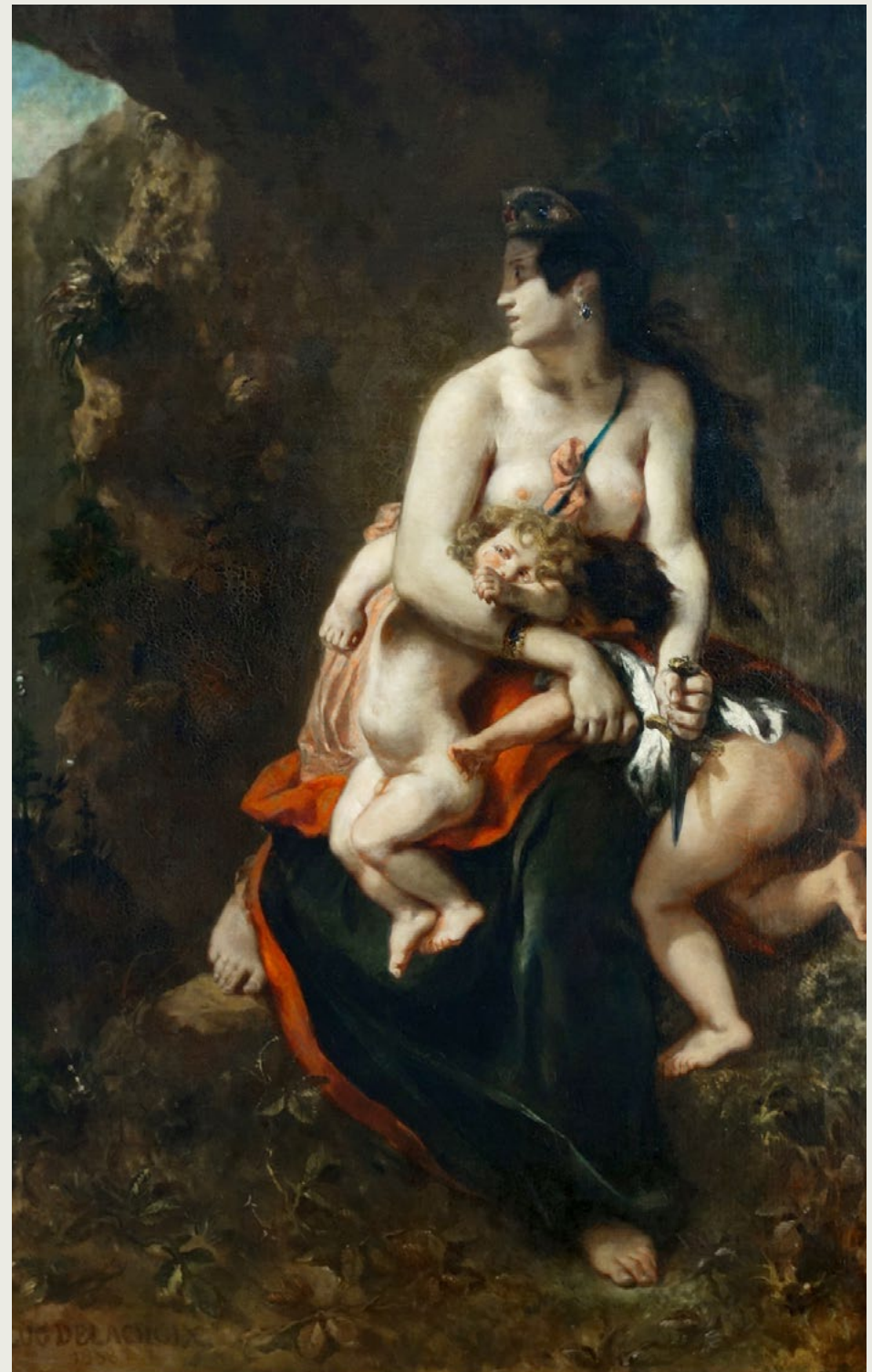
Médée , Eugène Delacroix, 1836–1838

La sorcière est un personnage que l'on associe souvent aux contes de fées. Représentation du monstre, au même titre que l'ogre ou le grand méchant loup, auquel l'héroïne ou le héros-enfant doit survivre (ou pas...), elle incarne la transgression de la figure maternelle. Parfois belle-mère, parfois munie de son balai et de son chaudron, attributs détournés de leur symbolique domestique traditionnelle, la sorcière trouve sa source dans des mythes antiques qui en font la détentrice d'un savoir mystique qui lui est propre, associé aux forces vitales de la nature.