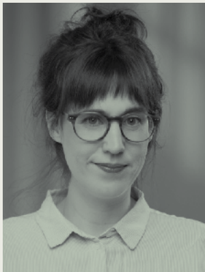
Sarah Berthiaume Traduction et adaptation