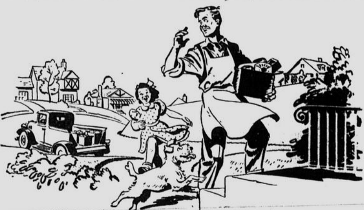
AVANT LA GUERRE: le jeune Jimmy Burke faisait la livraison des épiceries et il rêvait peut-être de posséder un jour son propre magasin.