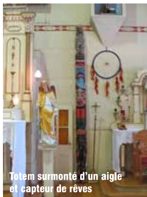
Totem surmonté d'un aigle et capteur de rêves

http://townshippersheritage.com/fr/article/rangers-du-major-rogers-1759