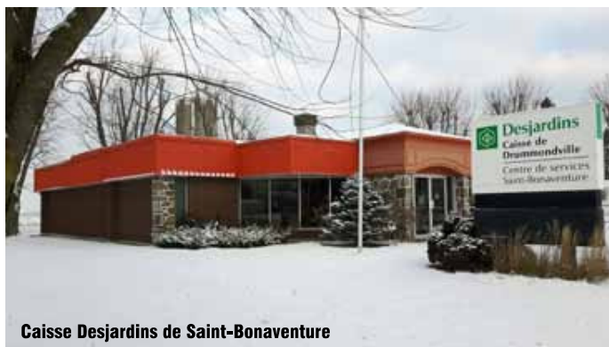
Caisse Desjardins de Saint-Bonaventure

• La firme Demers Pelletier, architectes, a été mandatée pour procéder aux esquisses et estimés des modifications à apporter pour la relocalisation des bureaux municipaux.