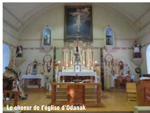
Le chœur de l'église d'Odanak