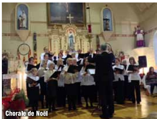
Chorale de Noël