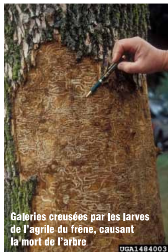
Galeries creusées par les larves de l'agrile du frêne, causant la mort de l'arbre