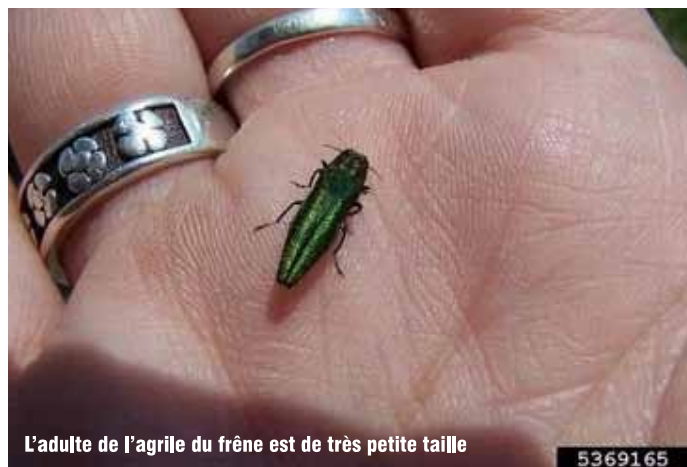
L'adulte de l'agrile du frêne est de très petite taille

http://ville.montreal.qc.ca/portal/page?_pageid=7377,91133623&_dad=portal&_schema=PORTAL