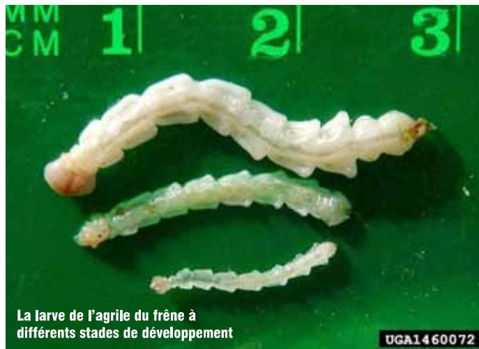
La larve de l'agrile du frêne à différents stades de développement