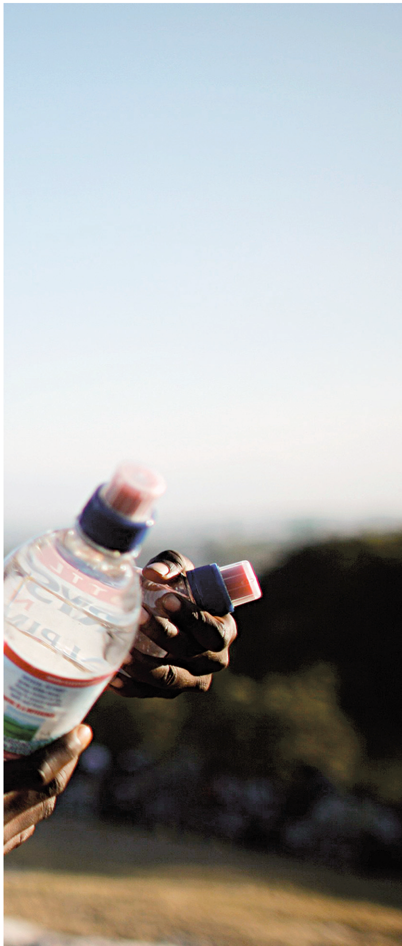
JORGE SILVA REUTERS