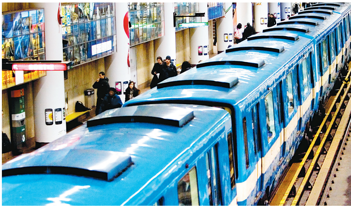
ANNIK MH DE CARUFEL LE DEVOIR

plissent les conditions imposées, la STM n'aura d'autre choix que de lancer un nouvel appel d'offres. Dans le cas contraire, le gouvernement estime que la STM pourra sans crainte signer le contrat avec Alstom et Bombardier.