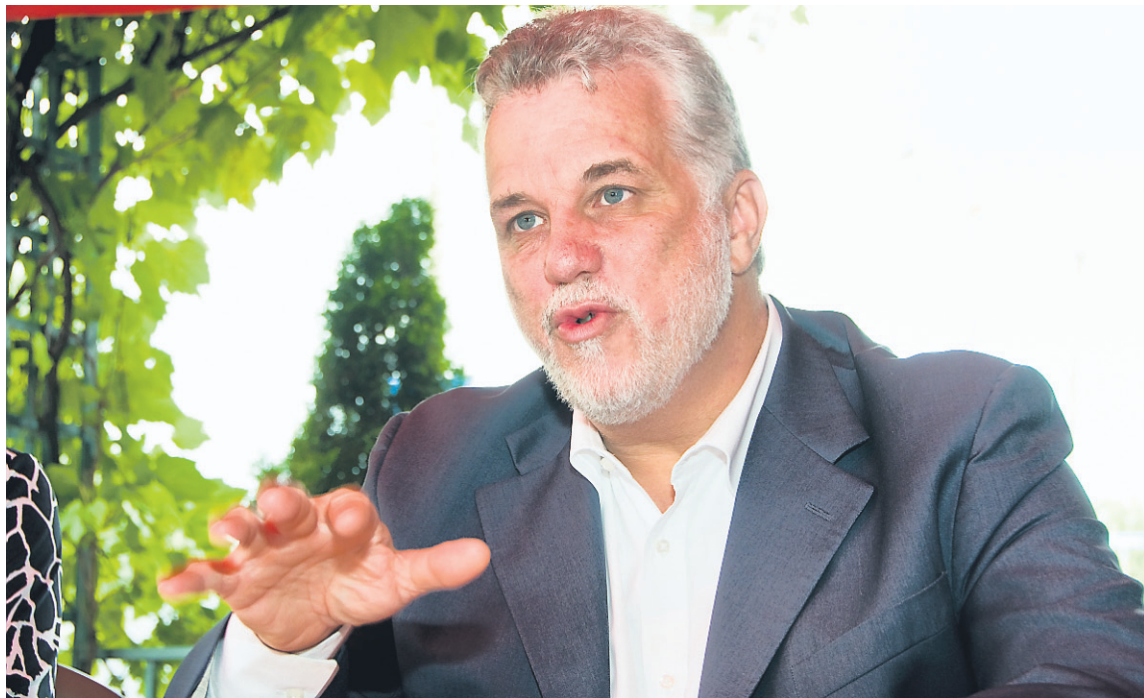
Certaines des propositions qui seront débattues lors du congrès de la Commission-Jeunesse du Parti libéral s'inscrivent dans la démarche du chef, Philippe Couillard, qui revoit le programme de la formation.

La Commission-Jeunesse propose ainsi d'éliminer les pénalités qui sont parfois imposées aux travailleurs ayant un revenu correspondant au seuil de faible revenu, voire inférieur. Une étude de