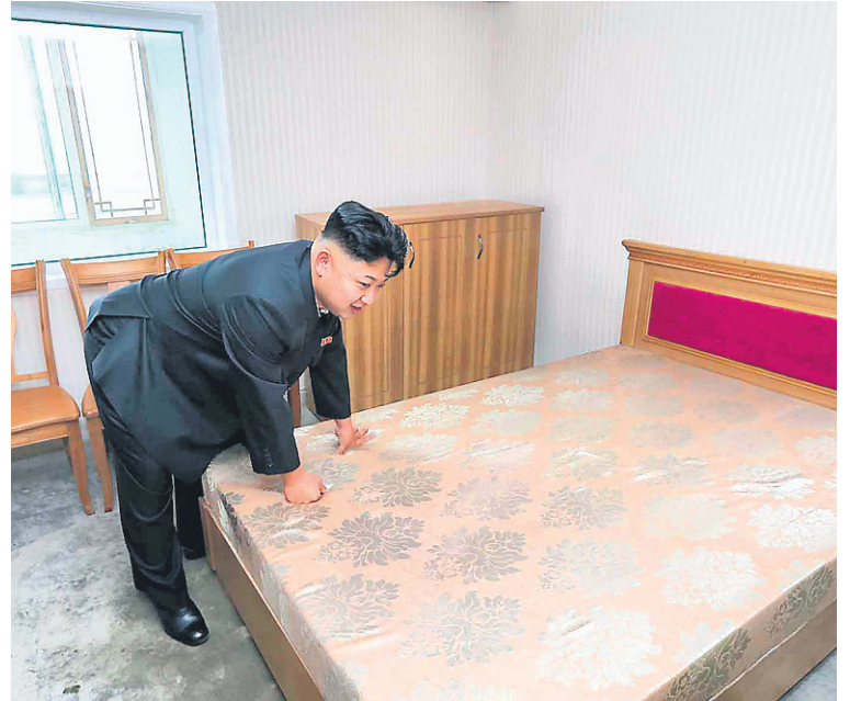
un matelas...