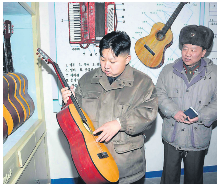
et une guitare.

Cette idée fait partie du «Mouvement Chollima», initiative lancée en 1956 par Kim Il-sung pour inciter les travailleurs à se surpasser. Le père de Kim Jong-un, Kim Jong-il,