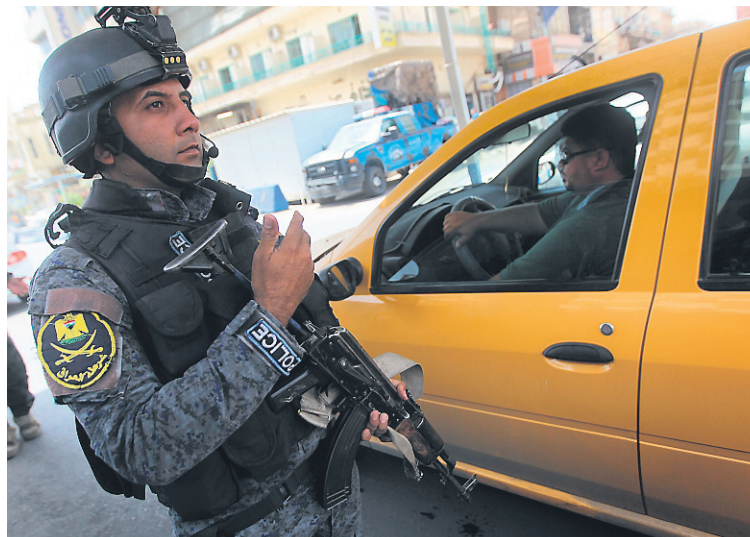
La sécurité a été resserrée à Bagdad depuis l'attaque armée qui a permis à une centaine de prisonniers de s'échapper de la prison d'Abou Ghraïb, le 22 juillet.