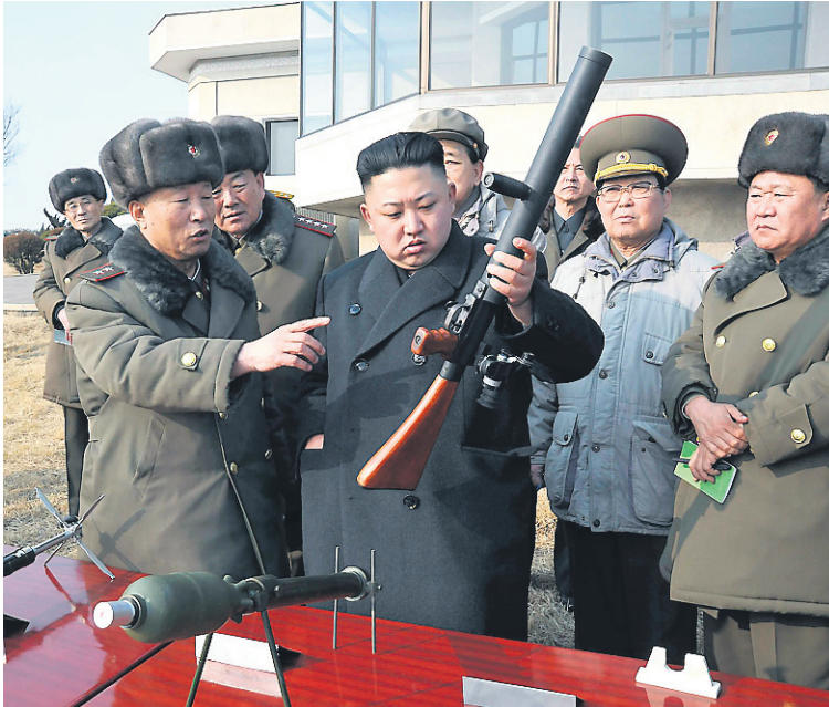
Le dictateur nord-coréen Kim Jong-un à pied d'œuvre, inspectant une arme...

Étrange? Absolument. Mais l'affaire est loin d'être unique. Kim Jong-un penché sur une guitare, l'air grave. Kim Jong-un qui scrute une mitrailleuse. Kim Jong-un inspectant un jeu pour enfants. Des dizaines de photos du même type ont été publiées par le régime. Oubliez le naturel: elles sentent la mise en scène à plein nez, et avec le visage poupin du dictateur et son innéparable coupe de cheveux, le résultat est immanquablement cocasse à nos yeux d'Occidentaux.