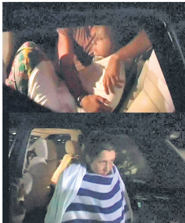
IMAGE TIRÉE D'UNE VIDÉO