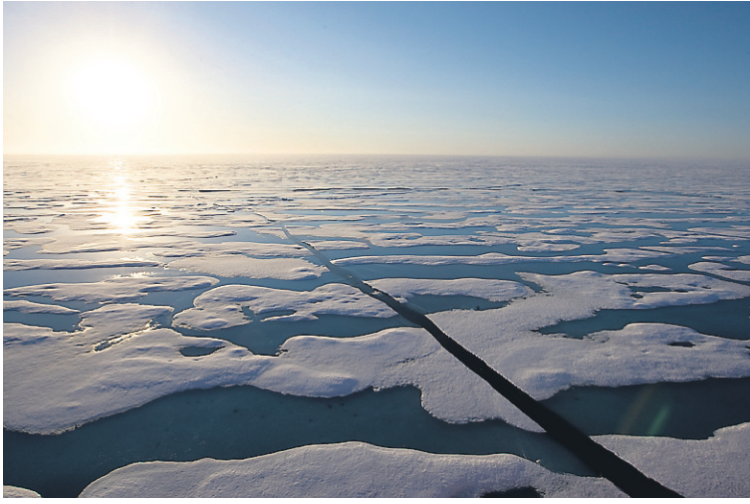
Le Canada a quatre mois pour faire part de ses revendications territoriales sur l'Arctique, dont plusieurs secteurs sont convoités par la Russie.