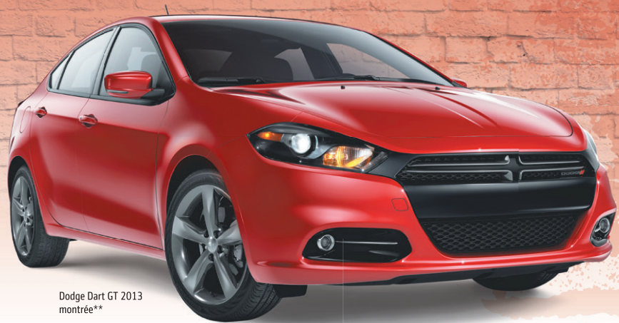
Dodge Dart GT 2013 montrée**