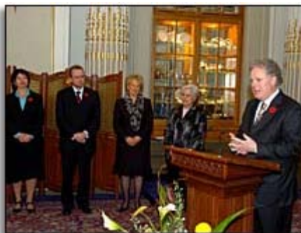
Intervention de M. Jean Charest, premier ministre du Québec

Cérémonie marquant l'approbation de la Convention de l'UNESCO par le gouvernement du Québec Hôtel du Parlement - 10 novembre 2005