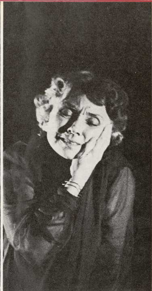
Madeleine Renaud Jean Dessailly