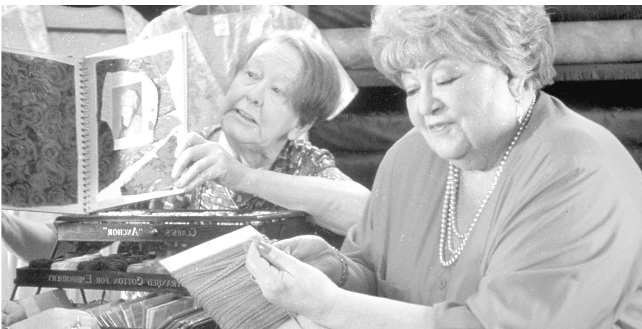
Pauline et Paulette, s'inscrit dans la lignée de ces petits films touchants et sympathiques dont le grand mérite est de faire autant de bien au cœur qu'à l'esprit.