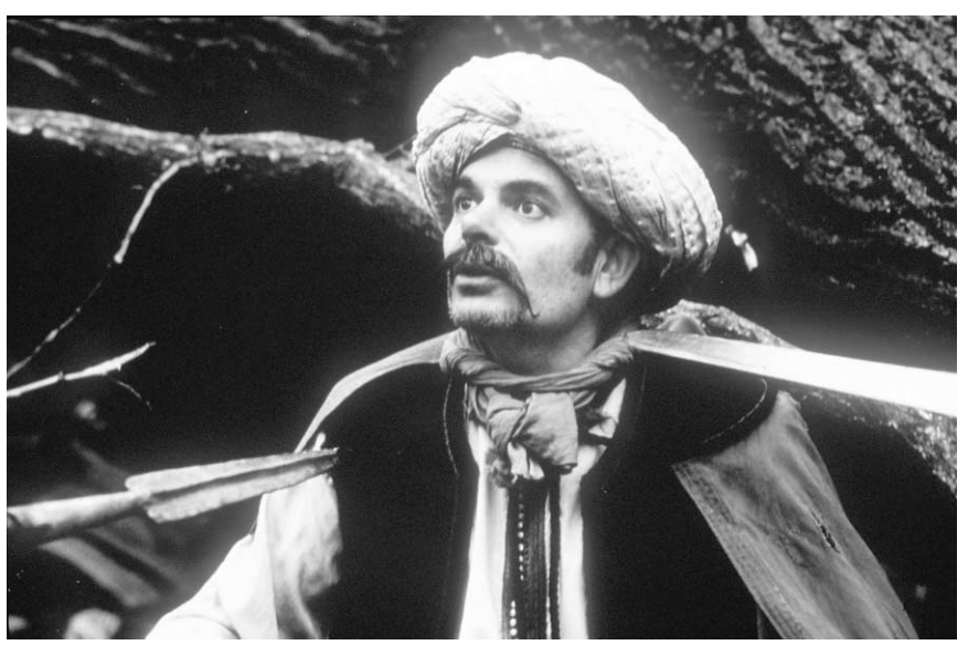
Jean-Pierre Darroussin dans un mauvais rêve où, transformé en Sarasin, il est pourchassé par l'armée de Charles Martel...