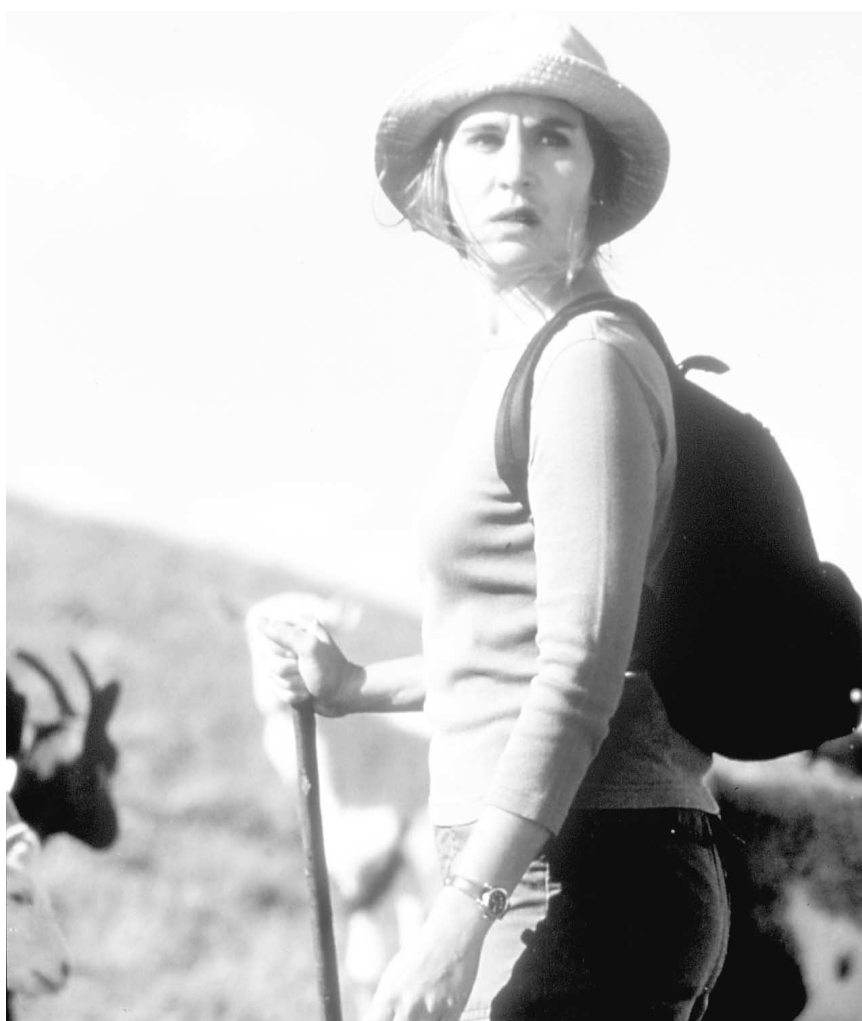
Mathilde Seigner, dans le rôle d'une citadine qui s'improvise agricultrice, donne la réplique à Michel Serrault dans Une hirondelle a fait le printemps .

« Et puis, poursuit-il, il y a aussi le fait que certaines personnes ont tendance à penser que les paysans sont forcément réactionnaires. Subsiste en effet encore de nos jours une petite suspicion qui fait que le monde paysan est associé, toujours dans l'esprit de certaines personnes, au régime de Vichy à l'époque de la dernière Grande Guerre. Je crois que, même si ça n'a strictement rien à voir, il y a un blocage par rapport à ça. »