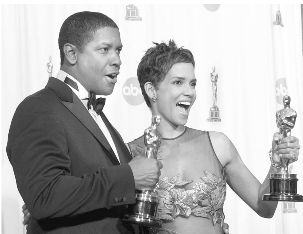
Denzel Washington et Halle Berry lors de la dernière soirée des Oscars.