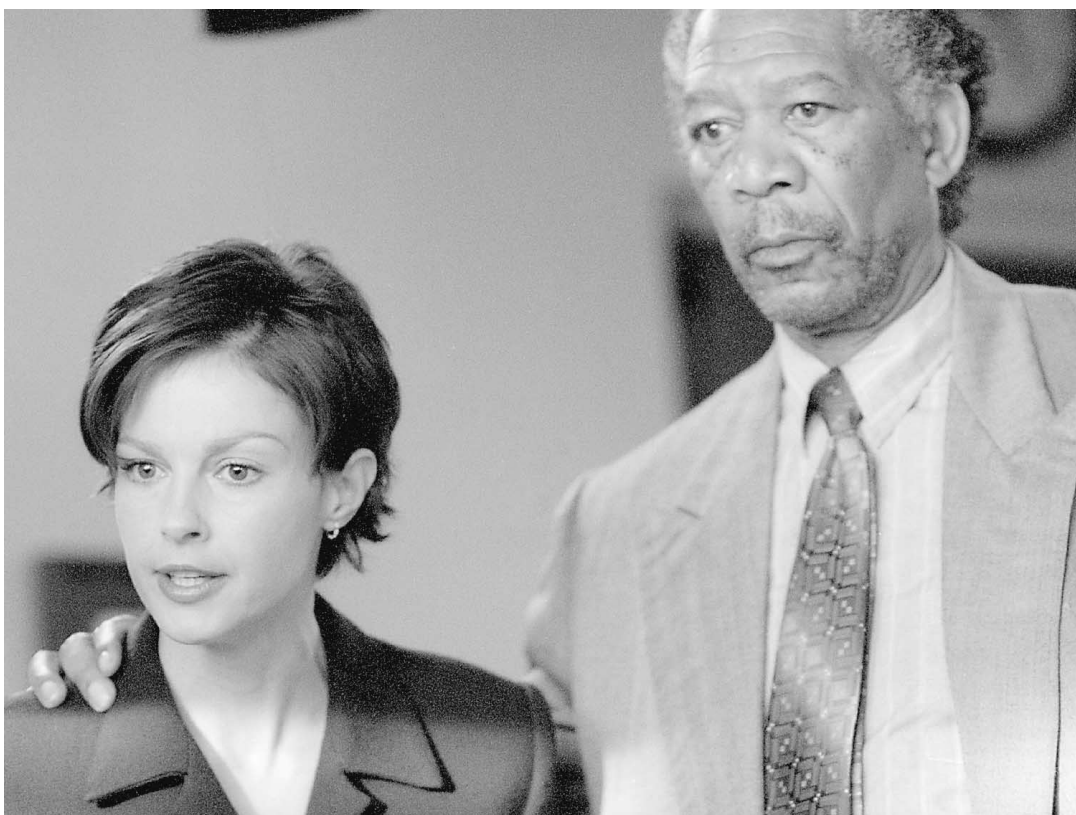
Ashley Judd et Morgan Freeman incarnent dans High Crimes deux avocats appelés à défendre un ex-militaire accusé de meurtre.

Ce n'est cependant pas tant le thème de la vengeance que la possibilité de jouer sur tous les registres qui attire Ashley Judd à la lecture d'un scénario. Sa Claire Kubik passera, en effet, par toute la gamme des émotions lorsqu'elle réalisera que l'homme qu'elle aime depuis des années n'est peut-être pas le doux et gentil mari qu'elle croit. « Pour que j'accepte de jouer dans High Crimes , Carl Franklin (le réalisateur) a néanmoins dû mettre