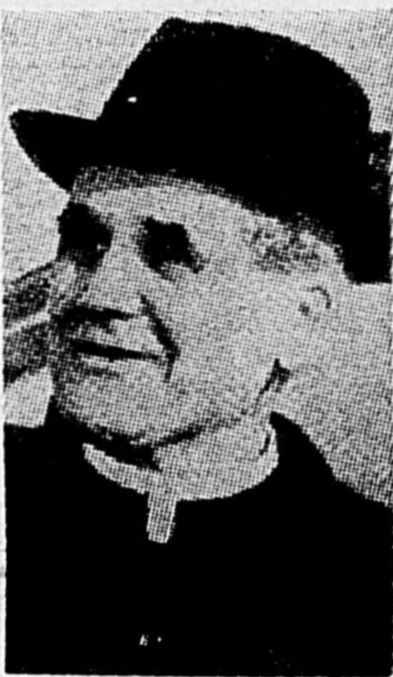
Le cardinal Léger

Le cardinal Paul-Emile Léger vient d'être nommé gagnant du prix de $50,000 de la Banque Royale "pour une vie consacrée à l'homme du peuple".