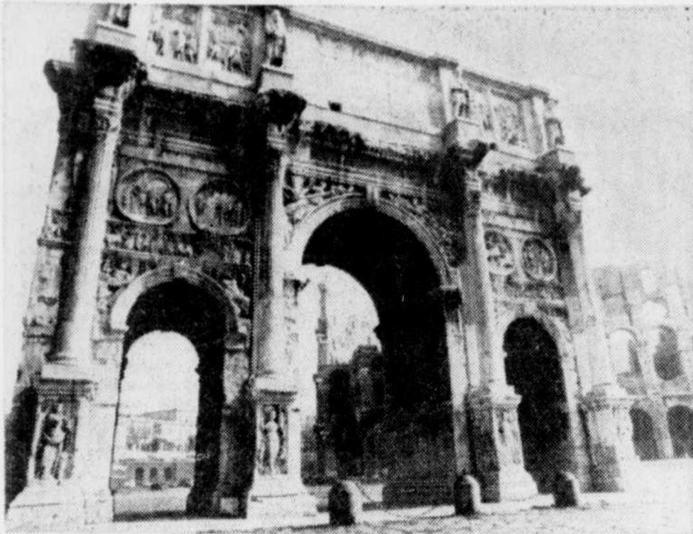
L'arc de Constantin à Rome, comme d'autres monuments de l'Antiquité, est en péril.