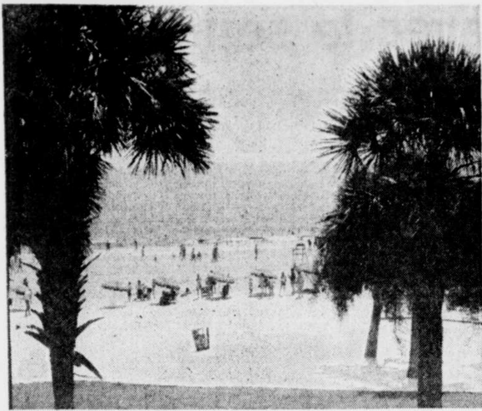
La plage et le soleil, attractions naturelles.