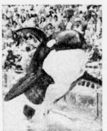
Les spectacles de mammifères marins sont parmi les plus recherchés en Floride.

Enfin, un conseil, évitez de changer d'idée au retour pour rentrer par un autre moyen de transport. A ce moment, tous les tarifs spéciaux dont vous auriez pu bénéficier tombent de façon dramatique.