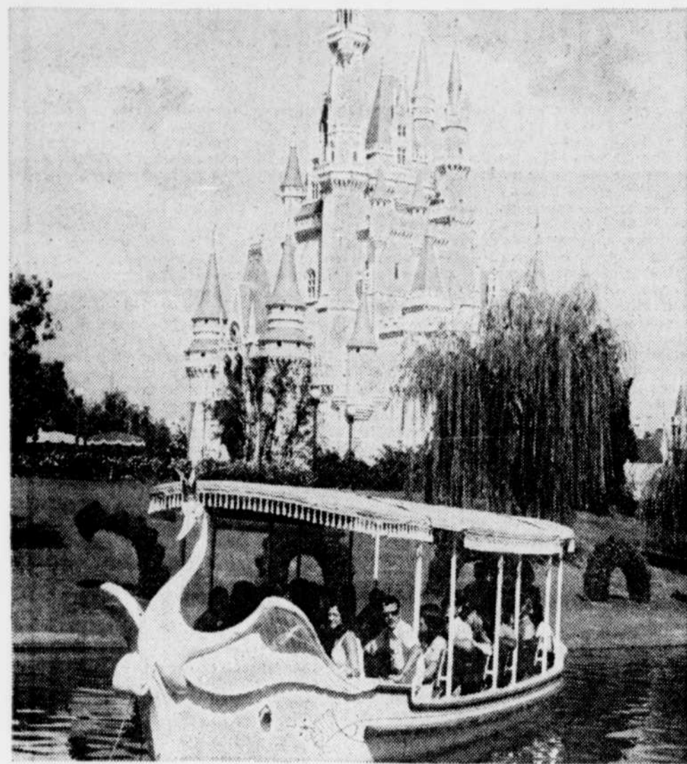
Disney World, la principale attraction touristique de Floride.