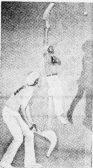
Pour le pari et le spectacle, la pelote basque crée beaucoup d'animation.