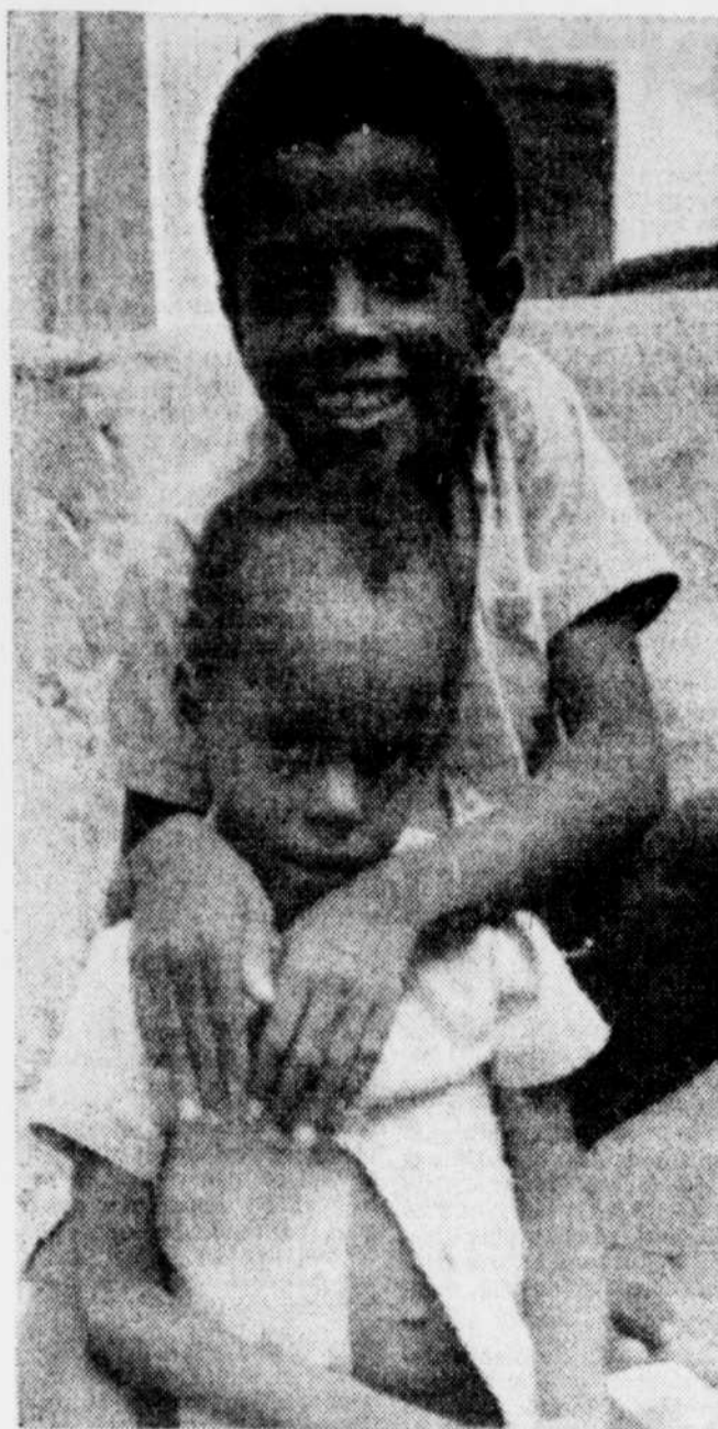
Un peuple souriant

par Paul METIVIER (collaboration spéciale)