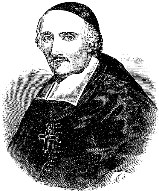
FRANÇOIS DE LAVAL DE MONTMORENCY, Premier Evêque de Québec.