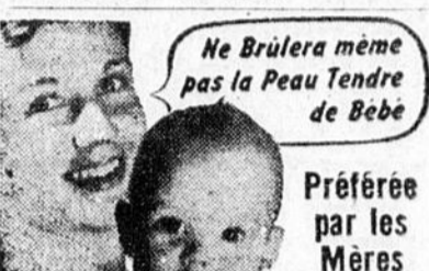
Ne brûlera même pas la Peau Tendre de Bébé

Le nouveau service réduira de deux heures la durée du trajet et assurera des heures de départ plus commodes. Le nouveau rapide partira de Montréal, tous les jours excepté le dimanche, à 9 heures et 45 p.m. et de Québec à 11 heures et 30 p.m., et arrivera à Montréal à 4 heures et 45 p.m. le lendemain. L'autre train quittera Montréal à 8 heures et 45 p.m. et Québec à 8 heures et 10 tous les jours, excepté le samedi, pour arriver à Hearst à 11 heures et 30 le lendemain soir. Ces trains assureront un service de jour aux voyageurs demeurant dans les territoires du nord.