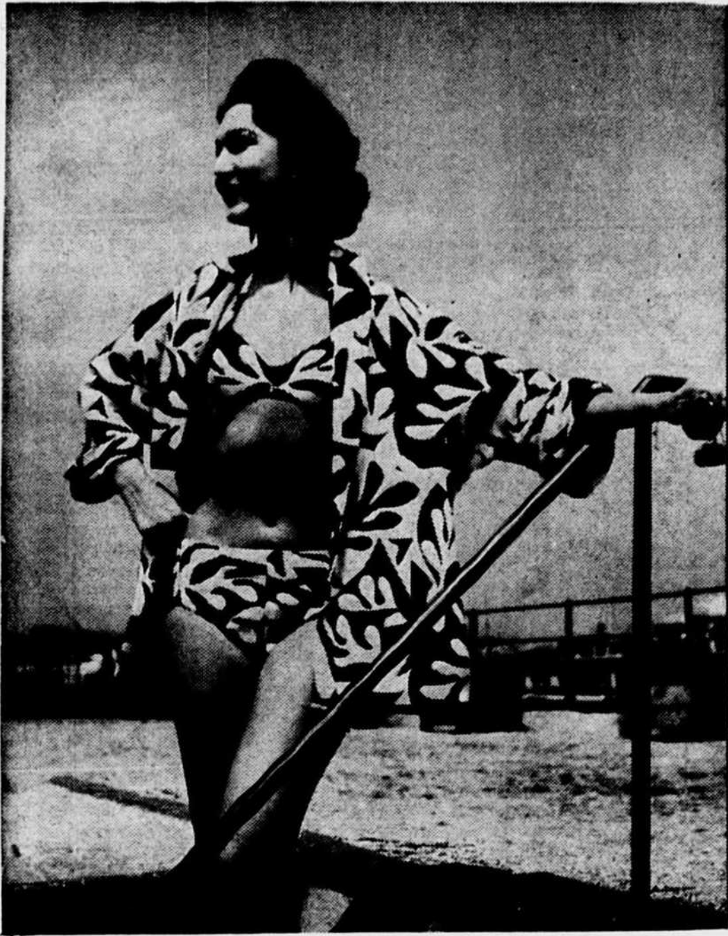
"LA MOUETTE" ensemble de plage maillot de bain deux pièces en piqué imprimé noir et blanc. Dessin exclusif Jacques HEIM. Veste assortie doublée de toile orange.