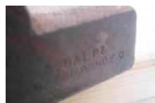
Outils de menuiserie Sem Dalpe