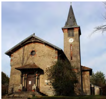
Temple protestant de Villefavard

Jean-Baptiste Lhôte partageait les idées de l'Église gallicane (appelée ensuite Église catholique française) fondée par M gr Chatel, lequel a été « frappé d'interdit » par Rome à cause de ses idées libérales et parce qu'il voulait que l'Église française échappe à la tutelle pontificale et accorde plus d'importance aux évêques locaux. Quand Lhôte est appelé à Villefavard en 1831, cette petite commune, à une cinquantaine de kilomètres de Limoges, n'a pas eu de curé depuis 1801 et c'est une