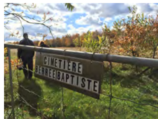
L'autocar s'arrête sur une route de campagne. Perdue au milieu des champs, une affiche indique l'endroit où reposent des membres de la petite communauté de Bérée, qui ont, à l'image de ces convertis des Actes des apôtres, accueilli le message avec joie.