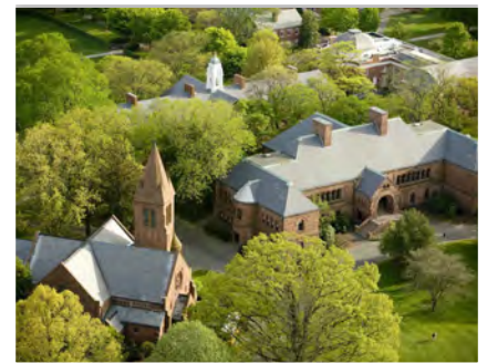
L'église ancienne et la Maidenhead Academy telles qu'on les trouve encore aujourd'hui.