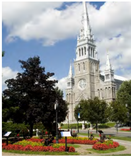
Cathédrale et jardins à Sainte-Thérèse

Ce mode de vie contreculturel était particulièrement présent à Sainte-Thérèse. Un esprit contestataire marquait la vie sociale de ce pôle démographique et éducationnel. Le centre-ville de Sainte-Thérèse, notamment près de la fontaine publique entourée de la cathédrale et du vieux séminaire, constituait l'épicentre de la contestation où convergeaient chaque jour des dizaines de jeunes hippies dans une curieuse atmosphère enfumée. Alors que l'influence de l'Église déclinait, en 1967, le séminaire fut converti en CÉGEP, et celui-ci devint un haut lieu de la dissidence et de la contre-culture. Illustration typique du mouvement de Mai 68, le campus collégial de Sainte-Thérèse fournit au Parti Québécois naissant une considérable