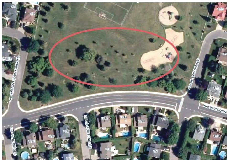
La nouvelle école pourrait être installée dans le parc de Normandie, situé sur la rue De Rouen.