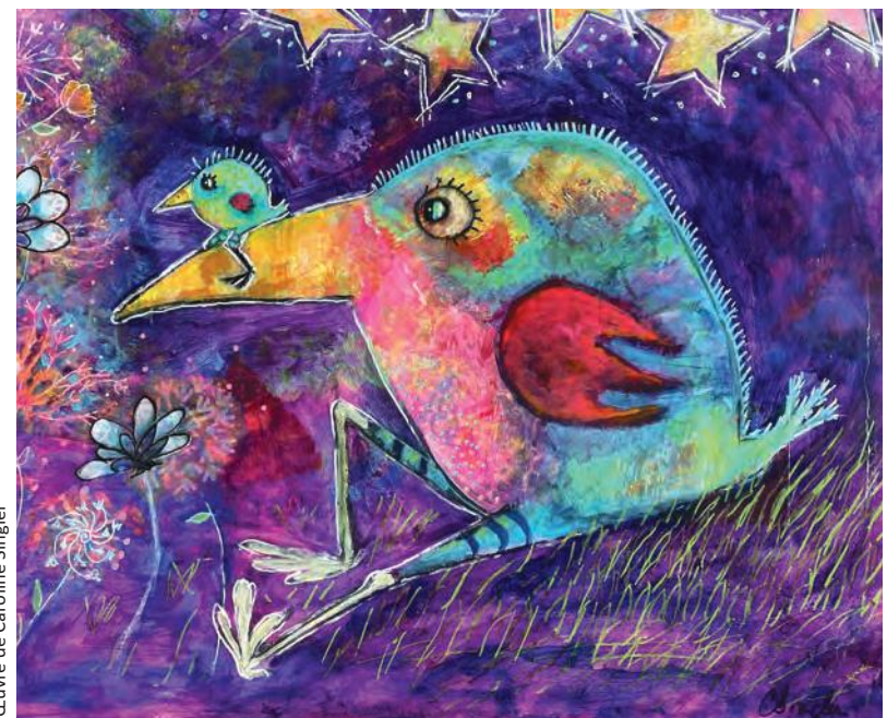
Œuvre de Caroline Singler

Le bénévolat, c'est tout le pouvoir de la bienveillance.