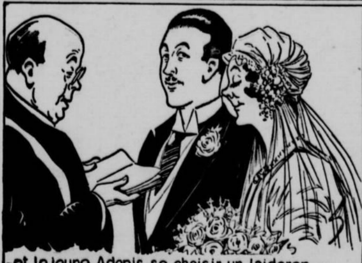
— et le jeune Adonis, se choisit un laideron —