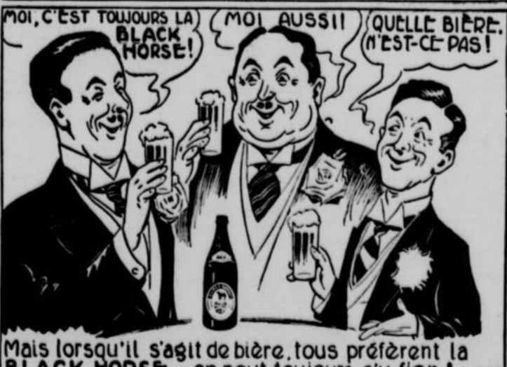
Mais lorsqu'il s'agit de bière, tous préfèrent la BLACK HORSE — on peut toujours s'y fier !