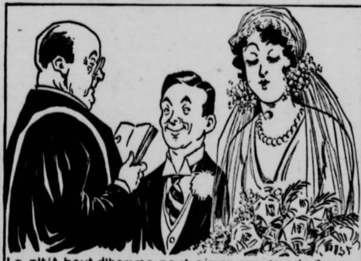
Le p'tit bout d'homme peut aimer une grande femme