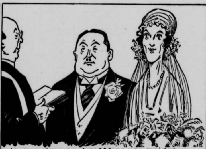
— le gros gras peut préférer une maigre —