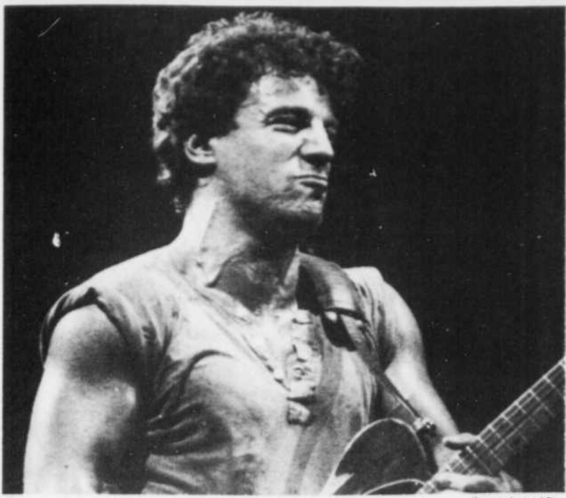
Bruce Springsteen