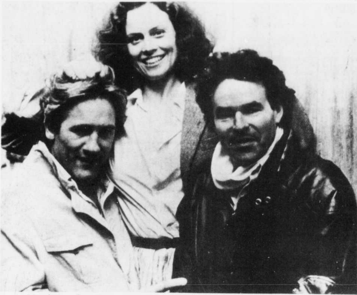
Gérard Depardieu, Sigourney Weaver et Daniel Vigne pendant le tournage du film.

contradictoire, mais c'est ça. Il faut presque être mesquin pour être le plus magique possible. Il y a un comique qu'on peut travailler comme un numéro de clown et il y