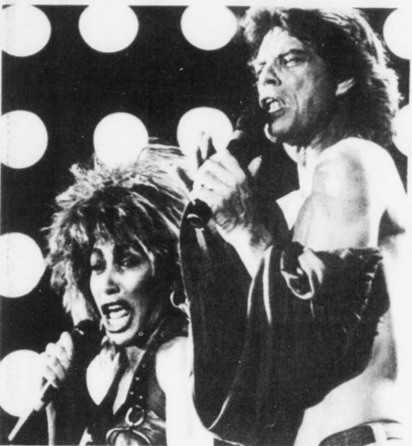
Tina Turner et Mick Jagger

La scène rock internationale a été marquée par deux événements majeurs: la tournée 'Born in the USA' de Bruce Springsteen et le méga-concert transatlantique Live Aid.