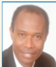
Jean Bernier District n° 23 Secteurs T et bord de l'eau au sud du pont Champlain