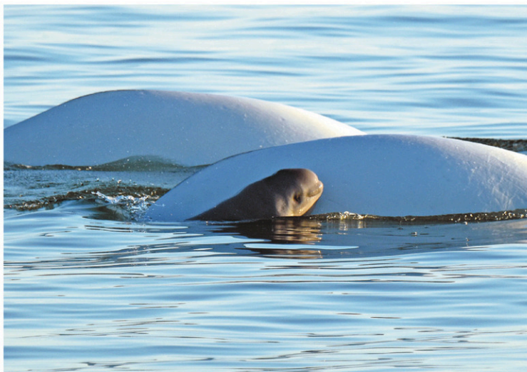
La jeune femelle a nagé une quarantaine de minutes avec le groupe.