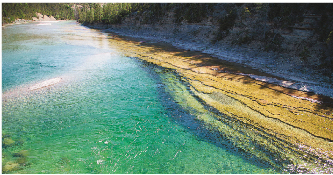
La rivière Jupiter abrite des saumons de l'Atlantique.

Le gouvernement Couillard a tout de même autorisé le prélèvement d'eau dans la plus importante rivière de l'île, la rivière Jupiter, qui abrite