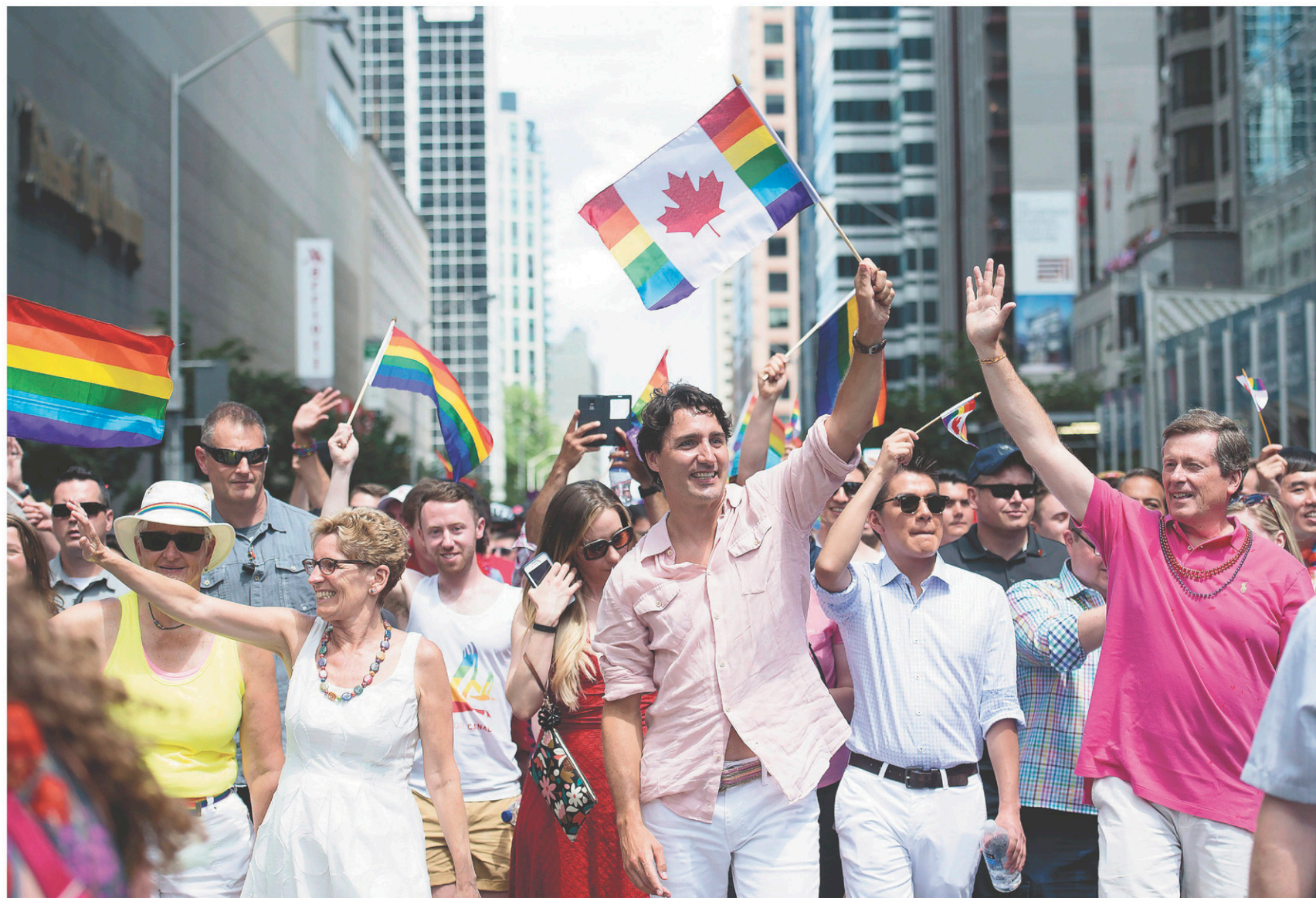
Justin Trudeau arborait un unifolié aux couleurs de l'arc-en-ciel. À ses côtés, la première ministre ontarienne, Kathleen Wynne et sa conjointe (en jaune), ainsi que le maire de Toronto, John Tory (en rose). Le défilé de Toronto est l'un des plus importants dans le monde.