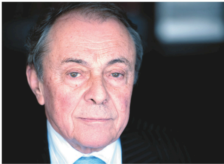
Michel Rocard a encouragé René Lévesque à poursuivre son œuvre après sa défaite au référendum de 1980.

Michel Rocard a été maire de Conflans-Sainte-Honorine de 1977 à 1994, année où il a quitté cette fonction pour entrer au Parlement européen comme député. Il y restera jusqu'en 2009. En 2009, le président Nicolas Sarkozy l'a nommé ambassadeur chargé de la négociation internationale pour les pôles arctique et antarctique. Il préside aussi une conférence d'experts sur l'institution d'une Contribution climat énergie.