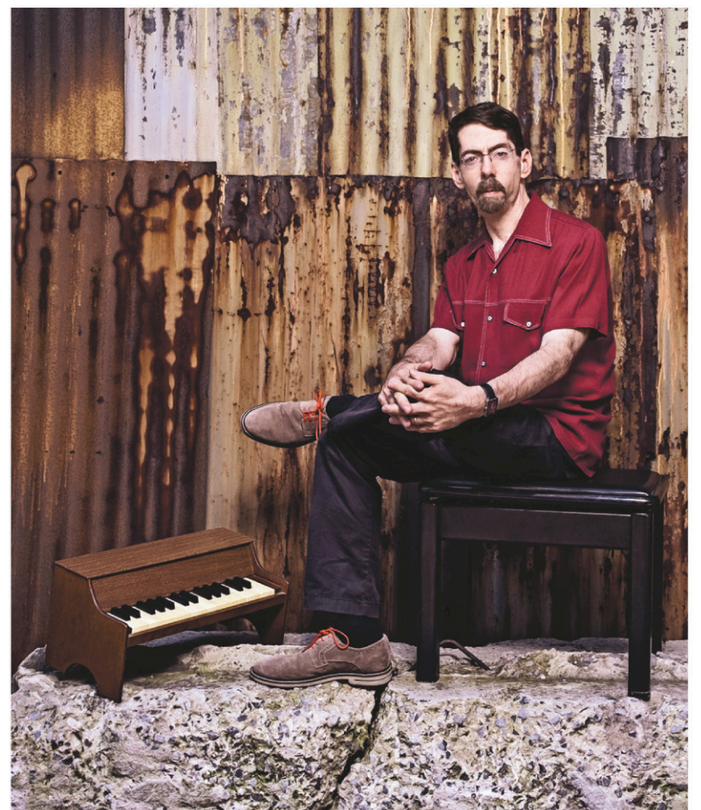
Le pianiste américain Fred Hersch

Lire aussi Notre couverture du Festival international de jazz de Montréal. Page B 8