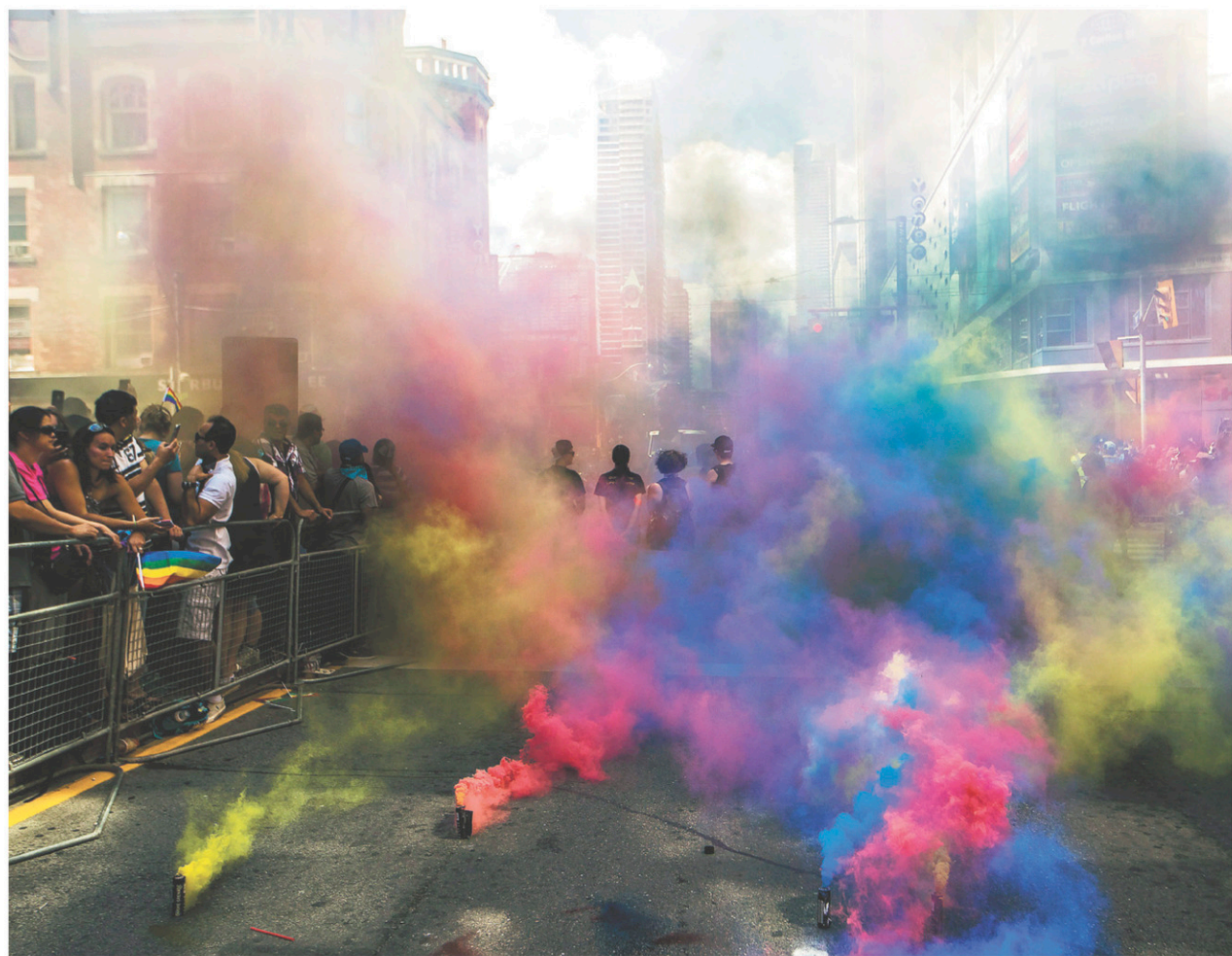
Le défilé a pris une tournure particulièrement militante cette année avec les protestations du mouvement Black Lives Matter, qui a tenu un sit-in contre la présence de la police et déclenché des bombes fumigènes colorées.