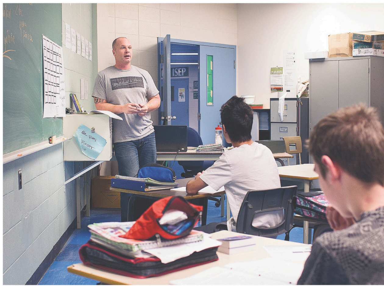
La passion des professeurs est réelle.

Je vais continuer mes visites, parce qu'il n'y a rien de mieux que