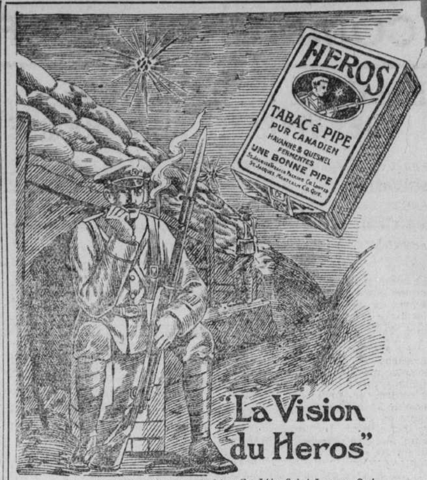
La St. Jacques Tobacco Pack Ltd. Co. Ltd., Saint-Jacques, Qué. Dép. de ventes pour Montréal: 47 Mont-Royal est. Tél. Saint-Louis 4329

"Le peuple n'est pas prêt pour une révolution, déclare-t-il, car il n'a ni canons, ni mitrailleuses. La meilleure des protestations, ce sont les élections générales. Allez voter et élisez le vieux chef libéral."