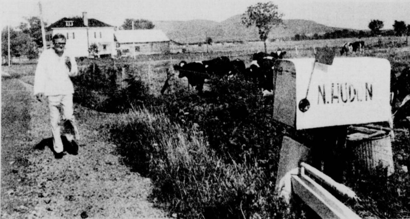
Il faudrait être vache pour écrire des choses que nous inspirent les ruminants ... de droite.