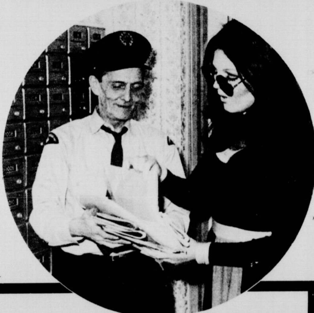
Des missives de toutes sortes, de tout acabit. Ceux qui l'aiment le plus: les hommes de plus de 40 ans et les adolescents!

ces autres gars qui se moquent de vous, et sais que je peux vous rendre heureuse, et combien vous aimeriez sortir avec moi..."