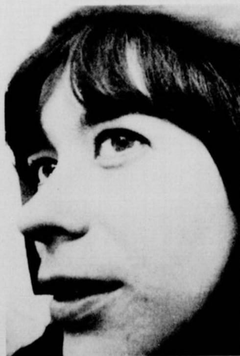
Louise Forestier ...la Nuit sur la place