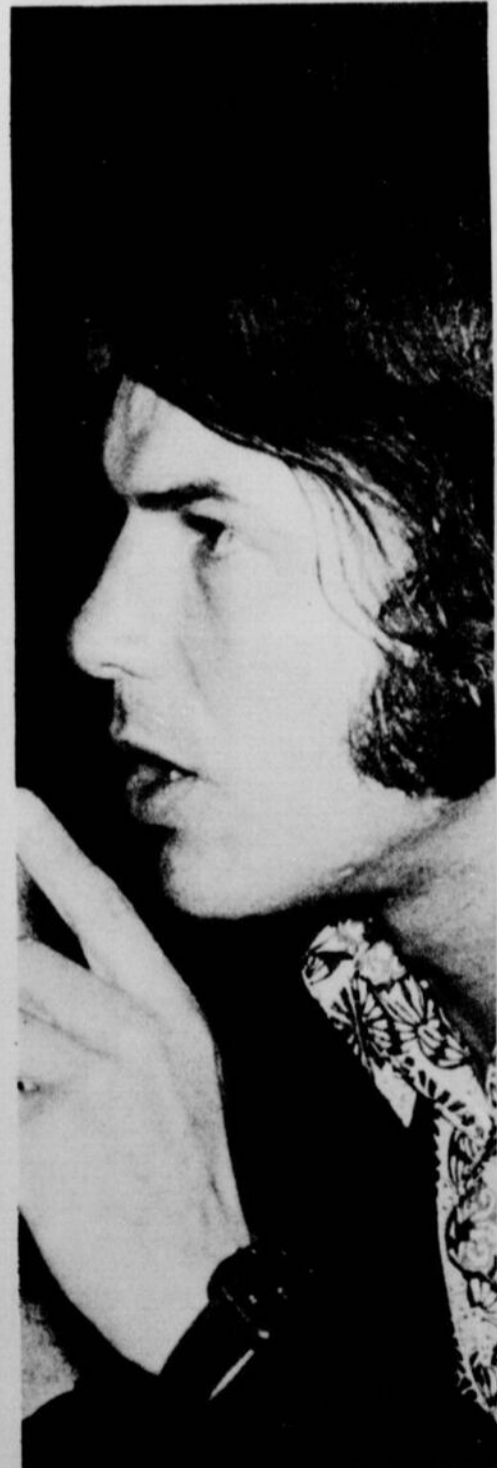
"J'ai des problèmes comme tout l'monde et le plus difficile est de concilier ma carrière et ma vie privée".