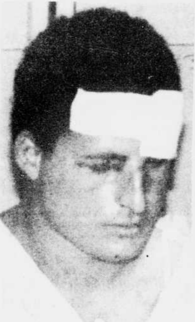
L'assaillant a été arrêté et interrogé.

Selon les premiers éléments de l'enquête, le jeune Palestinien serait un «extrémiste religieux». «Interro-