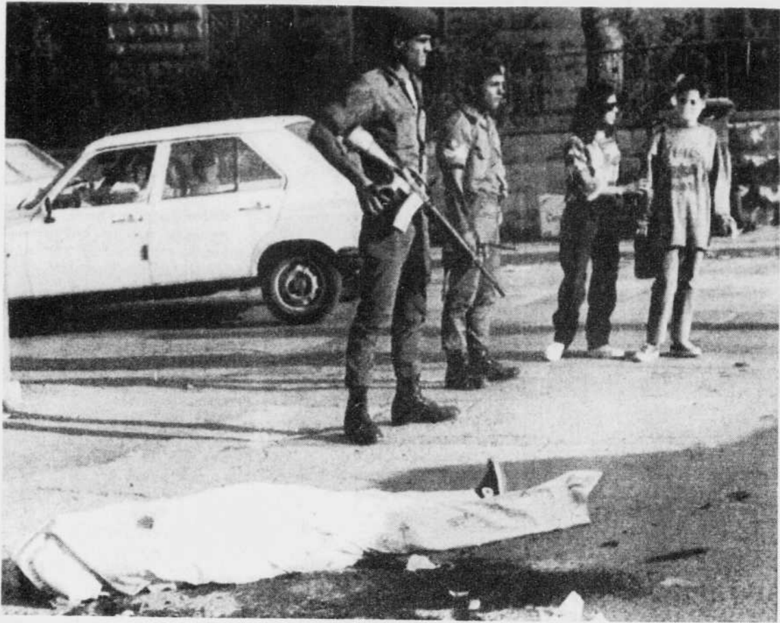
Des soldats israéliens montent la garde près de l'une des victimes de l'assaut.

L'attentat est lié à la récente condamnation d'Israël par le Conseil de Sécurité, a affirmé pour sa part le porte-parole de M. Yitzhak Shamir, le premier ministre israélien. «Cet attentat résulte de l'atmosphère créée par la condamnation d'Israël au Conseil de Sécurité de l'ONU», a déclaré à la radio M. Avi Pazner.