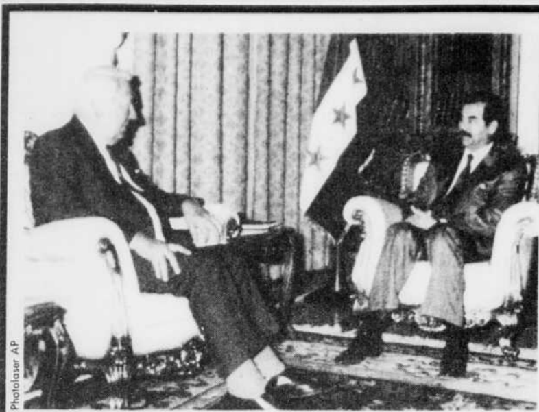
L'ancien premier ministre britannique Edward Heath a rencontré le président irakien Saddam Hussein pour tenter de faire libérer des otages. L'Irak détient 5000 otages occidentaux.