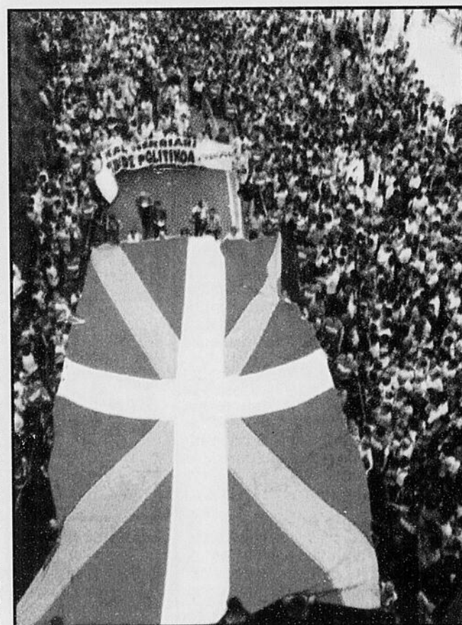
Les pro-ETA sont descendus dans la rue à leur tour. Ils étaient 30 000 à Saint-Sébastien à défilé derrière un drapeau basque.

D'après le ministre belge de l'Intérieur Johan Vande Lanotte, qui attend ce matin le rapport préliminaire de la commission d'enquête, «tout ce que