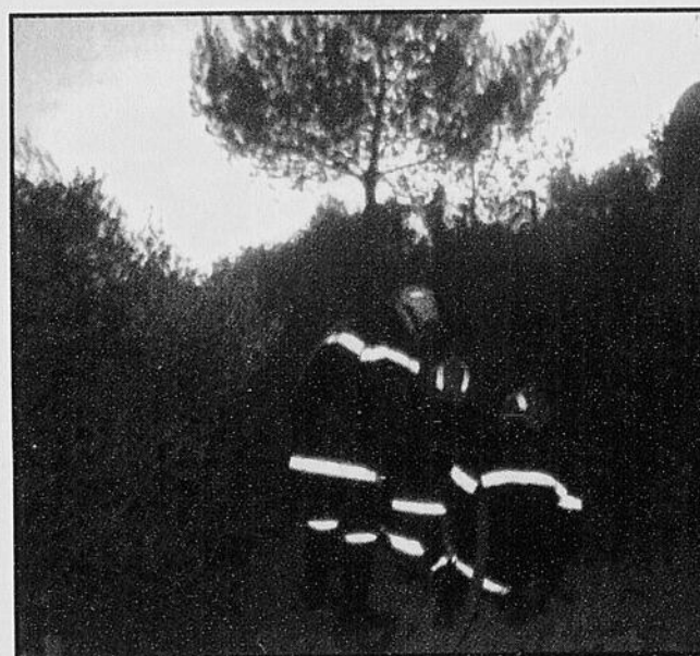
Pour leur deux jours et deux nuits de lutte contre les flammes, les pompiers français ont été ovationnés et aidés par la population de la région de Marseille, qui leur sait gré d'avoir préservé vies humaines et biens matériels.

Un bilan complet des dégâts matériels doit être établi dès aujourd'hui par un survol en hélicoptère. Mais il apparaît déjà que seules quelques maisons isolées ont subi des dommages. L'incendie pourrait avoir aussi des répercussions sur l'alimentation électrique de la région marseillaise. Pour faciliter le travail des pompiers au sol et celui des pilotes de Canadair, EDF a en effet mis hors tension trois des six lignes aériennes de 420 000 volts alimentant les secteurs de Marseille et de Toulon.