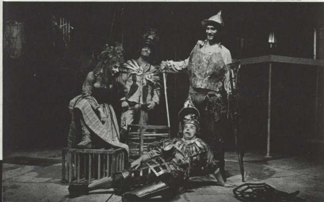
Photos de répétition