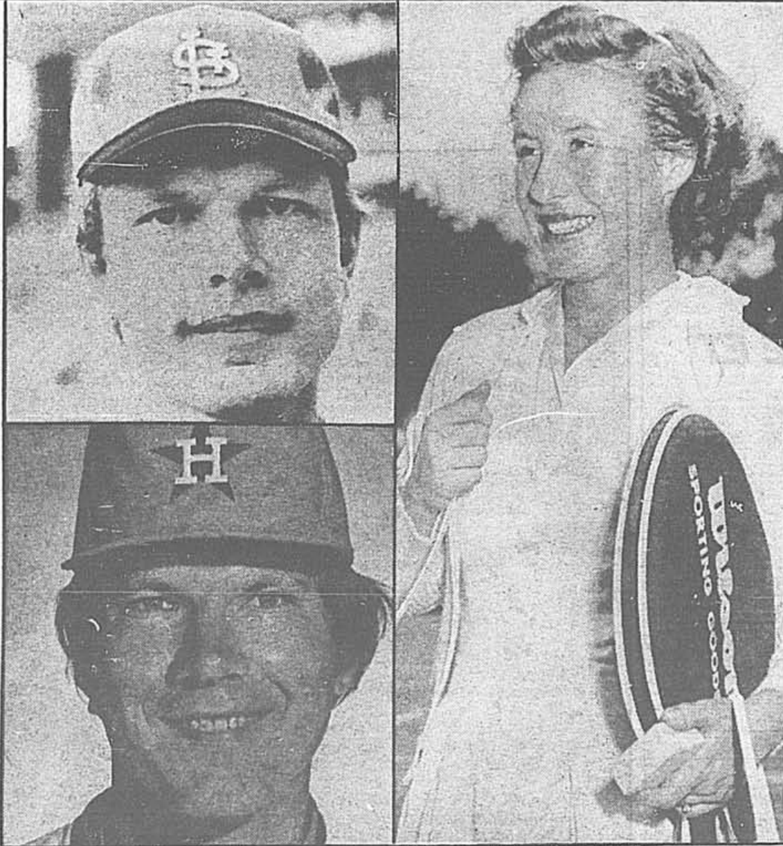
Bob Forsch Ken Forsch