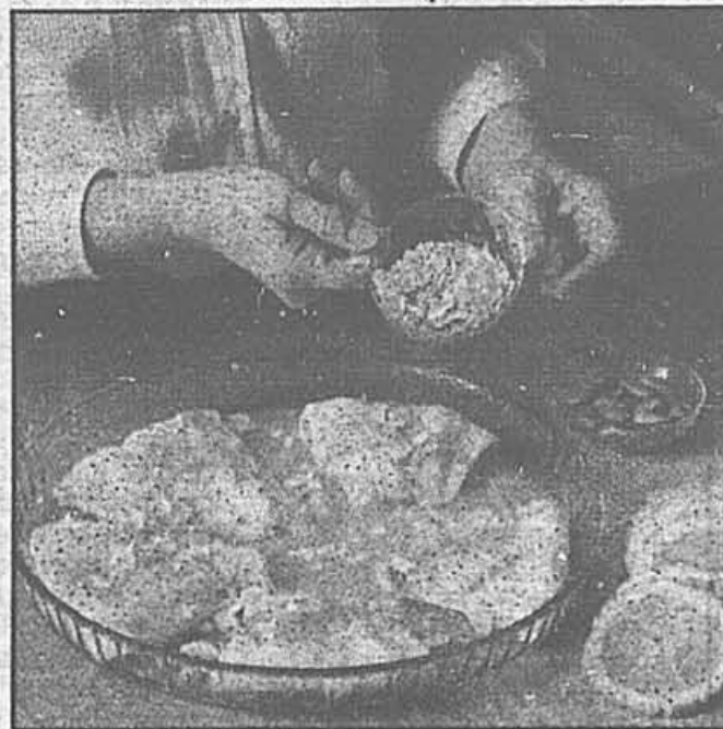
Saupoudrer d'amandes grillées.