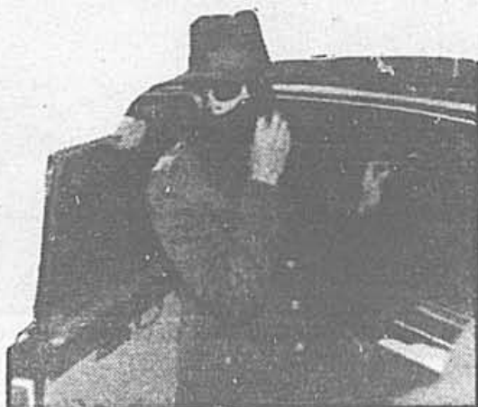
Michael Jackson: toujours l'Halloween...