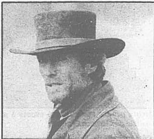
Clint Eastwood: le coup de l'étrier...