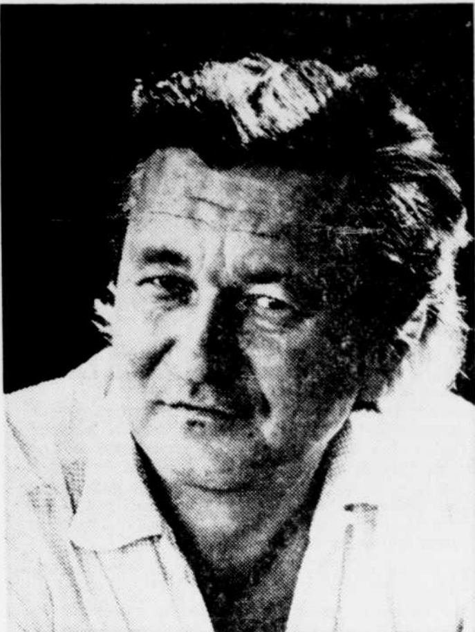
L'auteur William Styron.

Le fait de dévoiler aussi un peu la clé de l'histoire n'enlève rien, à mon sens, au roman de Styron. Car il ne faudrait pas croire que LE CHOIX DE SOPHIE est, sur le plan narratif, comme une énorme pyramide édifée pour soutenir un grain de sel final. Ce livre équilibre, tout au long de sa trajectoire, les réflexions sur des sujets essentiels: la sexualité, le sentiment, le romantisme noir, la folie, le racisme, la conjoncture historique du nazisme, la vie américaine de l'après-guerre... et la littérature. Car il décrit également, au milieu de nombreuses références littéraires et musicales, comment Stingo-Styron n'a pu devenir