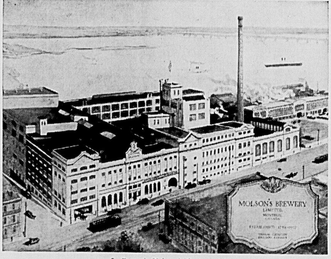
La Brasserie Molson à l'heure actuelle

Cent cinquante ans d'exploitation au même endroit Lorsque John Molson, à l'âge de 22 ans, établit sa brasserie dans le "faubourg de Québec", un peu en dehors des fortifications de Montréal, il construisait pour la postérité. Le caractère de l'homme se manifesta bientôt dans ses méthodes d'affaires, et son entreprise ne tarda pas à prendre solidement racine et à prospérer. A mesure que Montréal se développait, la production de la brasserie était l'objet d'une demande de plus en plus grande et il fallut souvent agrandir pour répondre à des besoins sans cesse croissants. Les terrains avoisinant le site original furent achetés et de nouvelles bâtisses furent éri-