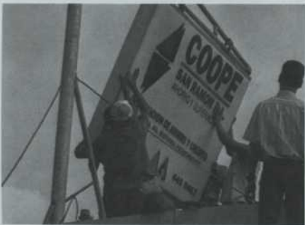
Une cinquantaine de coopératives financières ont vu le jour au Costa Rica depuis 1990.

Une fois l'implantation terminée, les coopératives d'épargne et de crédit offriront à leurs membres des services améliorés et à moindre coût. Ainsi, elles pourront affronter la concurrence particulièrement menaçante d'une nouvelle venue sur la scène des institutions financières au Costa Rica, la Banco Crescent, du Mexique.