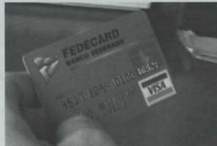
Bientôt la plupart des caisses du Costa Rica pourront offrir la carte Visa à leurs membres.

convaincus que la viabilité du réseau est fonction du sentiment d'appartenance des membres à leur coopérative. Et l'on compte bien rappeler aux Costaricains que ce réseau leur appartient à eux, et non à des étrangers.