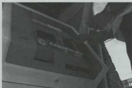
Des guichets automatiques sont déjà implantés dans quelques coopératives financières costaricaines.

C'est une période plutôt exigeante pour le réseau de coopératives de ce pays, mais la plupart des employés de la FEDECRÉDITO sont jeunes, dynamiques et très motivés. Aiguillonnés par la concurrence mexicaine, ils préparent leur plan de campagne. Ils vont tout mettre en œuvre pour fidéliser les membres grâce à des services de qualité, adaptés à leurs besoins, et ils sont