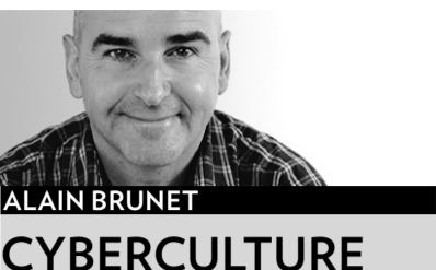
ALAIN BRUNET CYBERCULTURE

Voilà une notion qui demande à être clarifiée en cette période marquée par le déclin accéléré des supports physiques des contenus de création: la notion de copie privée, dont l'avenir est incertain dans l'univers numérique.