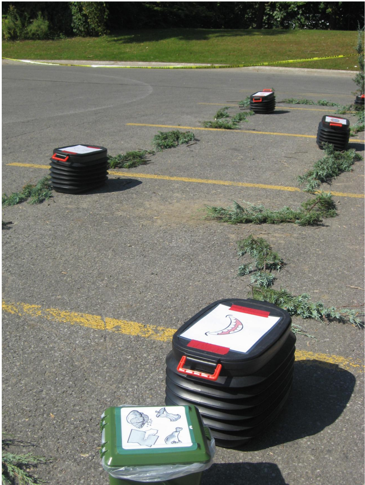
PARK(ing) Day Laval 2013 des Clubs 4-H du Québec