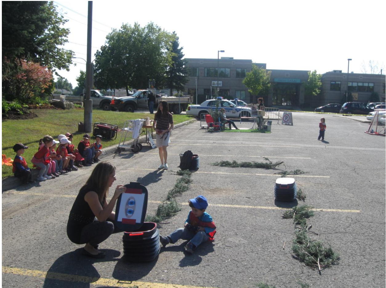
PARK(ing) Day Laval 2013 des Clubs 4-H du Québec