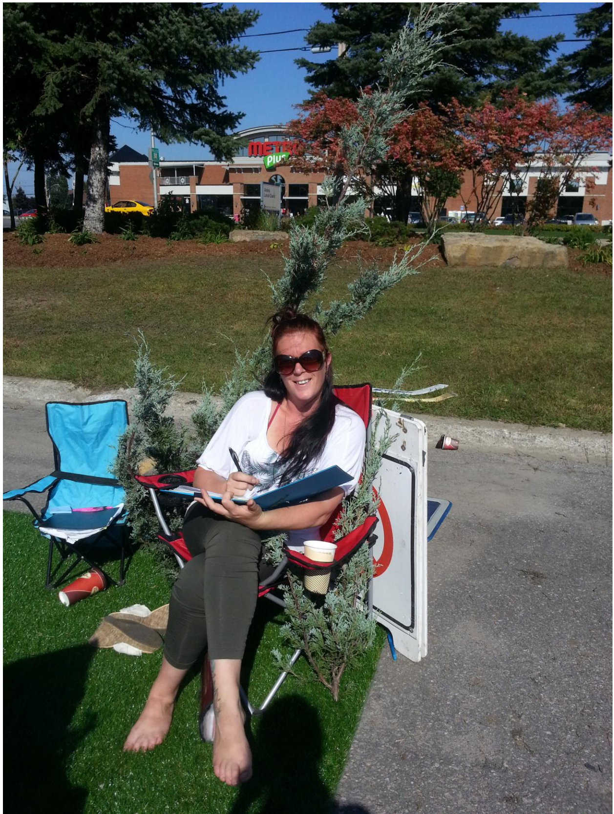
PARK(ing) Day Laval 2013 des Clubs 4-H du Québec