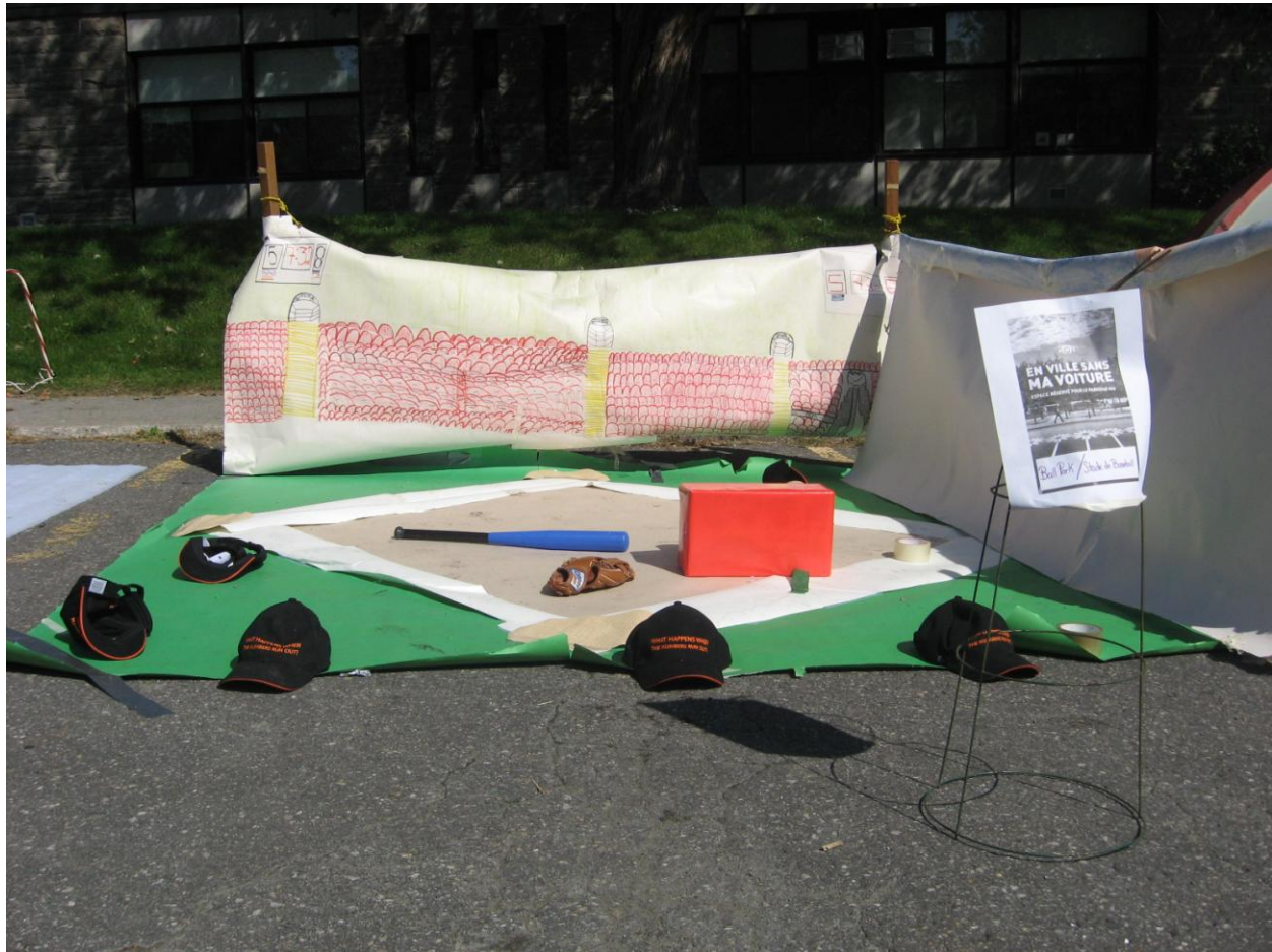
PARK(ing) Day Laval 2013 de Souvenir School