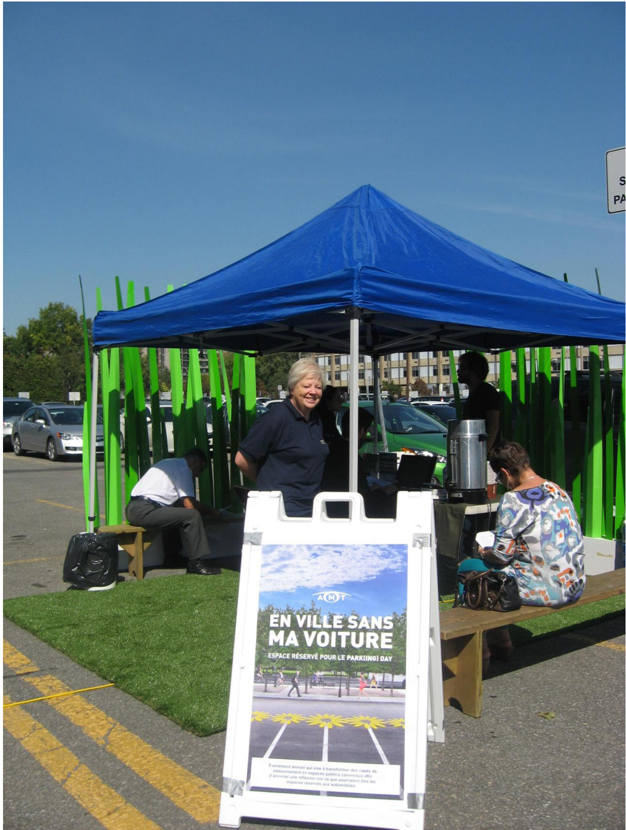
PARK(ing) Day Laval 2013 de la Ville de Laval