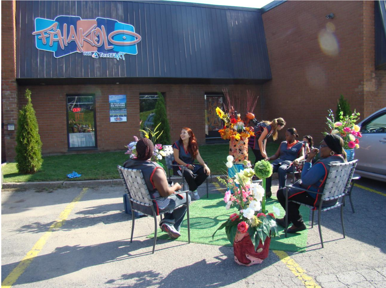
PARK(ing) Day Laval 2013 de Textil'Art

Stationnements réaménagés en espace bistro convivial à l'aide de matières recyclées.