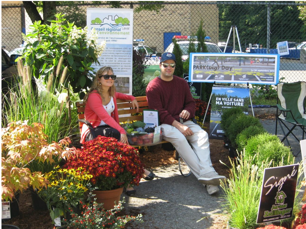
PARK(ing) Day Laval 2013 du Conseil Régional de l'environnement de Laval

Stationnement transformé en aire de repos naturelle où il fait bon relaxer et déguster un fruit bio! La transformation est une gracieuseté des Jardins Zeillinger et du Jardin des Anges .