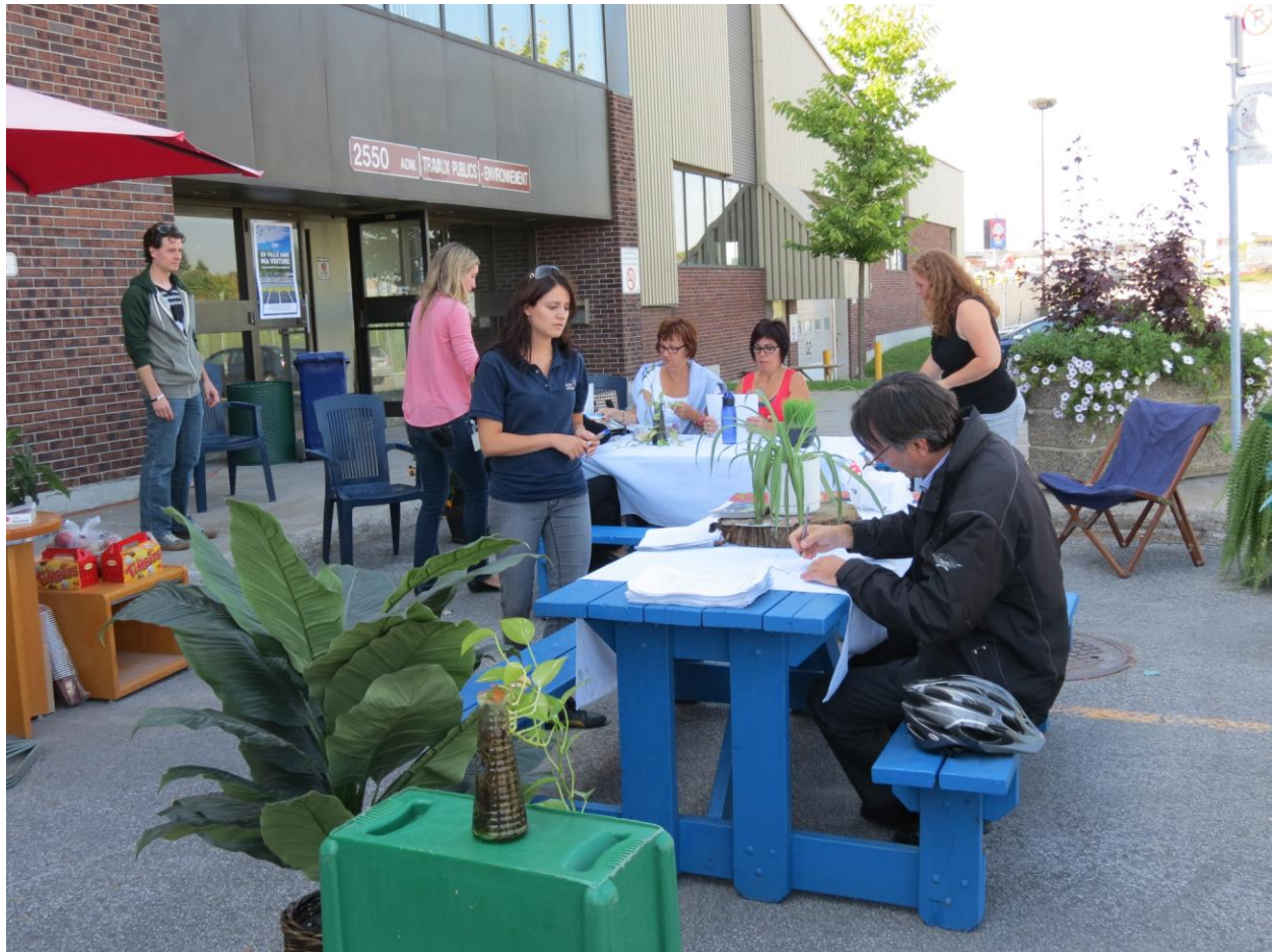
PARK(ing) Day Laval 2013 de la Ville de Laval