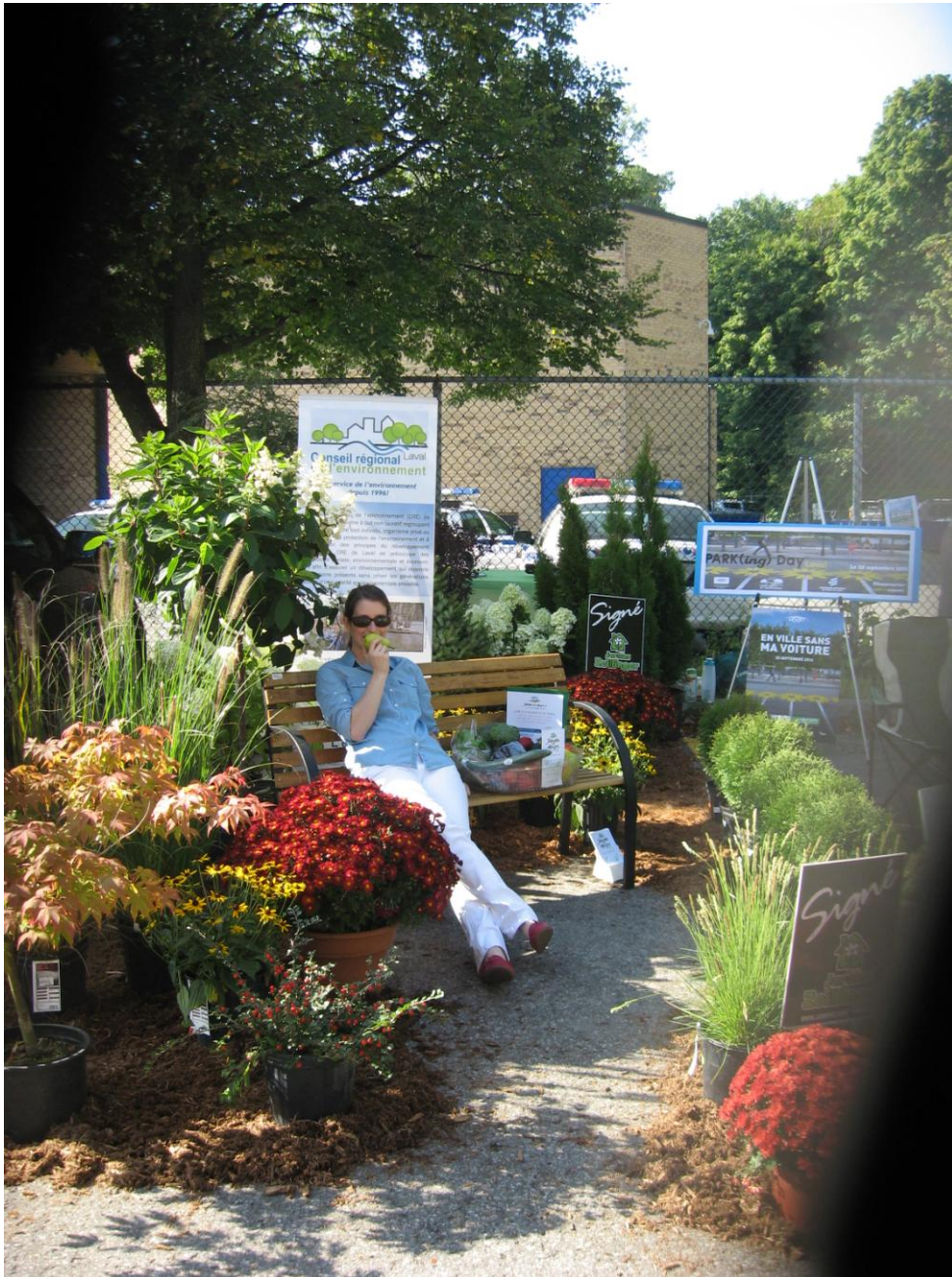
PARK(ing) Day Laval 2013 du Conseil Régional de l'environnement de Laval