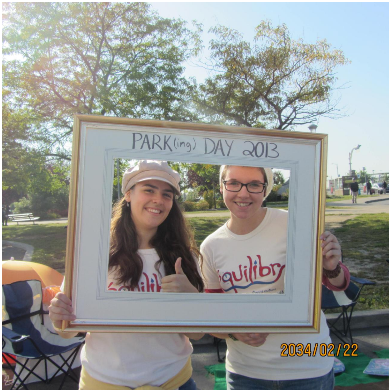
PARK(ing) Day Laval 2013 du Comité Équilibre du Collège Montmorency