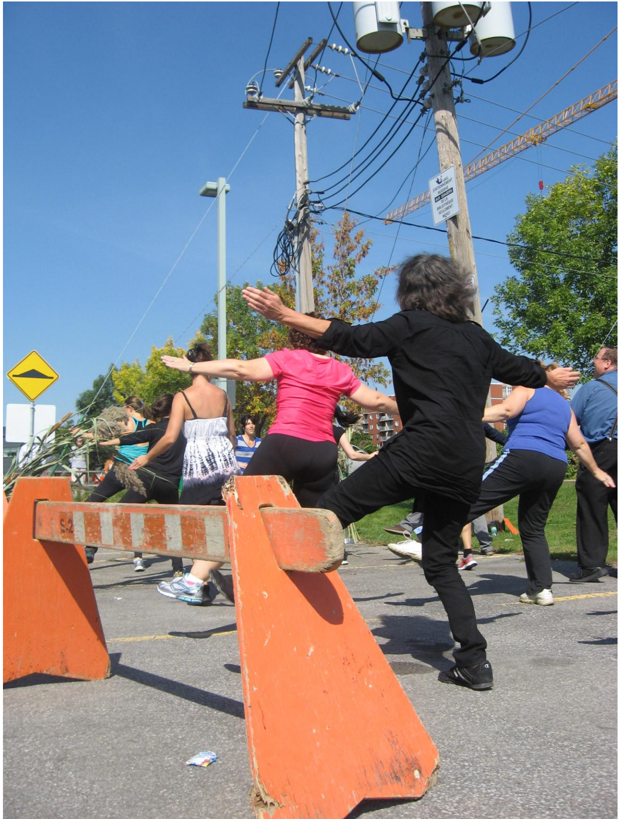
PARK(ing) Day Laval 2013 de la Bibliothèque Multiculturelle et de la Conférence régionale des élus de Laval.