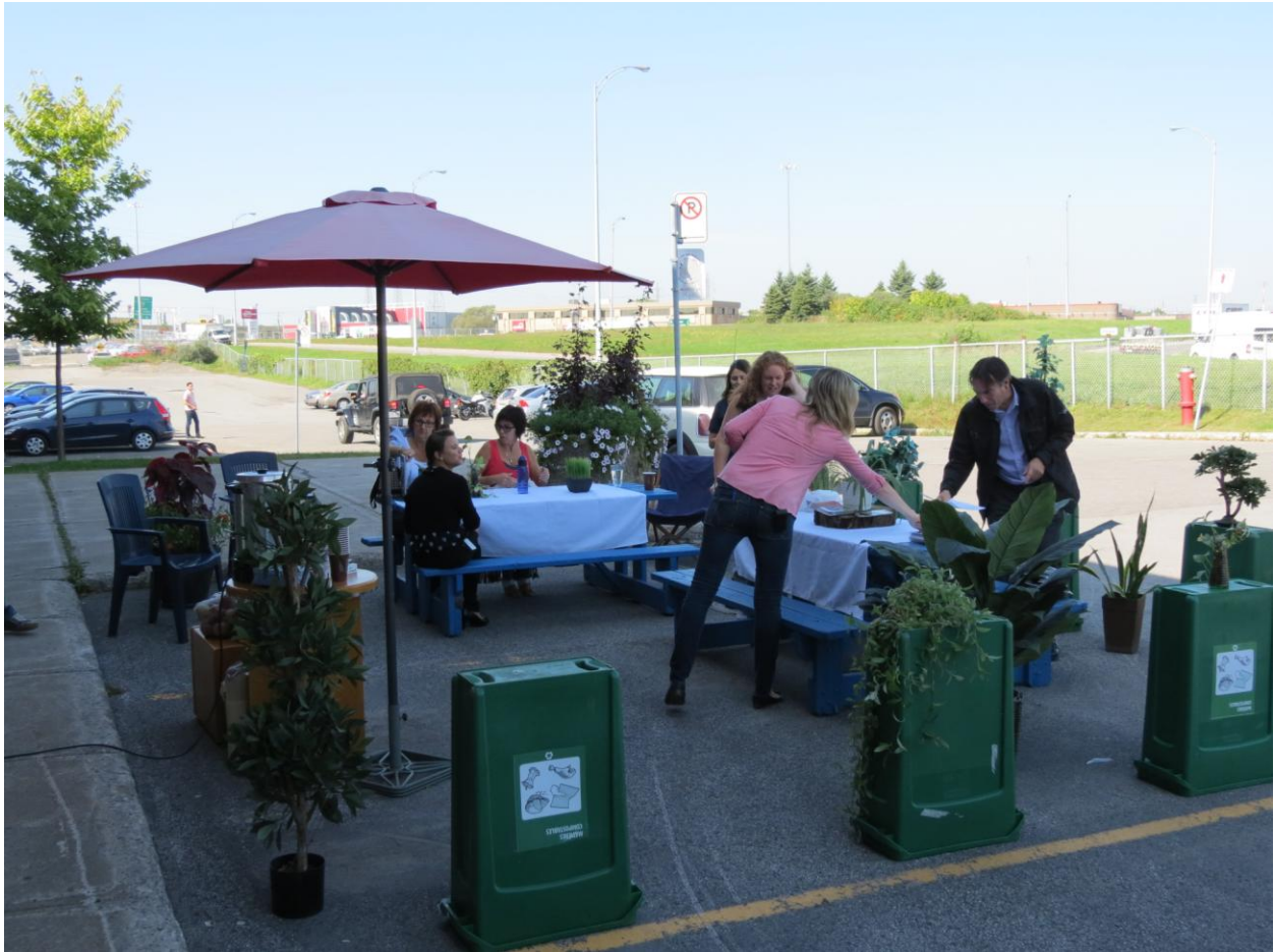
PARK(ing) Day Laval 2013 de la Ville de Laval