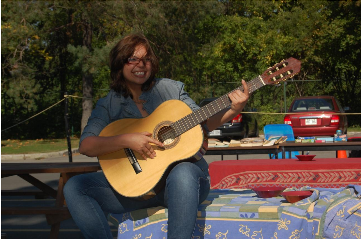
PARK(ing) Day Laval 2013 de l'Institut national de recherche scientifique (INRS) – Institut Armand Frappier