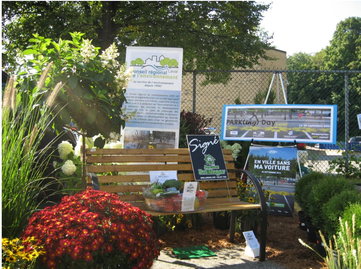
PARK(ing) Day Laval 2013 du Conseil Régional de l'environnement de Laval