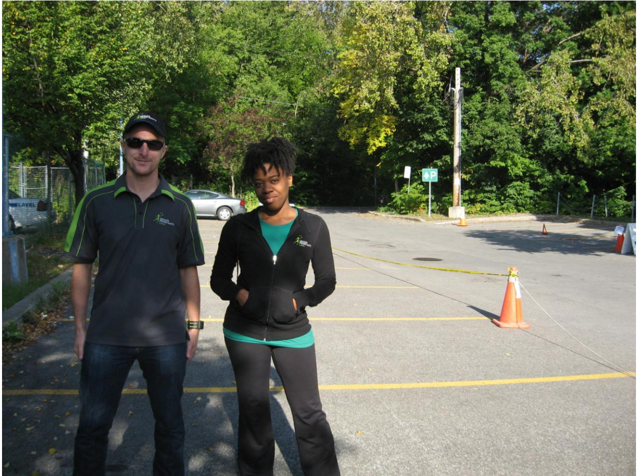
PARK(ing) Day Laval 2013 du Groupe promo santé Laval