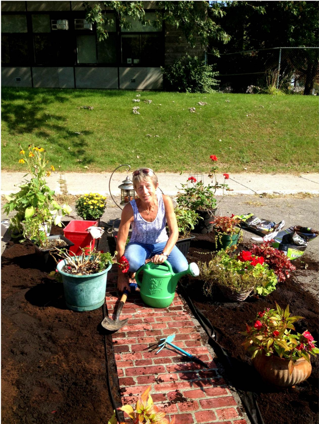
PARK(ing) Day Laval 2013 de Souvenir School