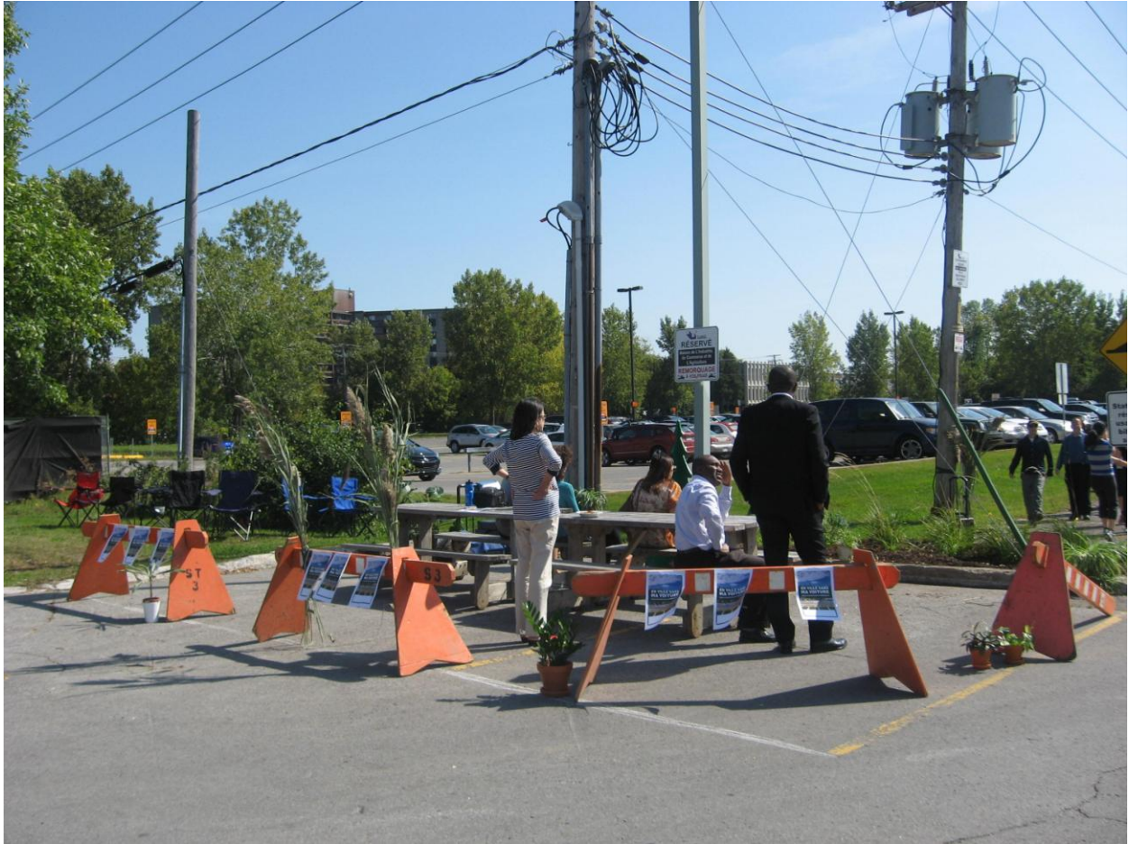
PARK(ing) Day Laval 2013 de la Bibliothèque Multiculturelle et de la Conférence régionale des élus de Laval.