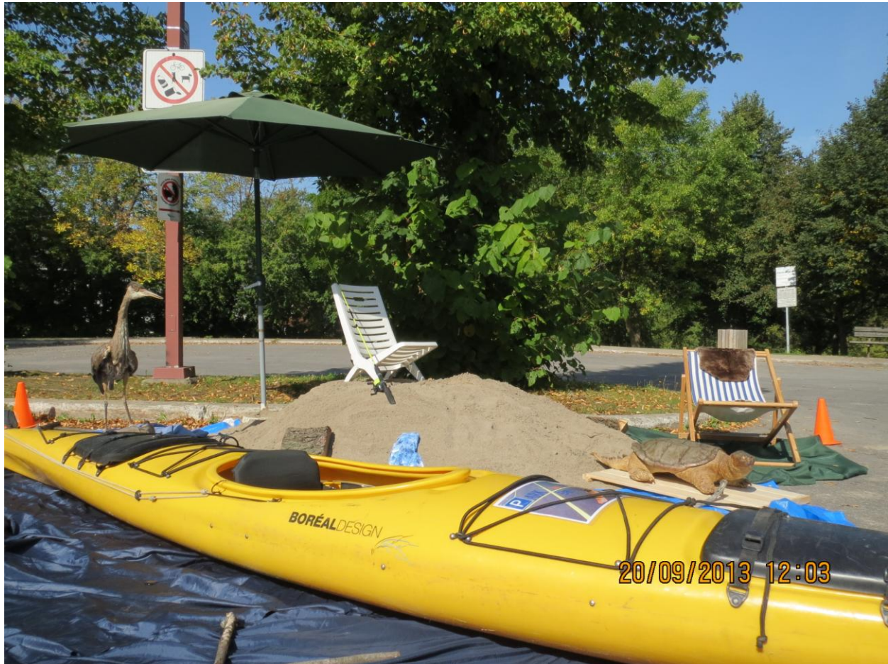
PARK(ing) Day Laval 2013 d'Éco-Nature/Parc de la Rivière-des-Mille-Iles