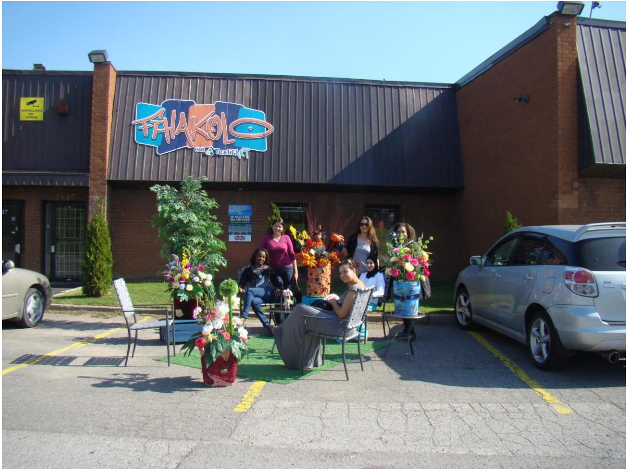
PARK(ing) Day Laval 2013 de Textil' Art