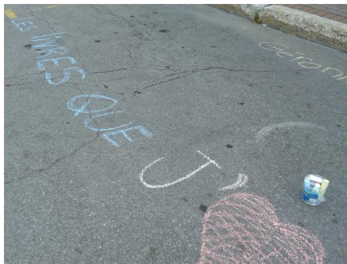
PARK(ing) Day Laval 2013 de la Bibliothèque Yves-Thériault