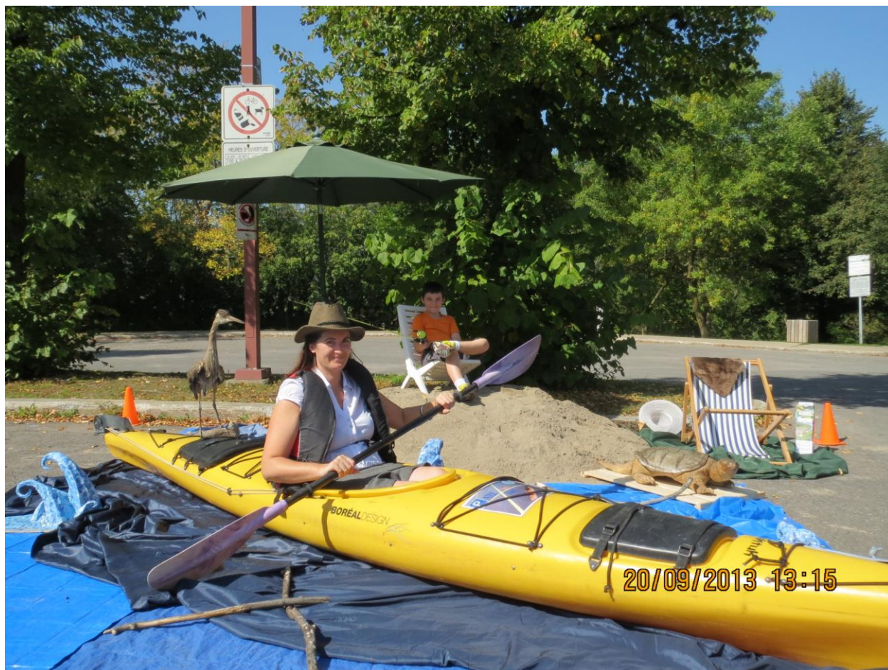
PARK(ing) Day Laval 2013 d'Éco-Nature/Parc de la Rivière-des-Mille-Îles

Stationnements transformés en petite plage où kayak de mer et espèces fauniques de la Rivière-des-Mille-Îles étaient au rendez-vous.