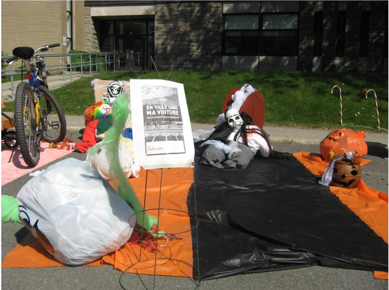
PARK(ing) Day Laval 2013 de Souvenir School