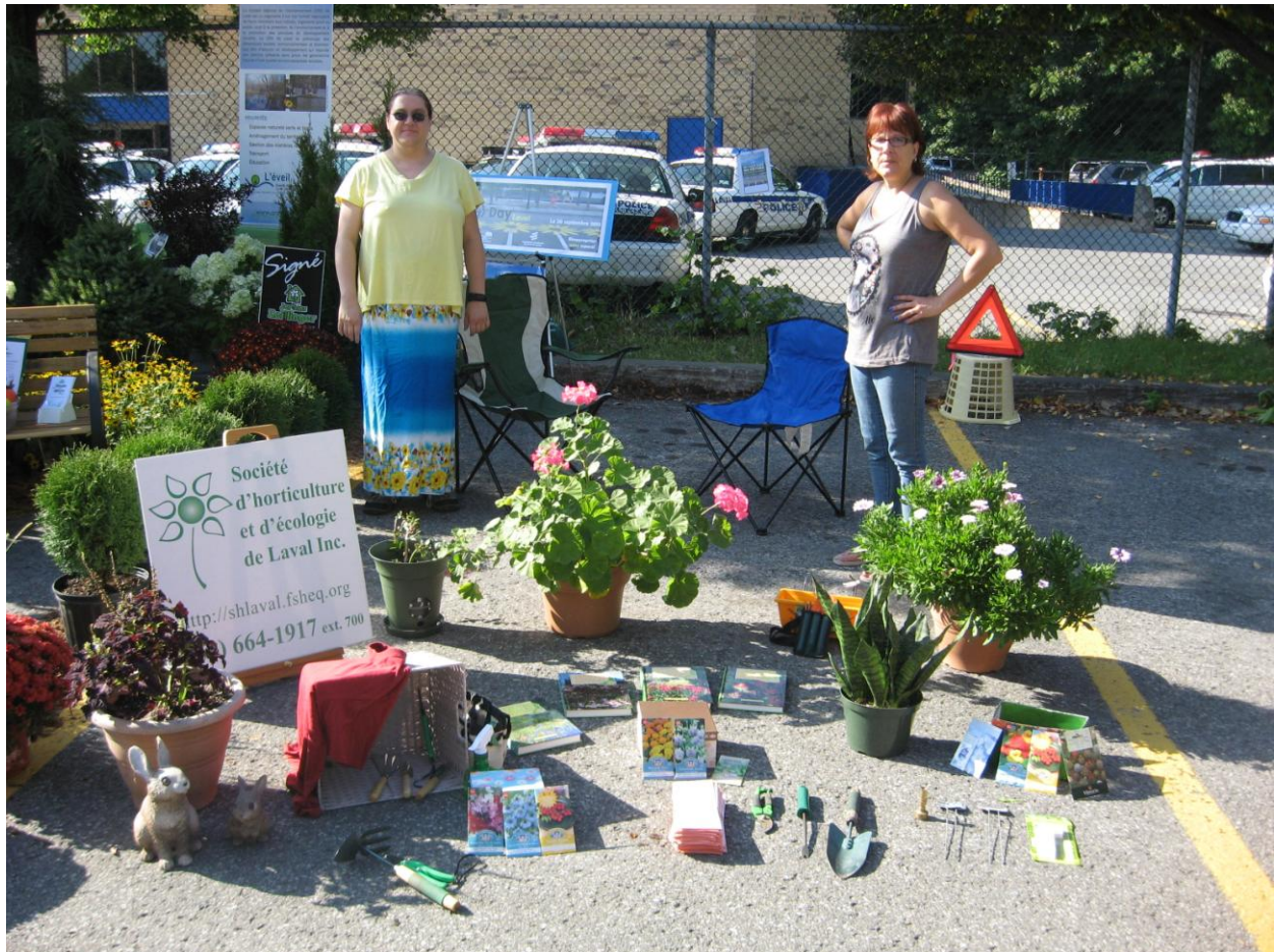
PARK(ing) Day Laval 2013 de la Société d'horticulture et d'écologie de Laval

Stationnement transformé en espace horticole où plantes en pots, outils de jardinage et spécialistes de l'horticulture permettaient d'en apprendre davantage sur l'art de cultiver des jardins en ville.