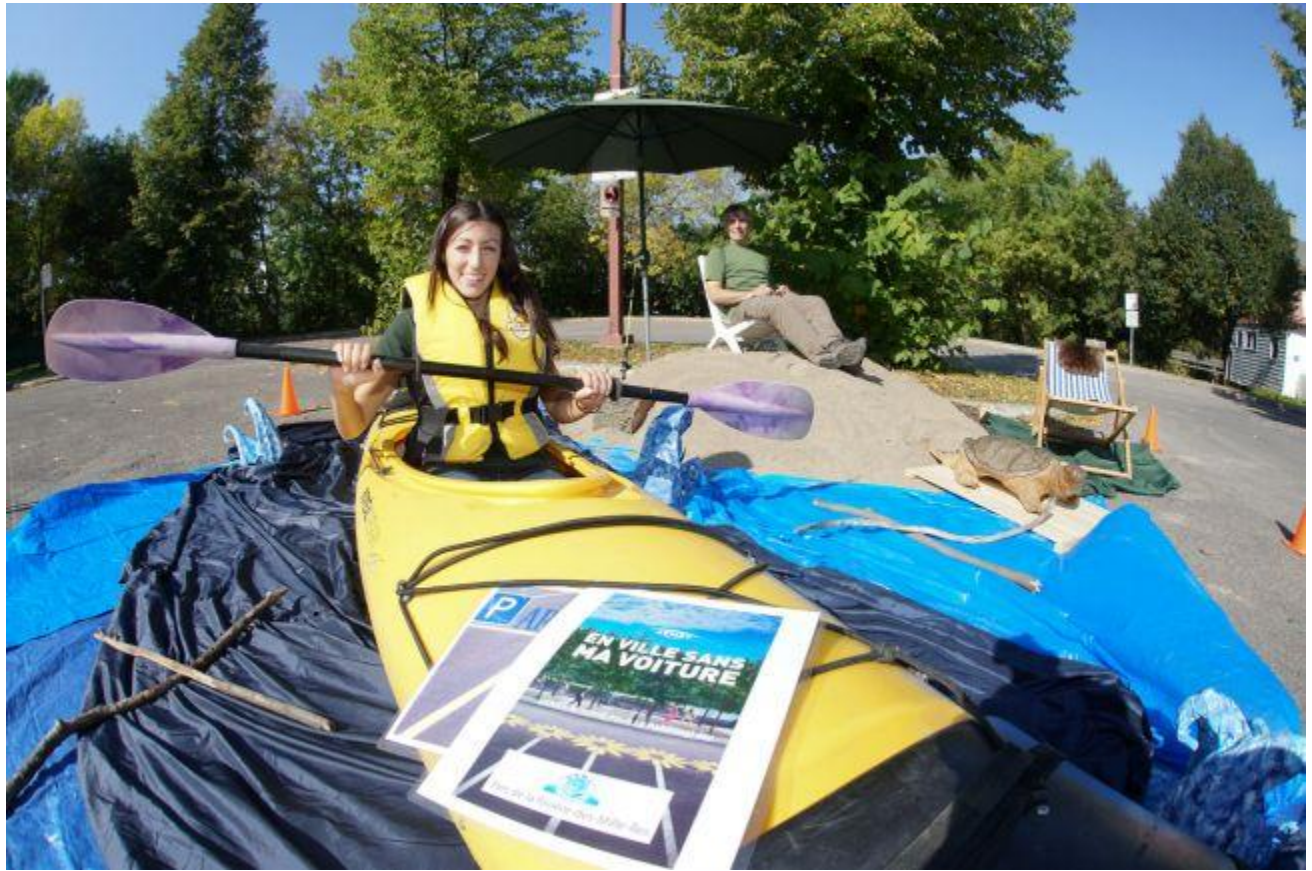
PARK(ing) Day Laval 2013 d'Éco-Nature/Parc de la Rivière-des-Mille-Îles