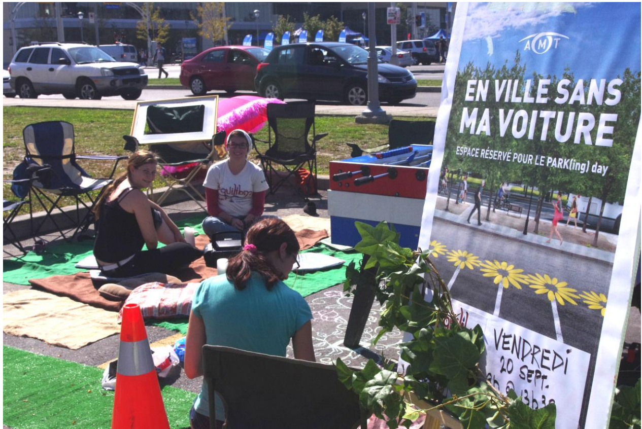
PARK(ing) Day Laval 2013 du Comité Équilibre du Collège Montmorency