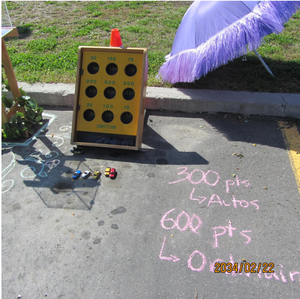
PARK(ing) Day Laval 2013 du Comité Équilibre du Collège Montmorency