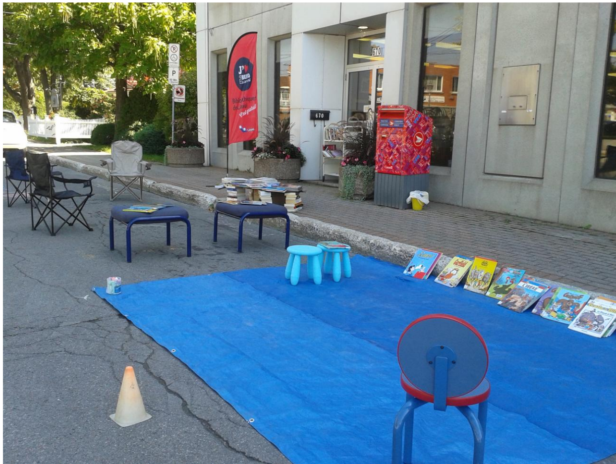
PARK(ing) Day Laval 2013 de la Bibliothèque Yves-Thériault

J'aime les livres! Stationnement transformé en bibliothèque ambulante avec coin lecture.