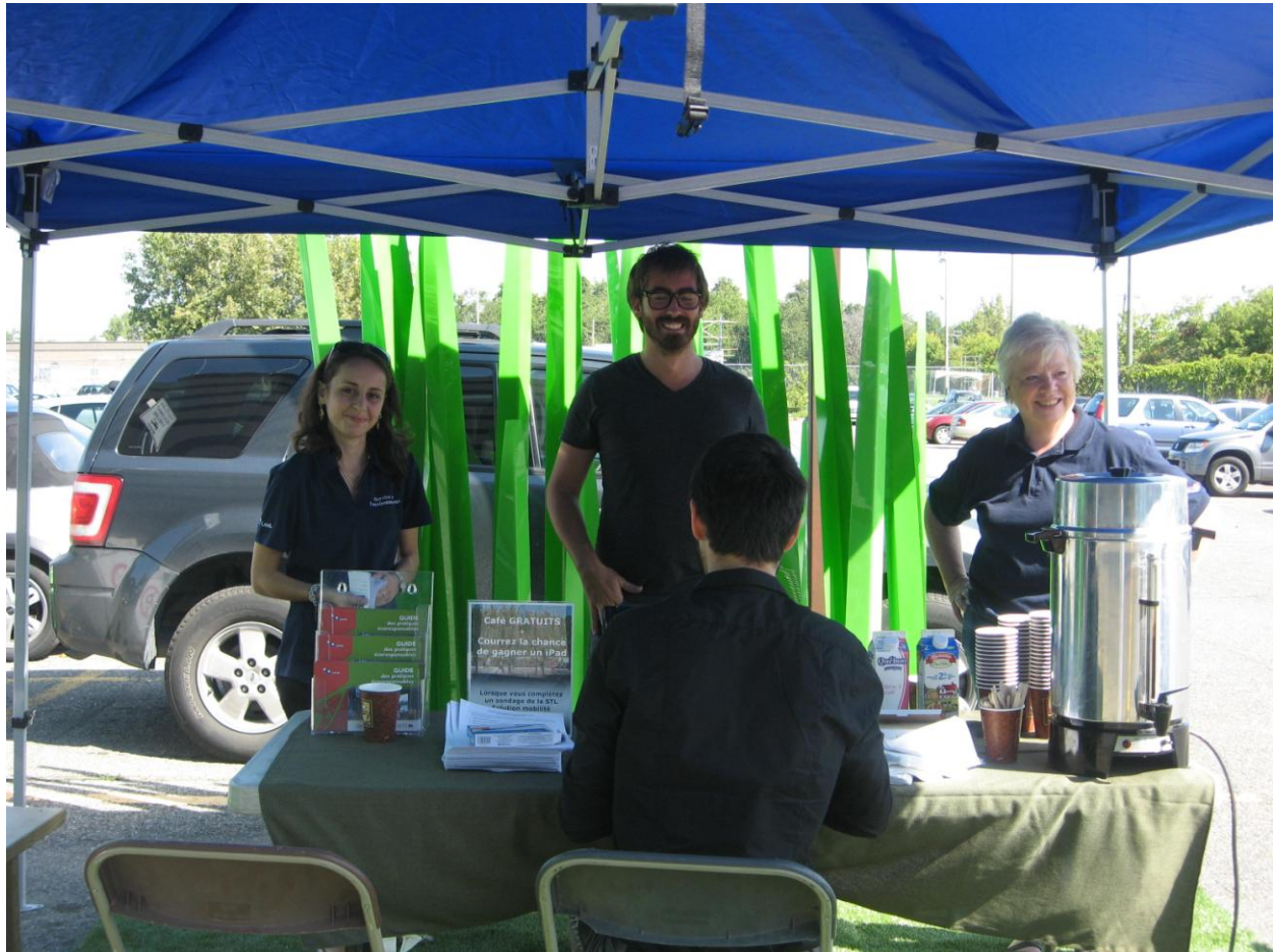
PARK(ing) Day Laval 2013 de la Ville de Laval