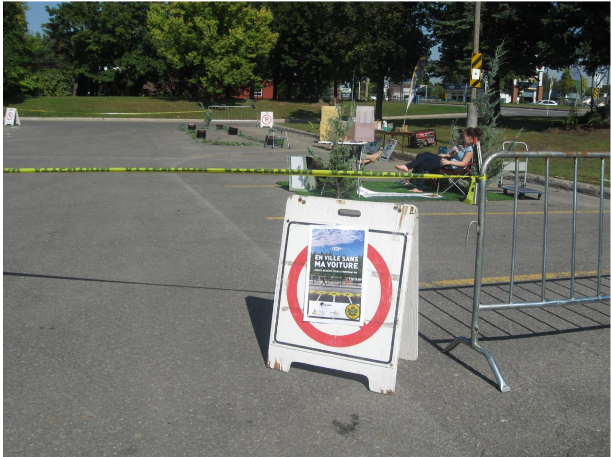
PARK(ing) Day Laval 2013 des Clubs 4-H du Québec