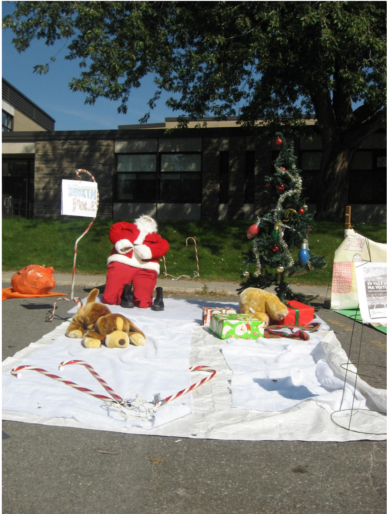
PARK(ing) Day Laval 2013 de Souvenir School