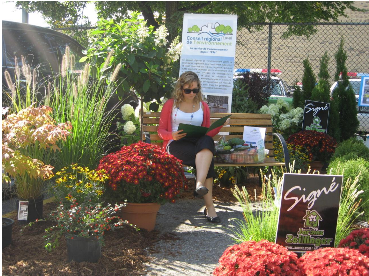
PARK(ing) Day Laval 2013 du Conseil Régional de l'environnement de Laval