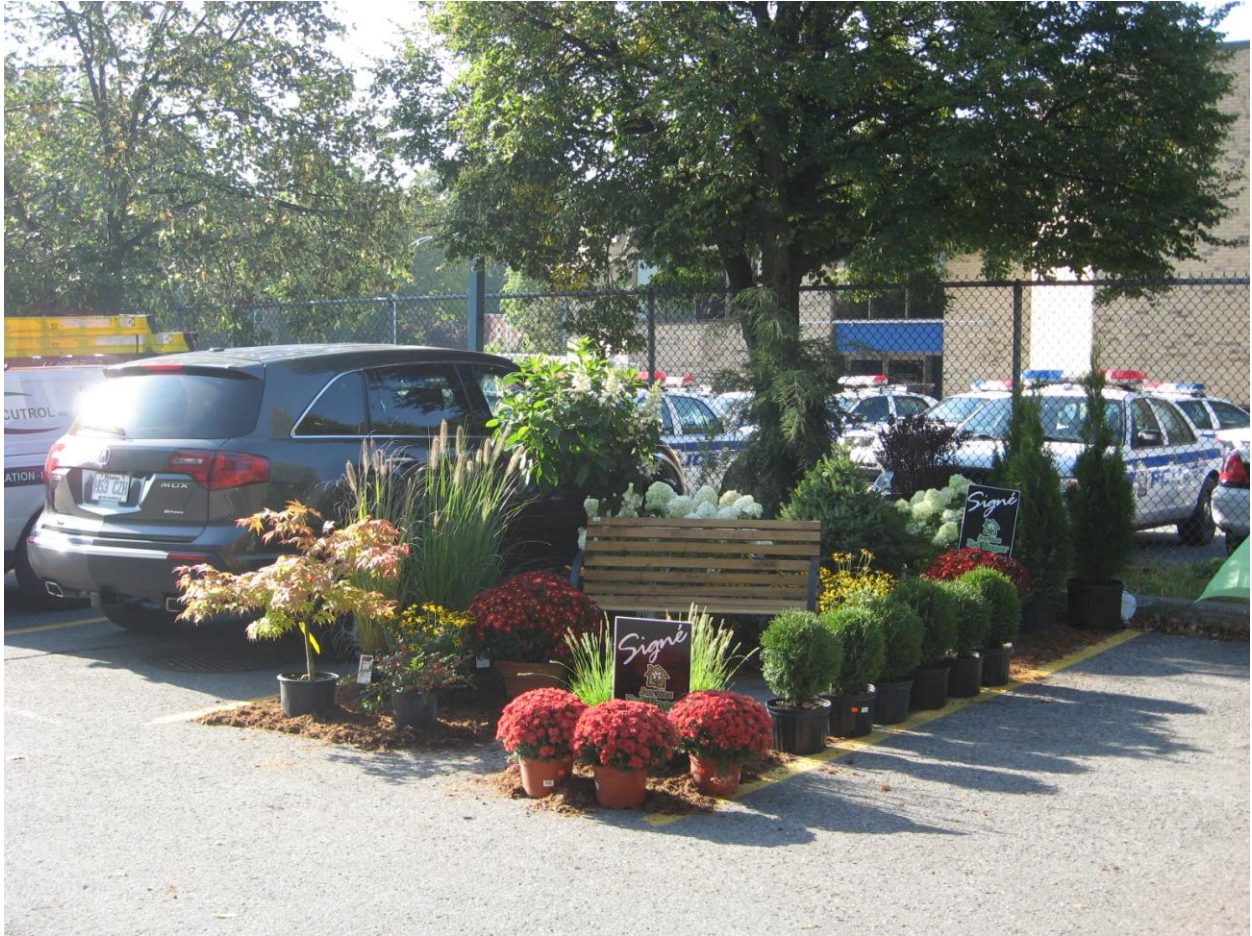
PARK(ing) Day Laval 2013 du Conseil Régional de l'environnement de Laval