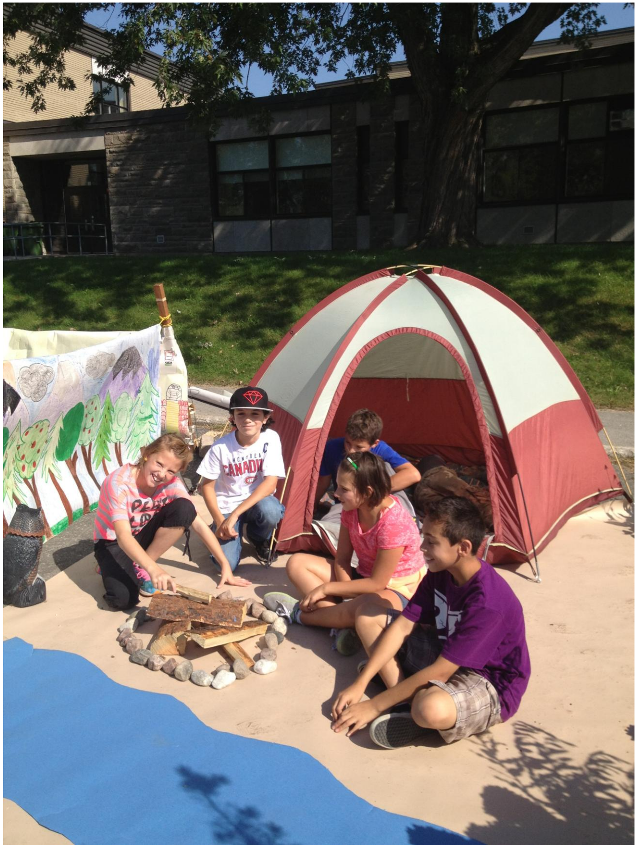
PARK(ing) Day Laval 2013 de Souvenir School