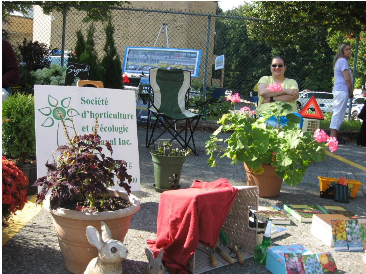
PARK(ing) Day Laval 2013 de la Société d'horticulture et d'écologie de Laval