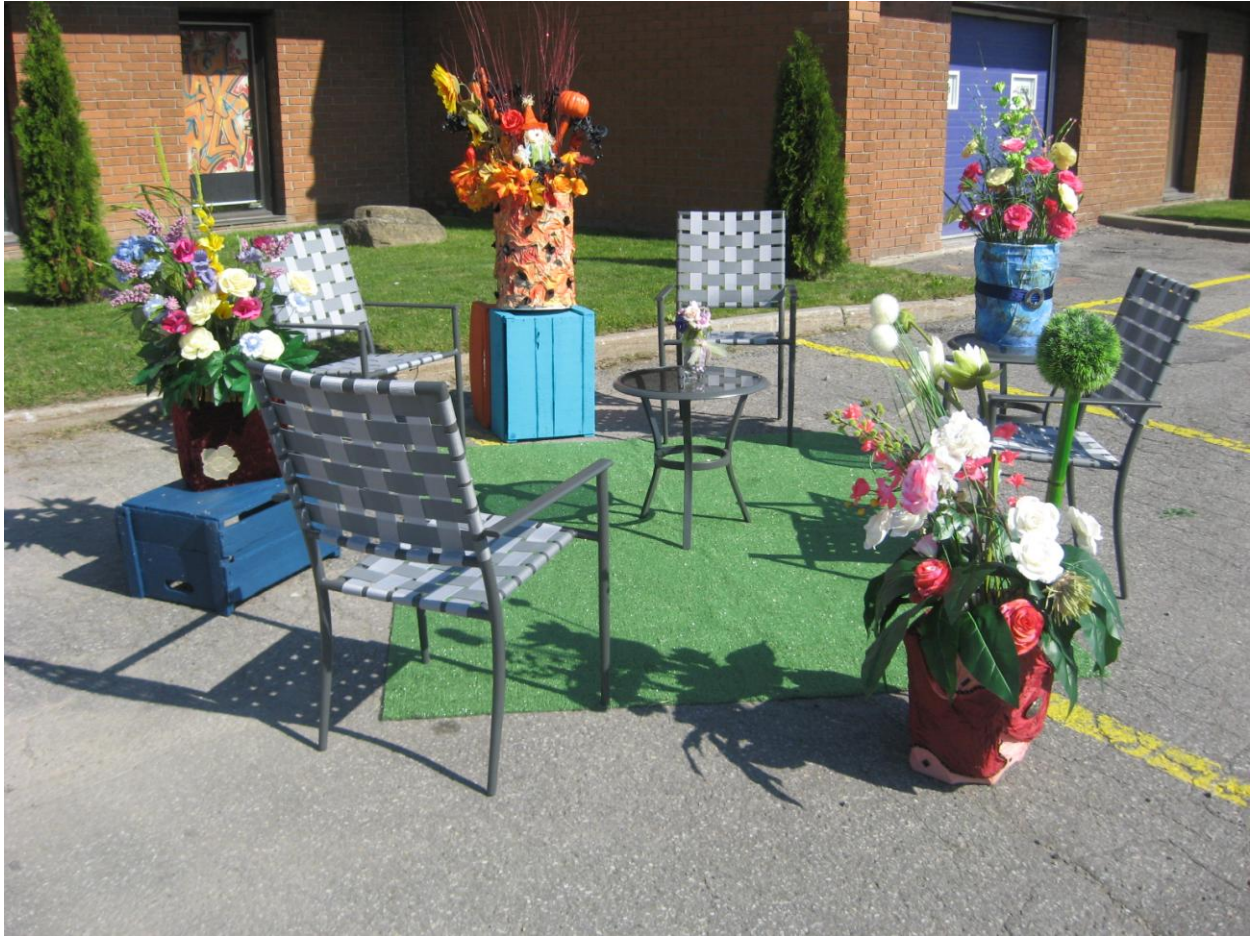
PARK(ing) Day Laval 2013 de Textil' Art