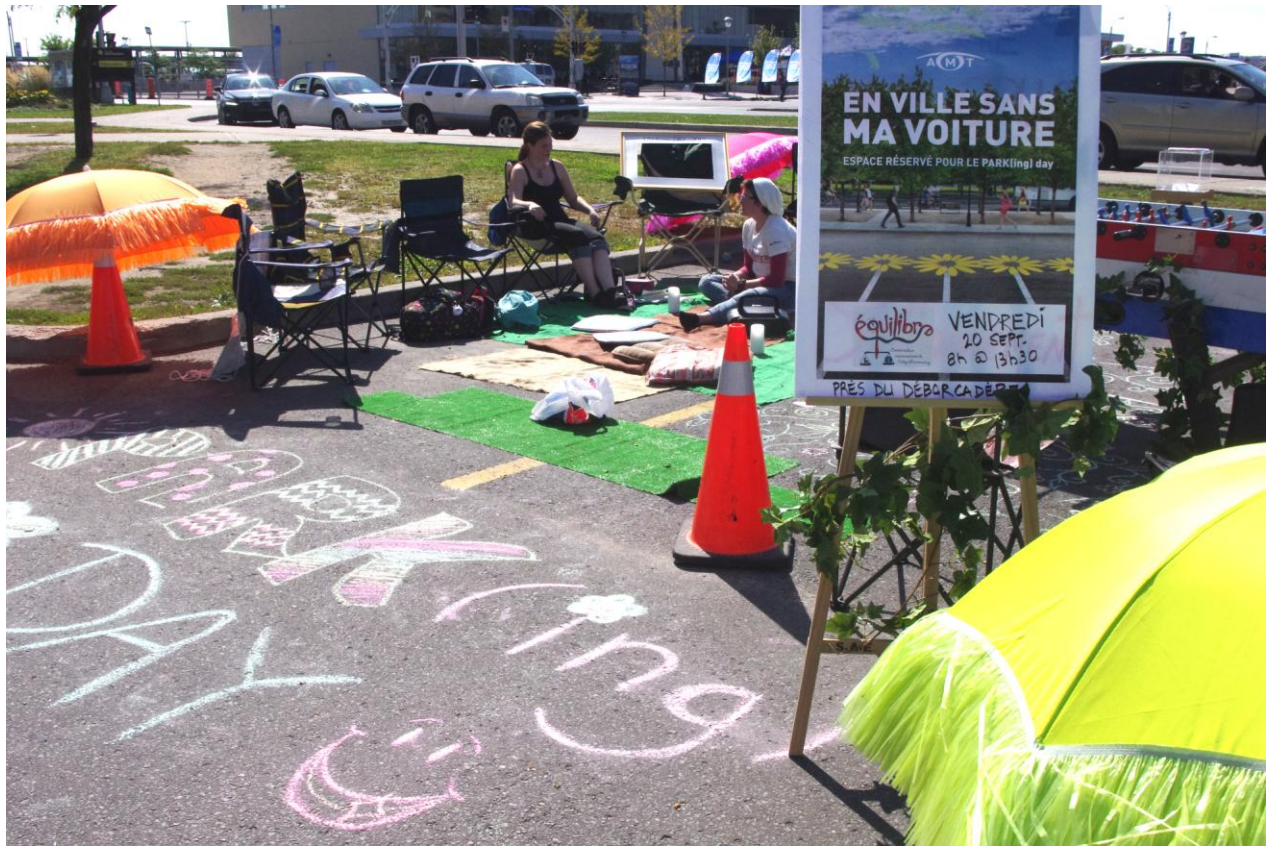
PARK(ing) Day Laval 2013 du Comité Équilibre du Collège Montmorency