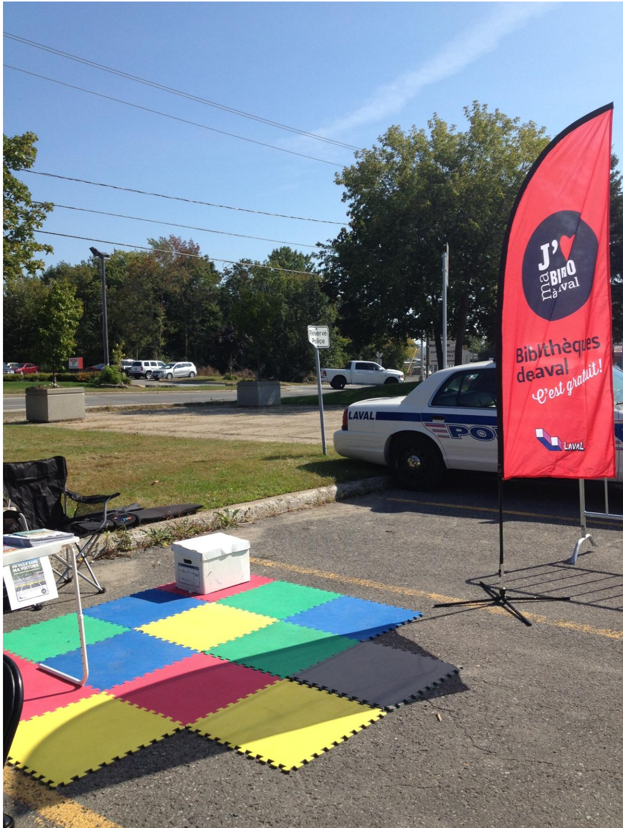
PARK(ing) Day Laval 2013 de la Bibliothèque Philippe-Panneton