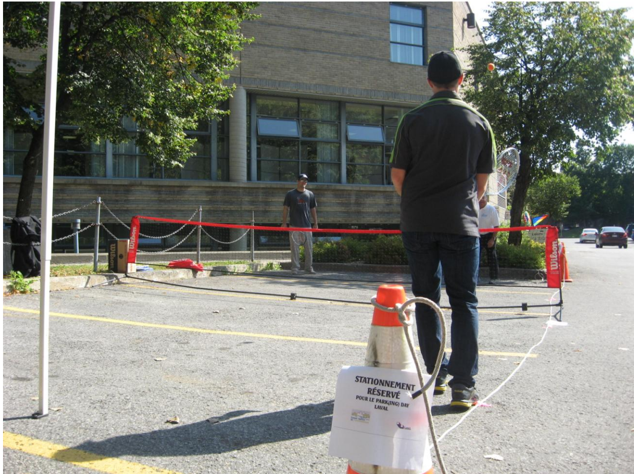
PARK(ing) Day Laval 2013 de Sports Laval