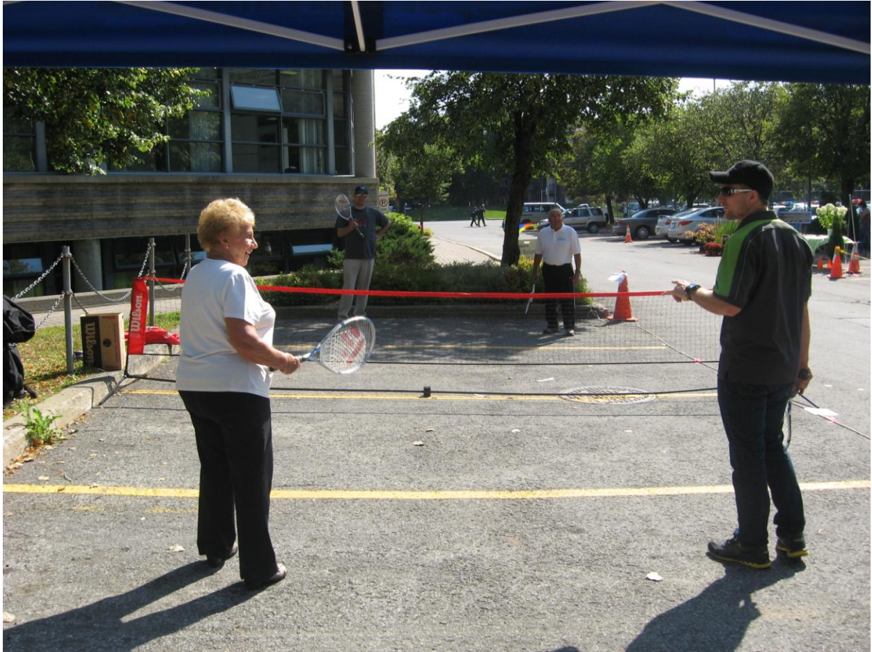
PARK(ing) Day Laval 2013 de Sports Laval