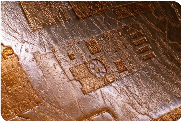
Fossilation , exposition « Matières d'image », Festival Hors Pistes, Centre Georges Pompidou, Paris, 2021