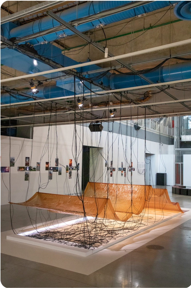
Fossilation , exposition « Matières d'image », Festival Hors Pistes, Centre Georges Pompidou, Paris, 2021