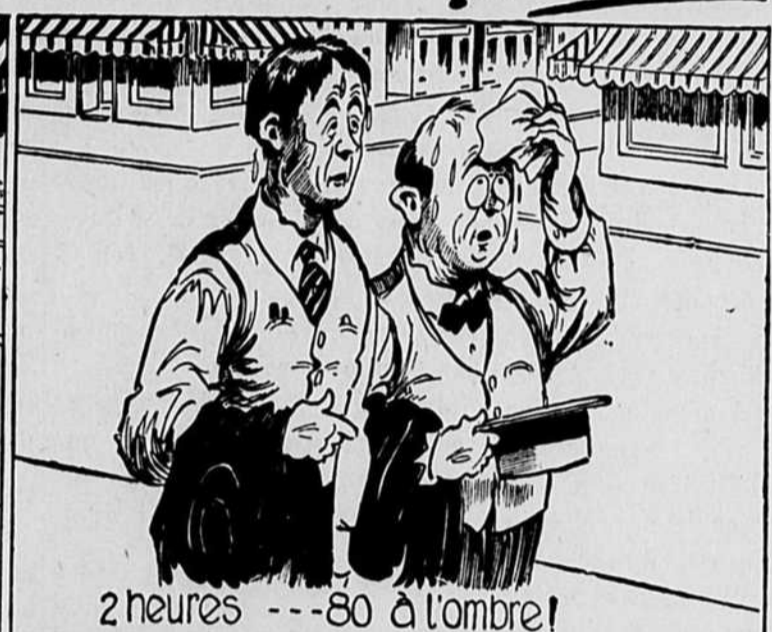
2 heures --- 80 à l'ombre!