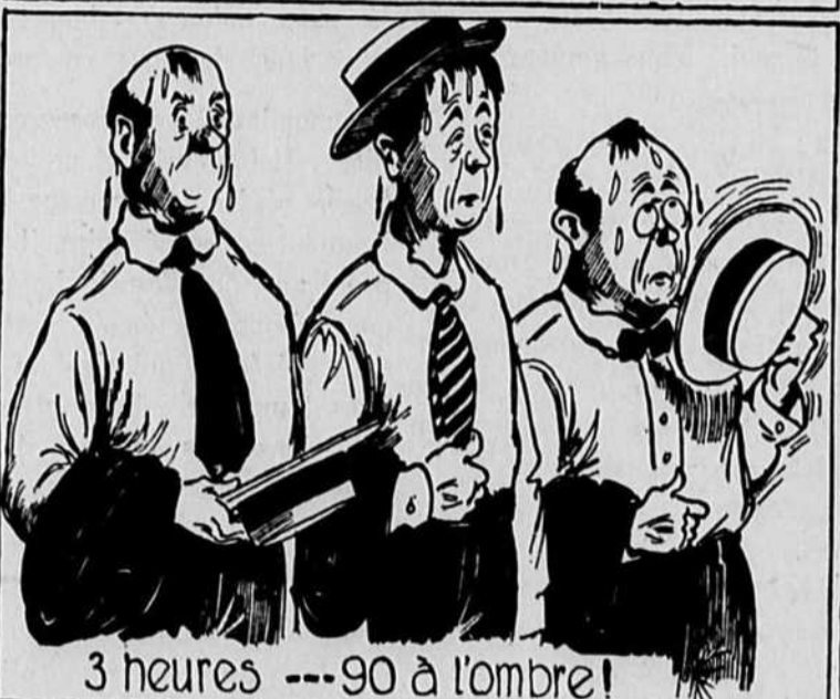
3 heures --- 90 à l'ombre!