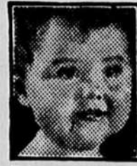
TABLETTES BABY'S OWN du Dr. Williams