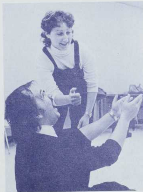
Pratique lors d'un atelier au Carrefour de théâtre d'amateur-e-s des Laurentides.

A vendre/amplificateur 35 watts et une colonne de son. Denise Couture (514) 351-4733