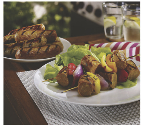
Saucisses européennes (congelées): Italiennes douces, fortes cheddar et bacon 2 kg