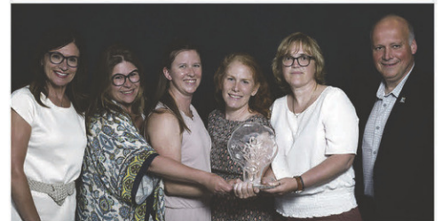
Dans la catégorie « Organisme à but non lucratif et groupe de citoyens reconnu », le prix a été décerné à Loisirs Saint-Hugues .