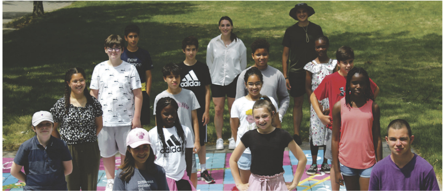
Les jeunes coopérateurs de l'édition 2022 de la CIEC.

Par la création de leur propre entreprise coopérative de services estivaux, les participants au projet se tailleront un