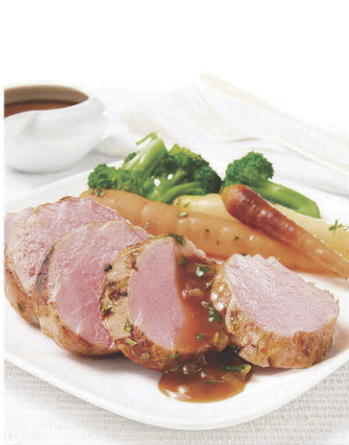
Filet de porc frais