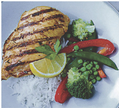
Poitrines de poulet assaisonnées (congelées) 2 kg