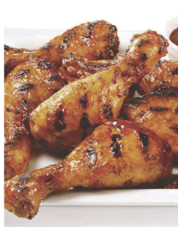
Pilons poulet BBQ cuits