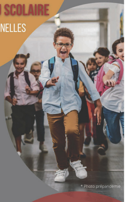
* Photo prépondémie