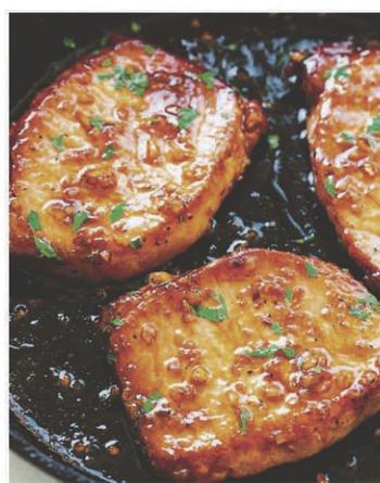
Côtelette de porc Teriyaki