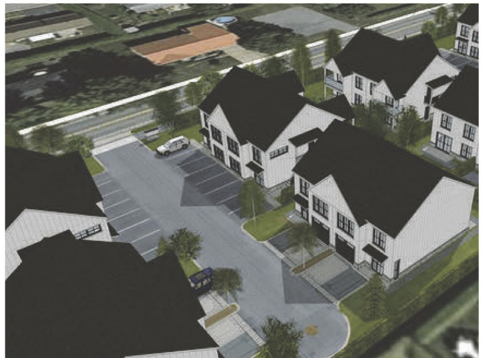
Seize unités de style farmhouse moderne verront le jour à La Présentation d'ici le printemps 2023 sur le site de l'ancienne salle Chez Jacques.