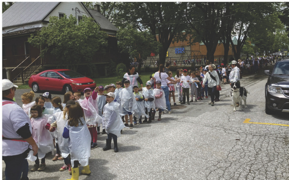
Les élèves de l'école Henri-Bachand ont investi les rues de Saint-Liboire en soutien à l'Ukraine.

La manifestation réunissait l'ensemble des élèves, mais aussi toute l'équipe-école ainsi que plusieurs parents. Les élèves ont pu réutiliser une activité sur la paix réalisée en début d'année. Le collectif de drapeaux blancs a été utilisé comme symbole de la paix lors de la marche.