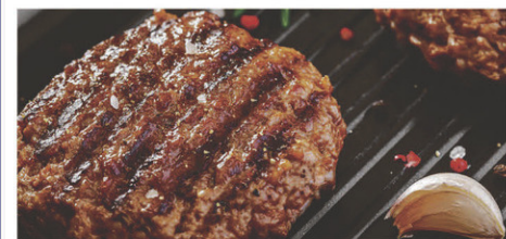
Galettes de porc assaisonnées