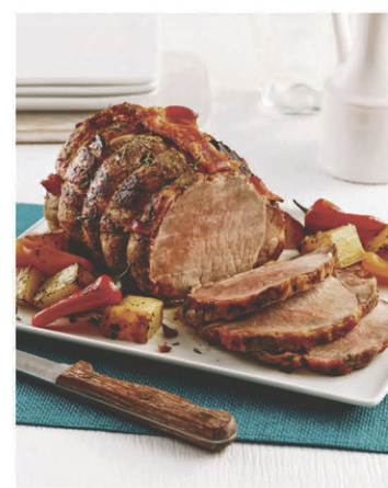
Rôti de porc assaisonné