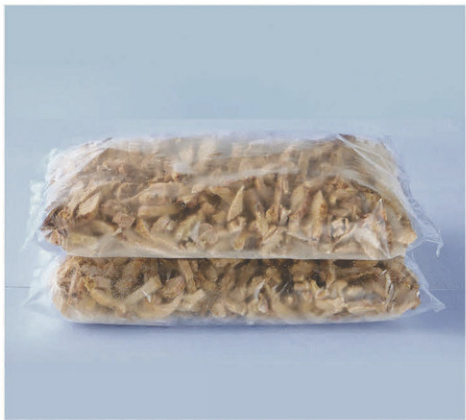
Lanières de poulet cuites style Fajitas (congelées) 2 kg