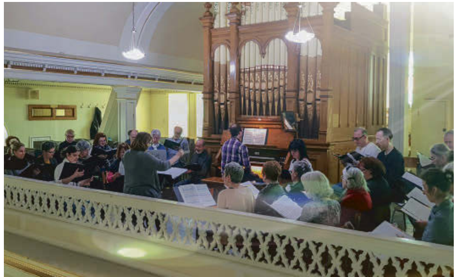
L'église Saint-Fulgence de Durham-Sud accueillera un concert ce dimanche 5 mai, à 14 h, avec en vedette « Gloria » d'Antonio Vivaldi.

En plus de l'œuvre de Vivaldi, les 40 choristes - sous la direction de Sylvie