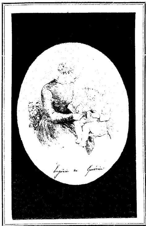
EUGÉNIE DE GUÉRIN