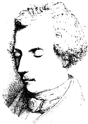
MAURICE DE GUÉRIN