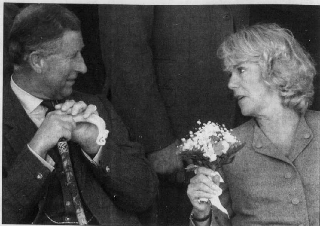
Le prince Charles a déjà indiqué que sa future épouse, Camilla Parker Bowles, deviendra princesse consort dans l'éventualité où il accèderait au trône d'Angleterre.