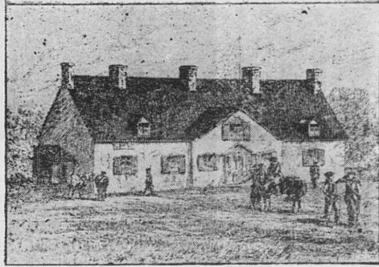
MANOIR DE BEAUPORT