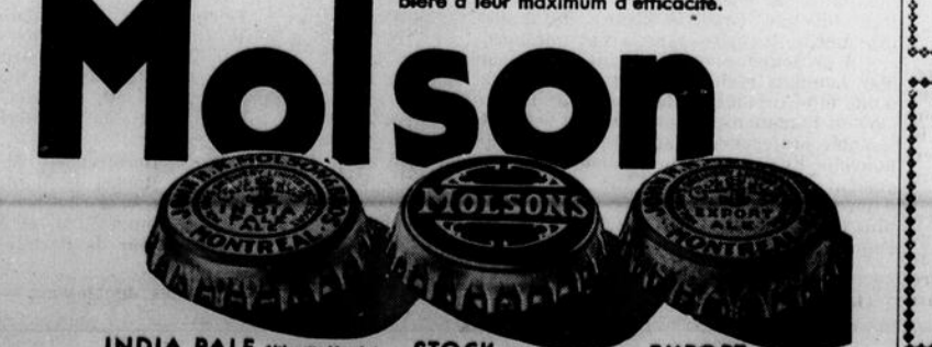
INDIA PALE (Molsons) STOCK (Molsons) EXPORT (Molsons)

Il y a de la santé et de la gaieté dans ces trois bières de bonne consistance. Pétillantes, moelleuses et vivifiantes, elles donnent toujours pleine satisfaction. Choisissez celle qui vous plaît le plus et bénéficiez des propriétés rafraichissantes et tonifiantes de la bière à leur maximum d'efficacité.