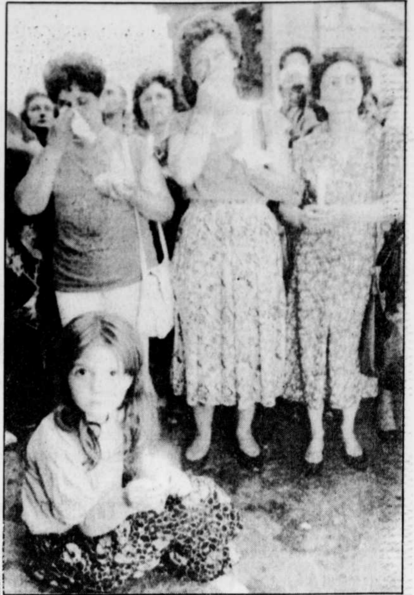
Ces femmes croates qui ne peuvent retenir leurs larmes ont participé mercredi à Zagreb à une assemblée pour protester contre la mise à sac d'un village croate par des terroristes serbes.

Des informations émanant de Croatie et de Serbie ont fait état de pourparlers secrets visant à remodeler le tracé de la frontière entre les deux républiques.