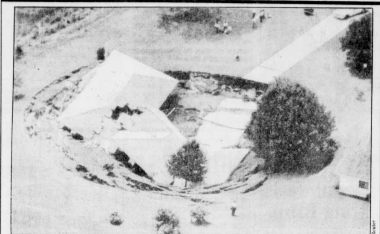
Affaissement de terrain

En début de semaine, un ancien responsable de la centrale américaine de renseignement, Alan Fiers, a plaidé coupable d'a-