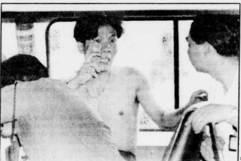
Torse nu, l'un des quatre convoyeurs de fonds explique à la police que les voleurs semblaient avoir bien préparé leur coup.

Le fourgon transportait dix sacs contenant 17 millions de dollars américains et trois millions de dollars de Hong Kong (430 000 $) qui devaient être acheminés à Taiwan.