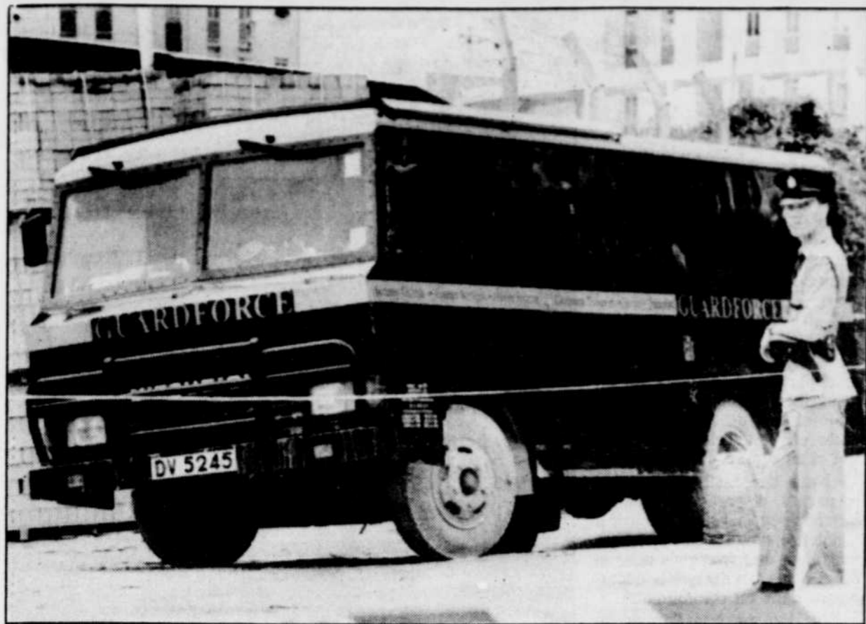
Les quatre convoyeurs de fonds ont été abandonnés, ligotés et les yeux bandés, dans leur camion.