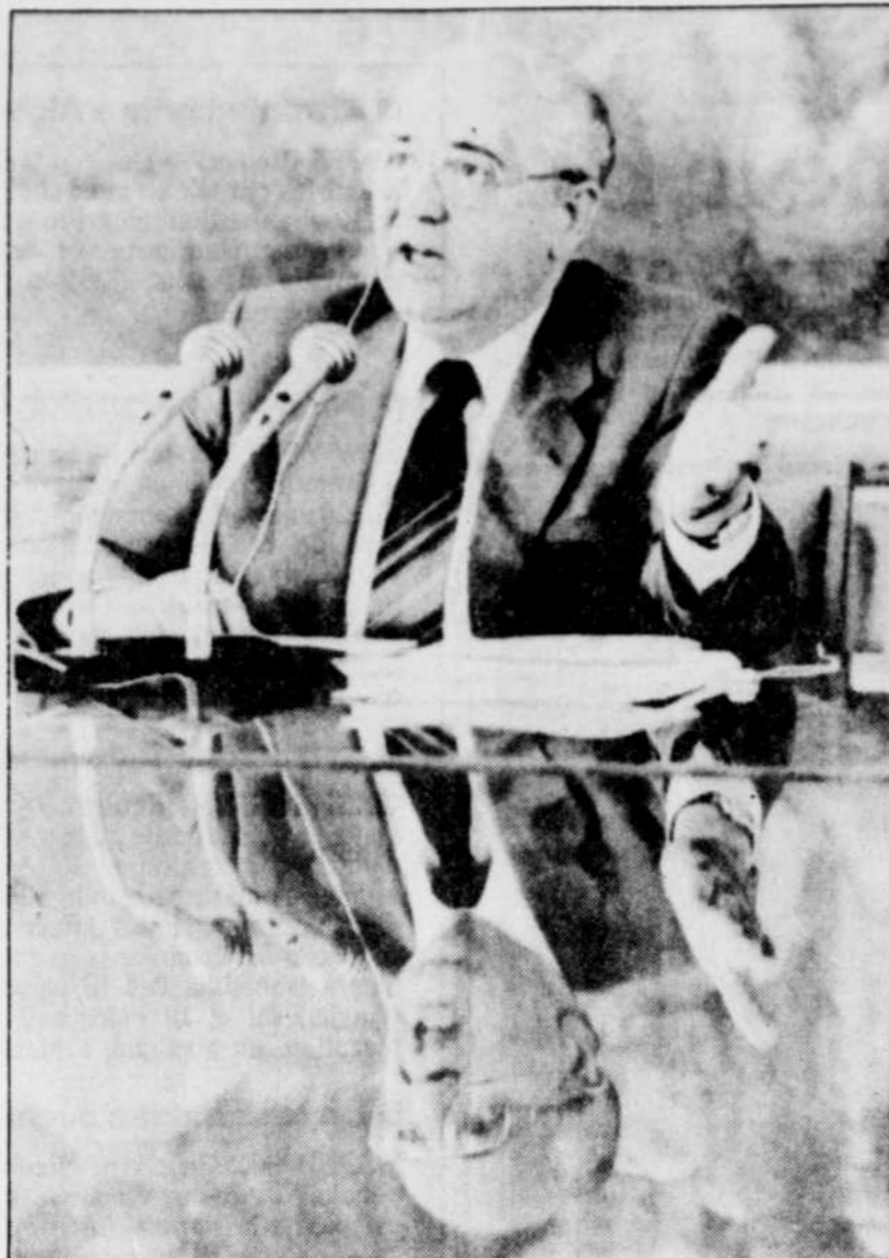
Lors de la conférence de presse d'hier à Moscou, la surface polie du pupitre de Gorbatchev a permis à un photographe de réaliser cette surprenante photo.

Il a estimé que cette intégration de l'Union soviétique à l'économie mondiale « implique son appartenance à toutes les institutions mondiales dans le domaine économique ».