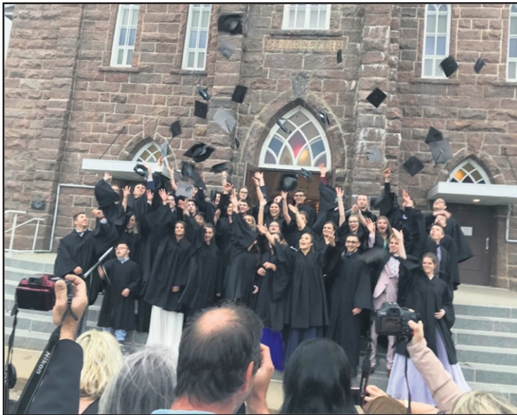
Le bal de finissants, l'événement ultime qui clôt une étape importante dans la vie des jeunes. Sur le parvis de l'église St-Marcellin des Escoumins, le traditionnel lancer du mortier qui a suivi la collation des grades. Bravo à tous ces jeunes !