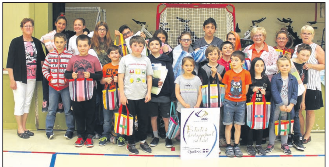
Les élèves de l'école Mgr-Bouchard ont eu droit à une petite cérémonie et un léger goûter afin de souligner la fin de leur projet de tissage avec le Cercle des fermières de Portneuf-sur-Mer.