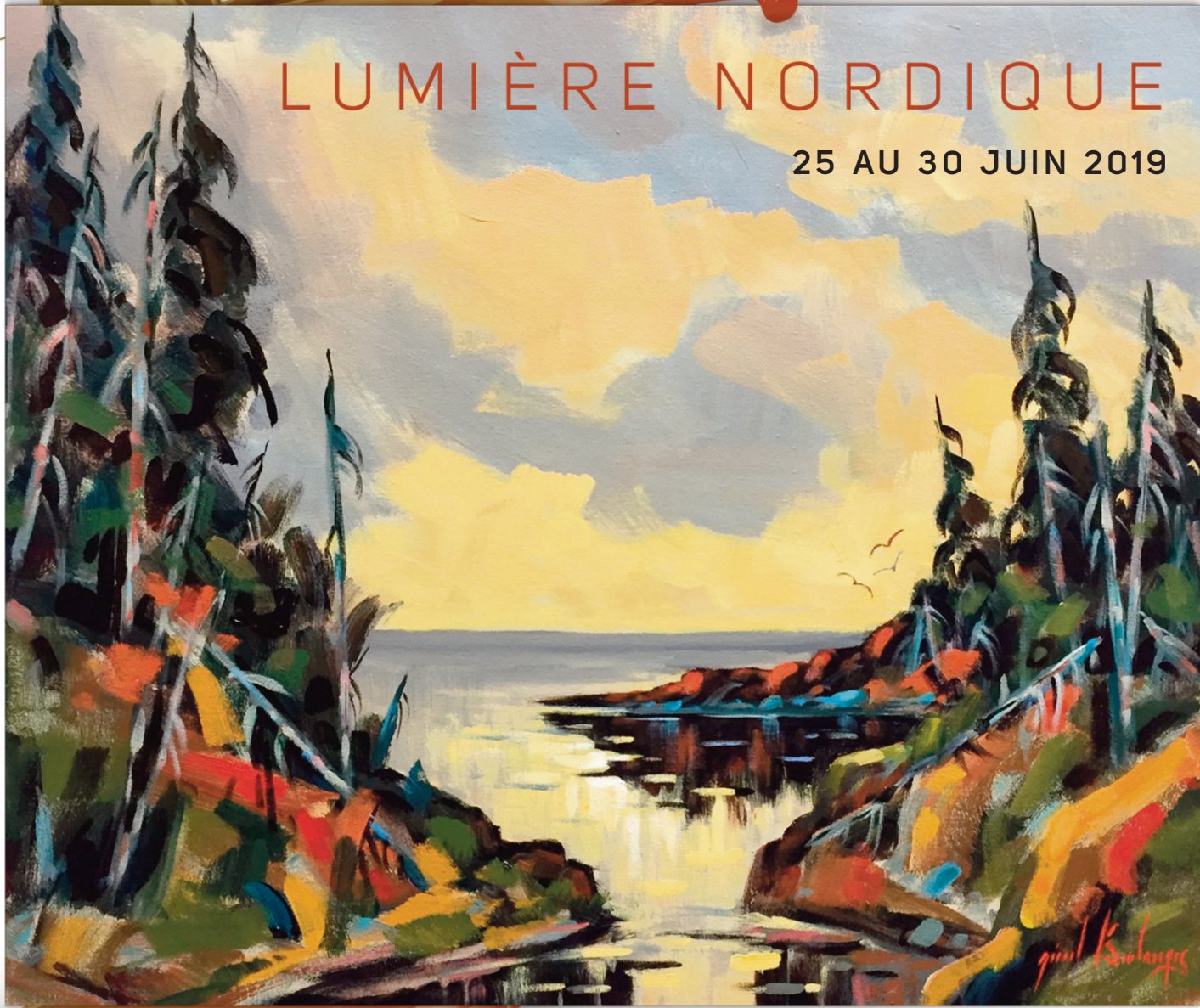
Lumière Nordique de M. Gérard Boulanger - Acrylique sur toile - 20 X 24