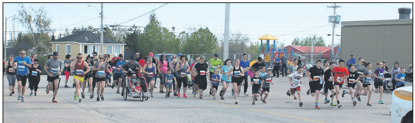
Cette journée amicale qui fait la promotion du sport se veut une activité familiale et rassembleuse.