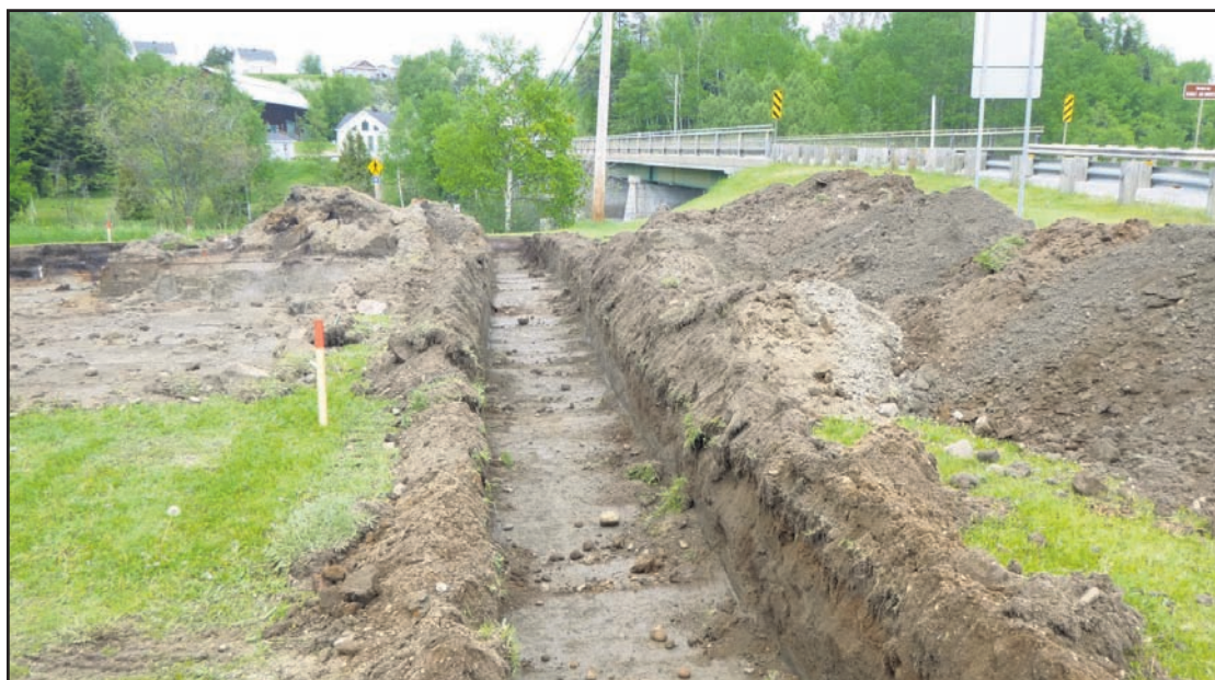
Six tranchées ont été creusées près de la rivière Sault-au-Mouton.

Il a été impossible d'obtenir la version du ministère des Transports à ce sujet avant de mettre sous presse.